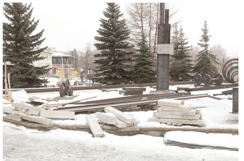
Площадки с заводской техникой реконструируют.

После того как состоялась реконструкция набережной, территория за лодочной станцией осталась единственным неухоженным местом на пути от Демидовской дачи до Лисьей горы. Тагильчане старались обходить его стороной, особенно летом, когда выростала трава по пояс, а разросшиеся деревья одевались в листву. Мусор там копился годами: убирать некому, участок, как это сейчас