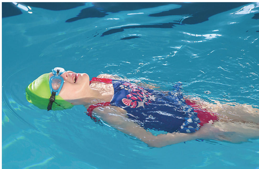
Она же – на воде.