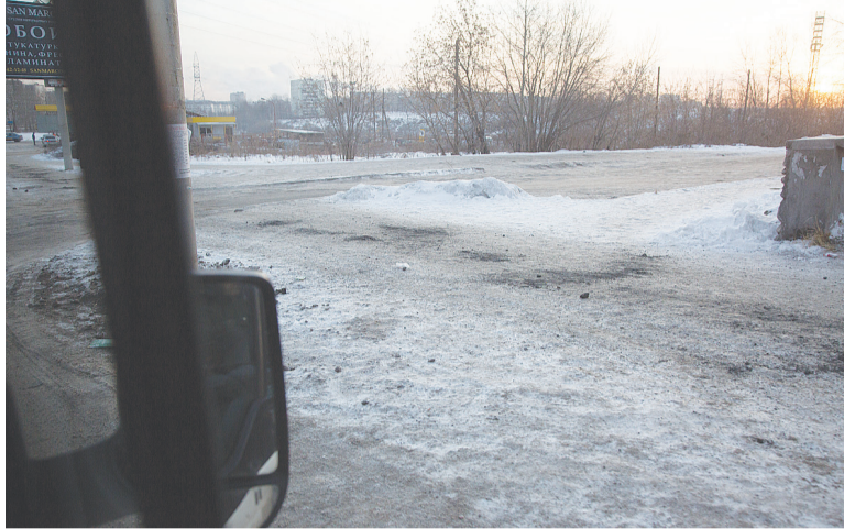
Вчера мы проехали и прошли по некоторым улицам, по поводу которых были звонки от читателей. Начало улицы Космонавтов – забота о пешеходах видна издали. А вот дальше, на самом мосту в сторону Красного Камня, ходить скользко.

Мы получили несколько откликов на вторичный репортаж о гололедице. Жители улицы Кутузова рассказали, что пожаловались на обледеневшие тротуары в администрацию Тагилстроевского района. Им сообщили, что проблемой занимаются квартальные, они уже обратились к хозяевам всех крупных торговых точек, просили принять меры. Читатели отмети-