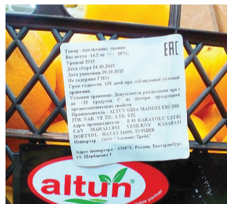
Апельсины из Турции успели приехать до начала санкций.

Ограничительные меры в отношении Турции в связи с атакой на российский Су-24 начали вступать в силу. В Ростуризме пообещали применять санкции к туроператорам, продолжающим продавать путевки в Турцию. Ведомство будет отслеживать информацию о таких продажах и принимать меры. Убытки Турции от прекращения туристического потока из России глава Ростуризма Олег Сафонов оценил примерно в 10 миллиардов долларов. По его словам, эту страну посещали более 4,4 миллиона российских туристов в год.