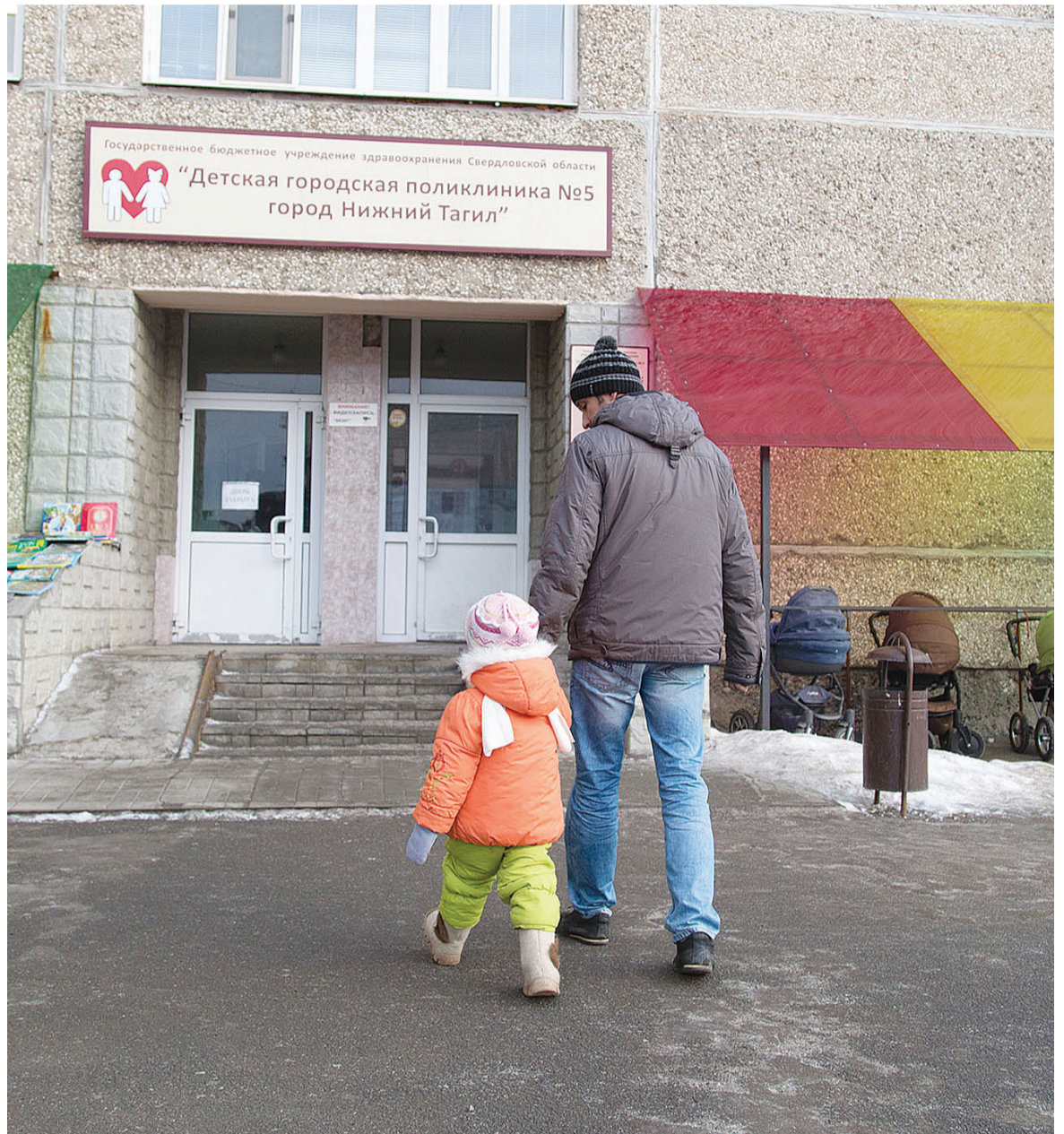
Поход в поликлинику.

Почему всплеск кишечной заболеваемости так трудно приостановить? Здесь врачи единодушны: в отличие от отравлений, дизентерии ротавирусы передаются не только через бытовые предметы, продукты питания, но еще и воздушно-капельно.