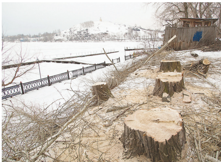
Огромные тополя закрывали вид на Лисью гору.

Татьяна ШАРЫГИНА