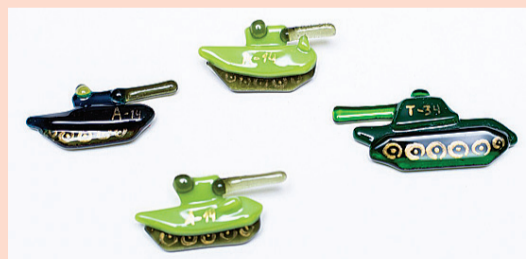
Сувенир танк Т-34 и «Армата».