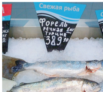
Цена турецкой рыбы «кусается».

Как запрет на made in Turkey может повлиять на рынок продовольствия и турист услуг