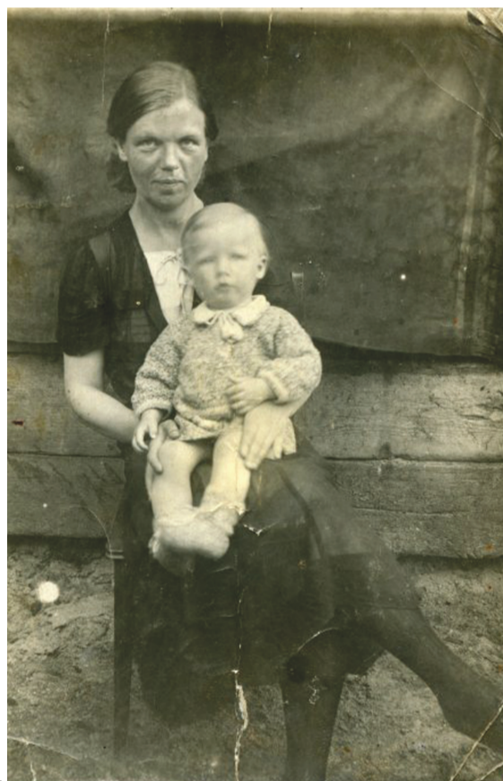
Старшая сестра с сыном.

два-три шага - и услышали гул. Бросились назад и сразу упали в снег под елку. И тут же очень низко пролетел огромный самолет с крестами на крыльях. Немцы охотились на партизан. Нас спасло всего несколько шагов.