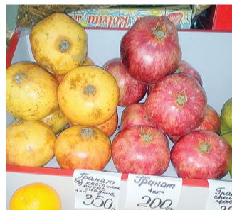
Обратите внимание на цену гранатов: справа – Турция, слева – Израиль.