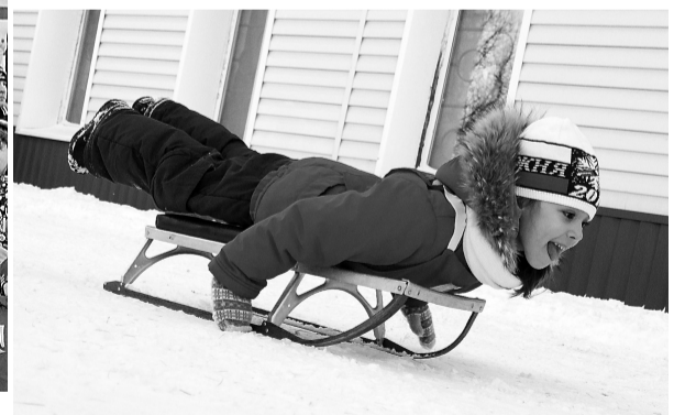
На санках по равнине: не быстро, но весело!

Летние здесь проходят ежегодно, идею подхватили и в других районах, а вот снежный вариант опробовали впервые.