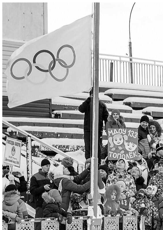
Олимпийский флаг подняли воспитанники ДОУ №6, победители малых летних Олимпийских игр.

В Тагилстроевском районе родилась новая традиция: для воспитанников детских садов провели малые зимние Олимпийские игры