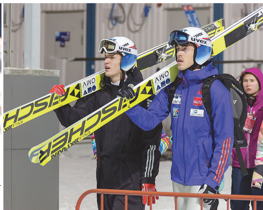
Участники соревнований готовятся к старту.

Этап Кубка мира прошел в нашем городе во второй раз. Год назад организаторы получили самые высокие оценки, поэтому кандидатура Нижнего Тагила уже не вызвала ни удивления, ни вопросов. Практически все иностранные «звезды» заявили о том, что планируют визит на Урал.