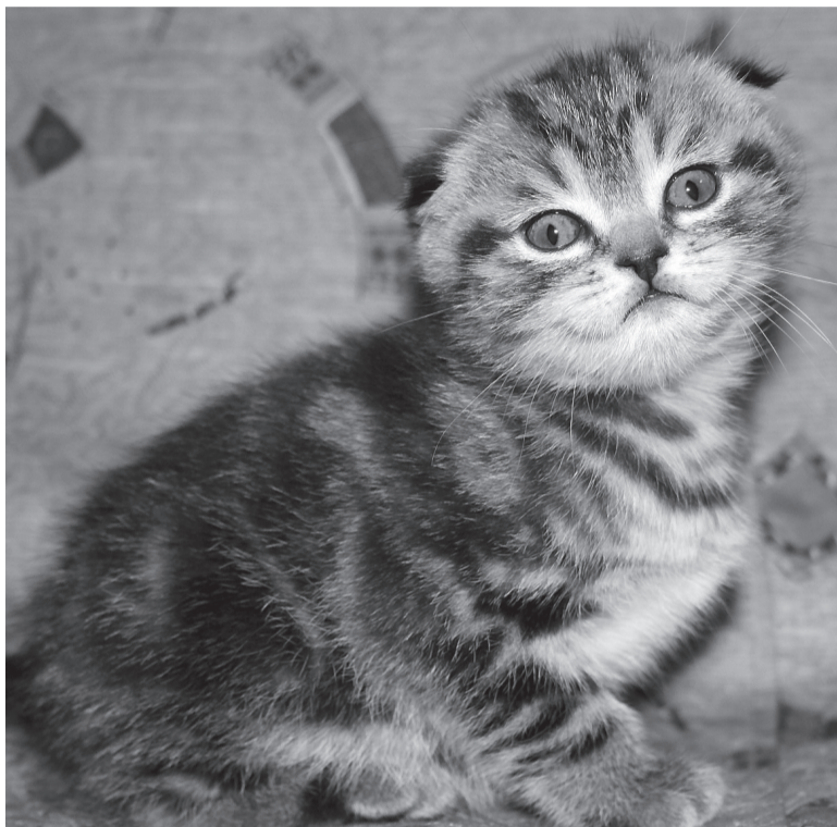
Забавная внешность шотландских вислоухих сделала породу хитом продаж.

На Новый год родители нередко планируют подарить детям котенка. Для поиска чаще всего используют рекламные объявления: купить «с рук» дешевле, чем в питомнике. Да и выбор сейчас огромен: доморощенных заводчиков становится все больше