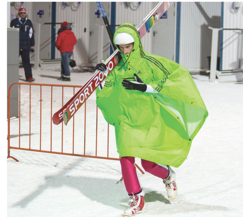
От ветра защищали накидки.

– Мне очень нравится тагильский трамплин, – сказала