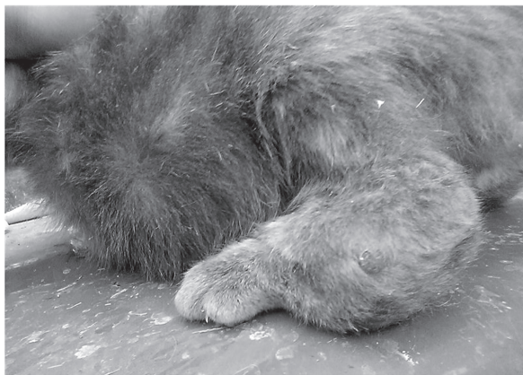
Мультик из краснодарского приюта и Клепа, выброшенная на улицу и подобранный волонтерами, - типичные примеры многолетних хаотичных вязок. 10 лет назад таких экспонатов кунсткамеры не было, максимум - это сросшиеся хвостовые позвонки и небольшая хромота.