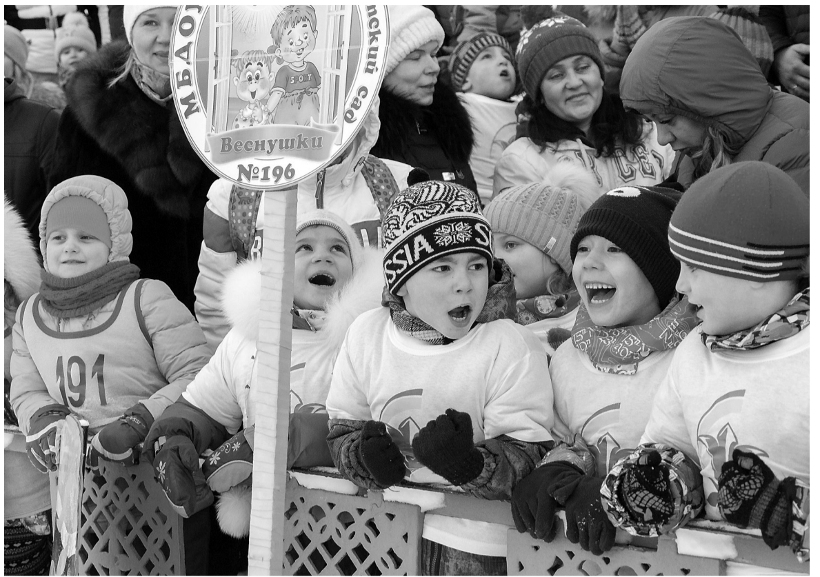
На церемонии открытия соревнований.