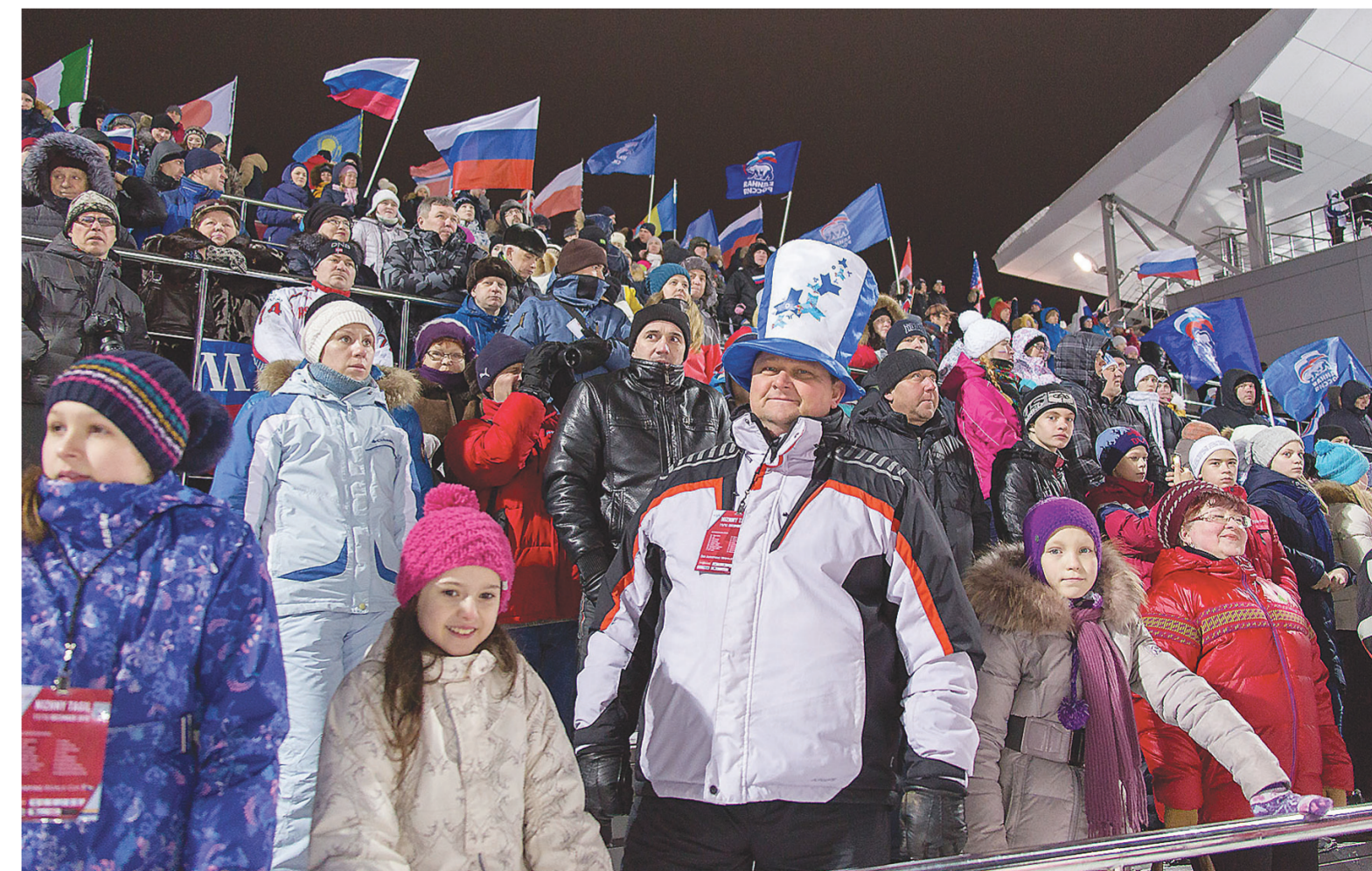
Главная трибуна заполнена до отказа.