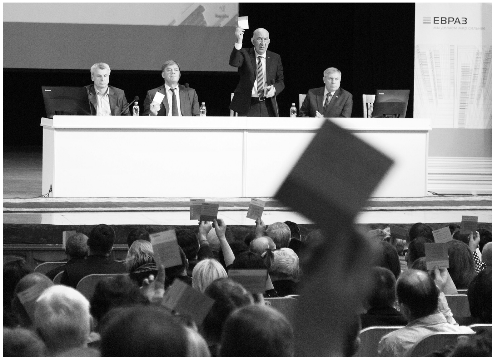
Идет голосование.

Заложено финансирование программ поддержки молодых сотрудников и ветеранов