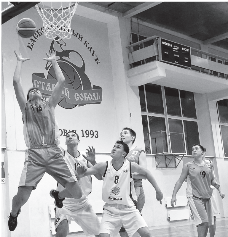
Момент матча «Старого соболя» с «Енисеем».