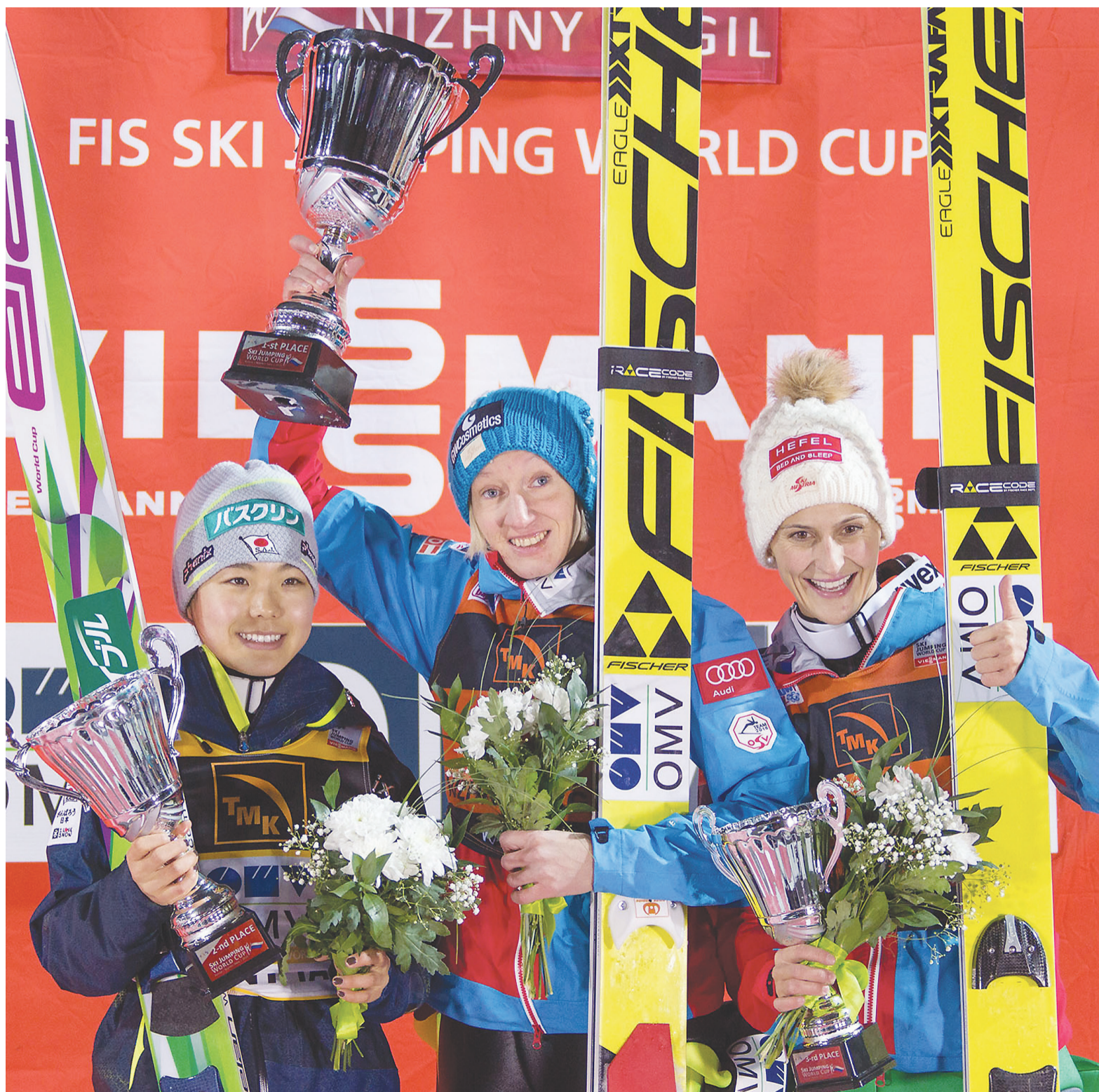
Призеры первого дня на пьедестале почета (слева направо): Сара Таканаси, Даниэла Ирашко-Штольц и Ева Пинкелниг.