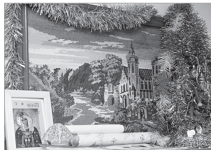
Картина, вышитая крестом.