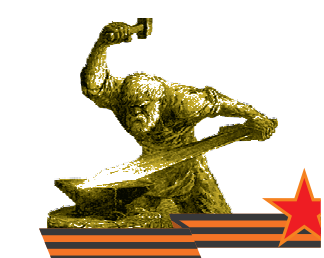
■ Великой Победе - 70