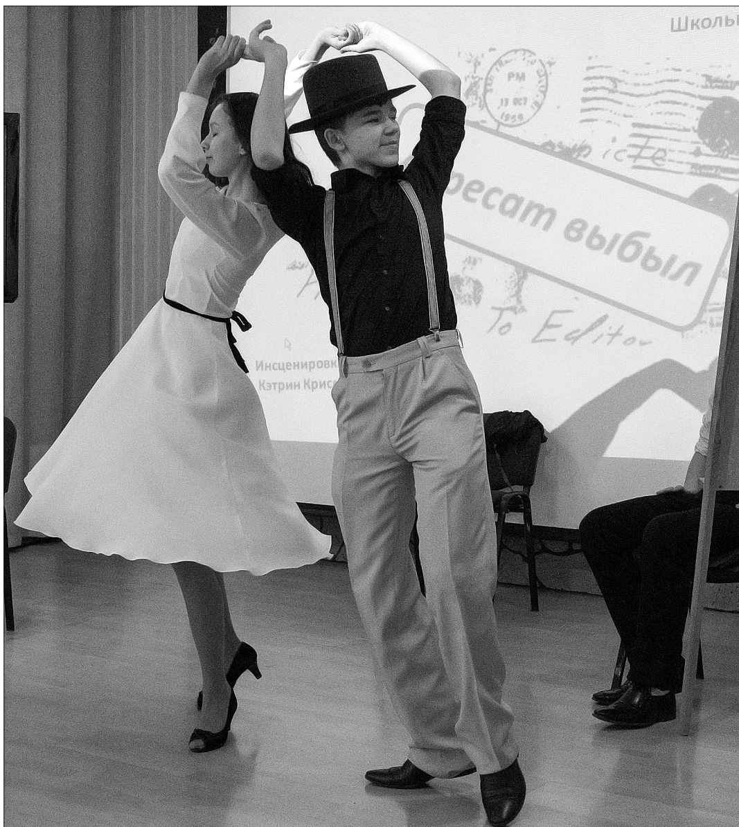
Фрагмент спектакля «Адресат выбыл».