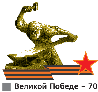
Великой Победе - 70