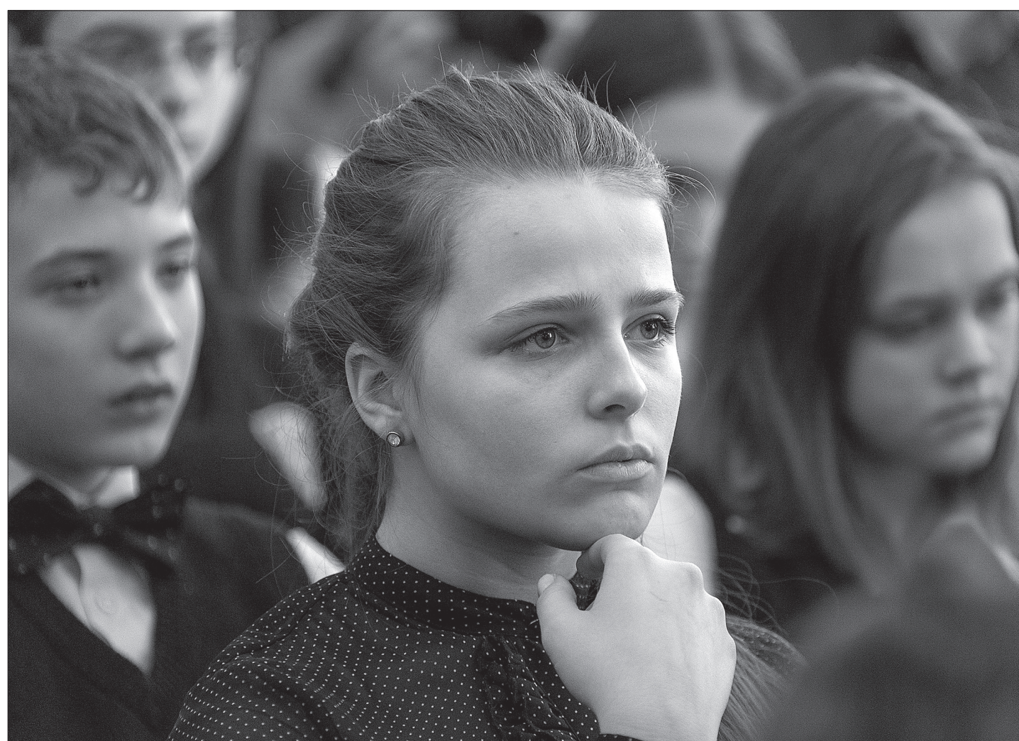
Игра сверстников из Екатеринбурга произвела впечатление на молодых тагильчан.

В честь Международного дня памяти жертв Холокоста и 70-летия Победы в Великой Отечественной войне в гимназии №86 Нижнего Тагила совместно с педагогами и учащимися школы №167 Екатеринбурга был организован двухчасовой урок памяти.