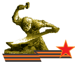
Великой Победе - 70

Госпиталь №2553 начал свою работу в здании школы №9 летом 1941 года. За всю войну здесь было проведено около двух тысяч операций, наибольшее количество - 819 - пришлось на 1943-й.