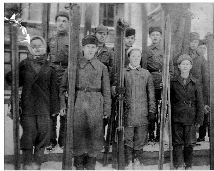
Команда лыжников госпиталя.

ли отвар и поили раненых. А еще бойцы очень любили