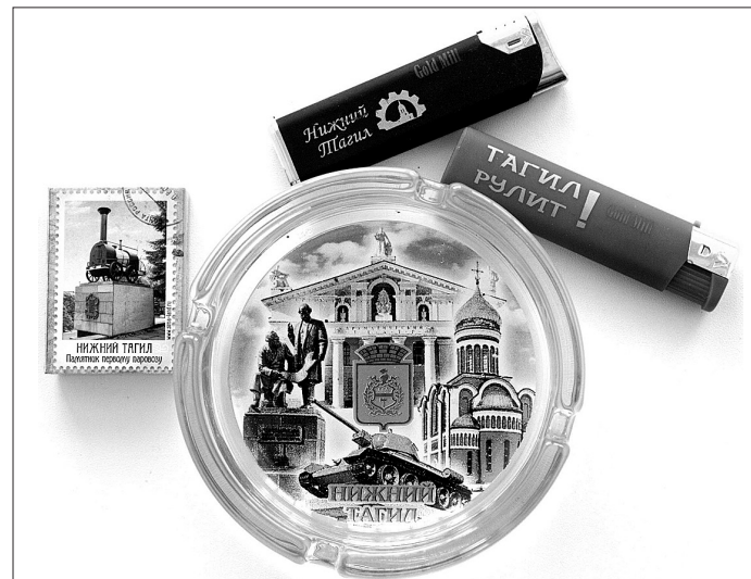
Тагильские сувениры: спички, зажигалки, пепельница.

Людмила ПОГОДИНА.