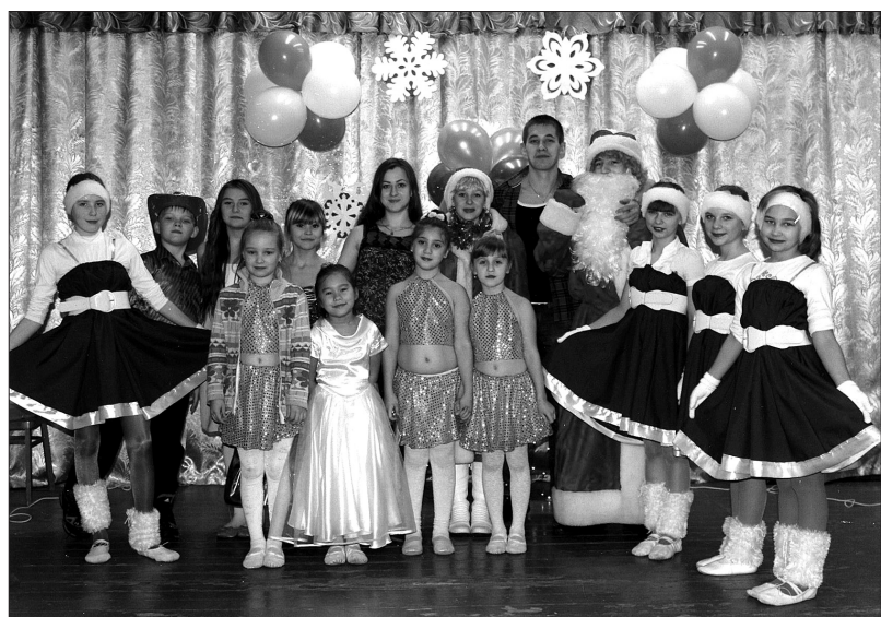
Юные таланты поселка.

В период новогодней кампании двери Дома культуры поселка Сухоложский были открыты для всех. Январь запомнится жителям не только веселыми праздничными программами, но и тем, что участвовали в них и взрослые, и дети.