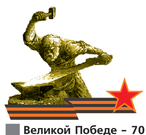
■ Великой Победе - 70