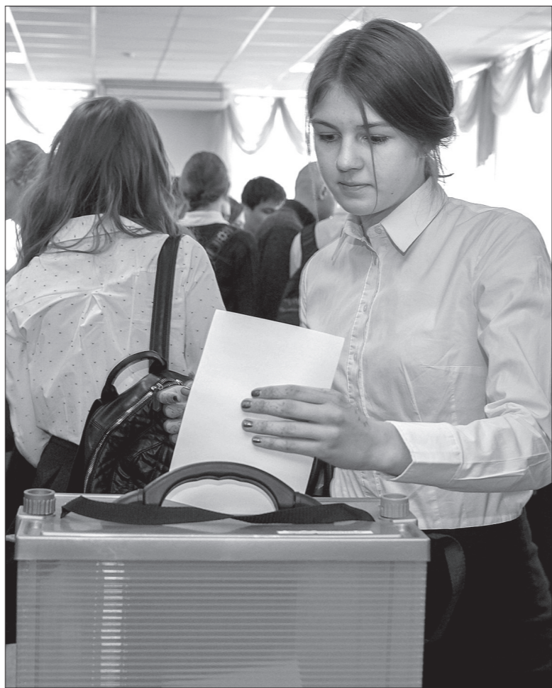
Сверстники активно голосуют за понравившихся кандидатов.

В школе №32 прошли выборы кандидата в Молодежную думу, которую создадут при Нижнетагильской думе. Планируется, что такой консультативно-совещательный орган привлечет молодых людей с активной гражданской позицией к обсуждению и решению проблем города.