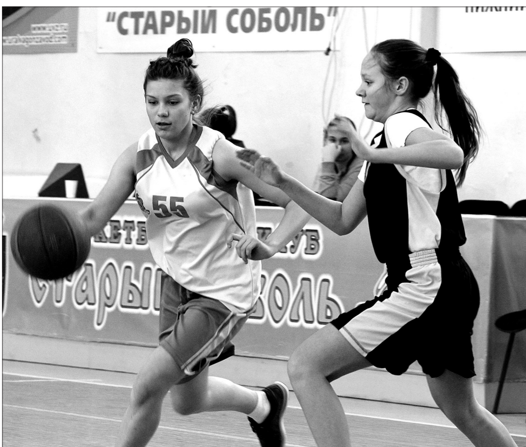
Момент матча «Тагилчанка-NEXT» - ДЮСШ Горноуральского.