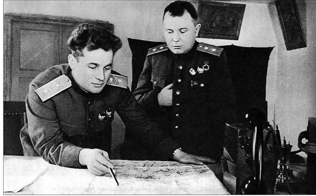
Генерал Черняховский (слева).