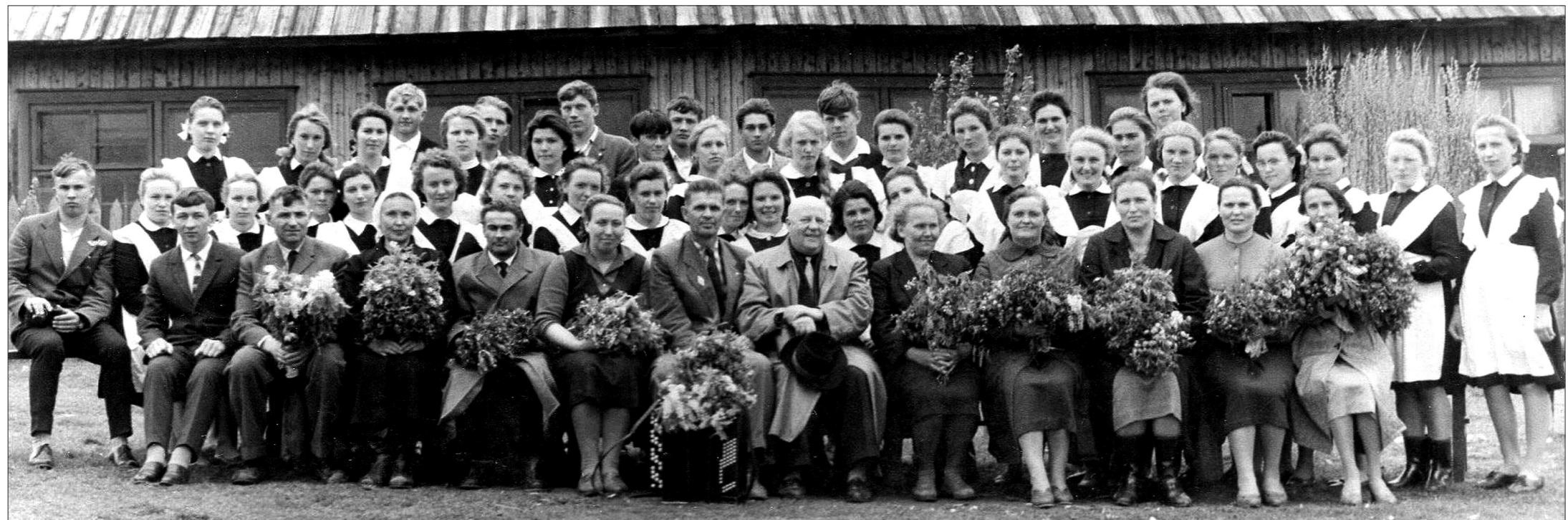
Фото 1965 года.