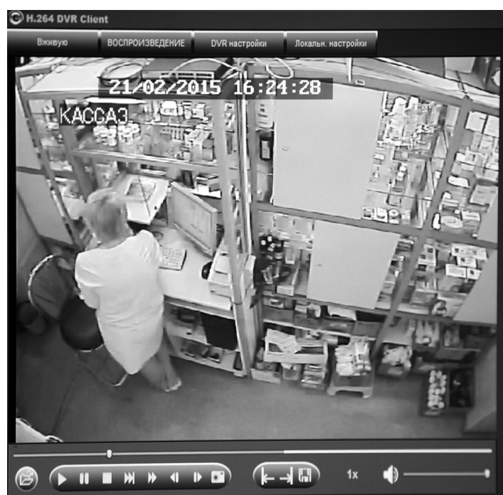
Видеозапись разговора фармацевта с покупательницей не подтвердила факта хамства.