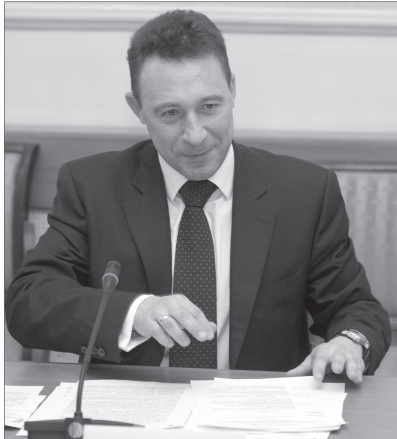
Игорь Холманских доволен тем, как в Нижнем Тагиле выполняются поручения президента.