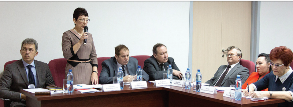
Идет совещание руководителей учреждений здравоохранения Горнозаводского округа.