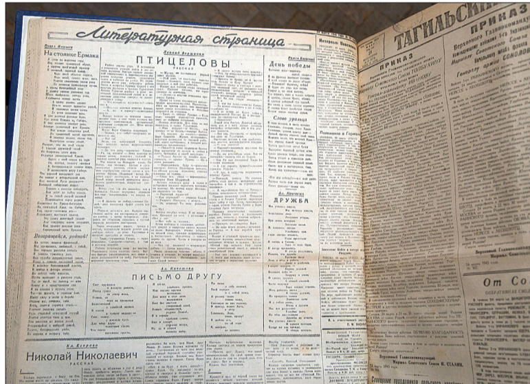
«Литературная страница» газеты «Тагильский рабочий» в марте 1945-го.

особое внимание тем педагогам, которые готовят нынче уроки и классные часы, посвященные 70-летию Победы.