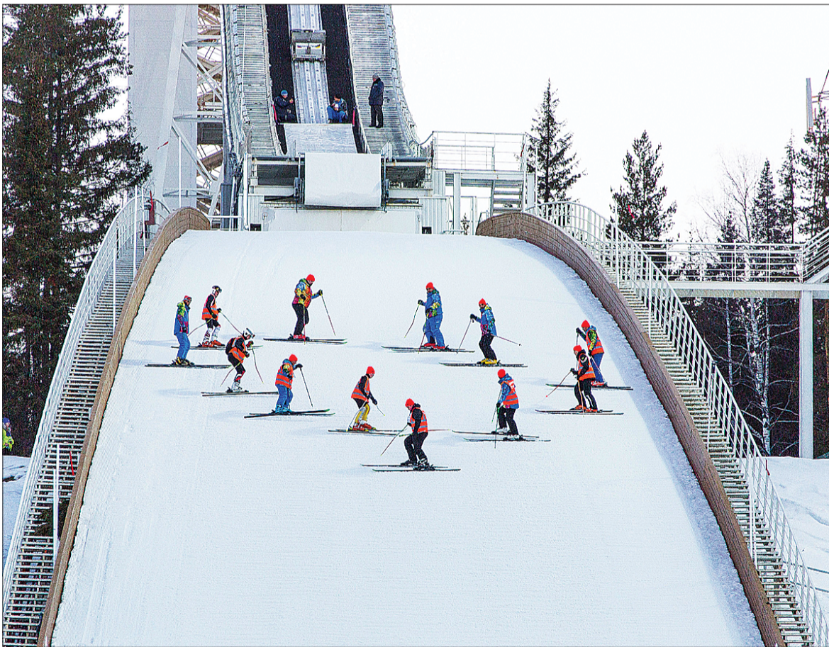
Подготовка трамплина к соревнованиям, специалисты уплотняют снег на горе приземления.

Татьяна ШАРЫГИНА.