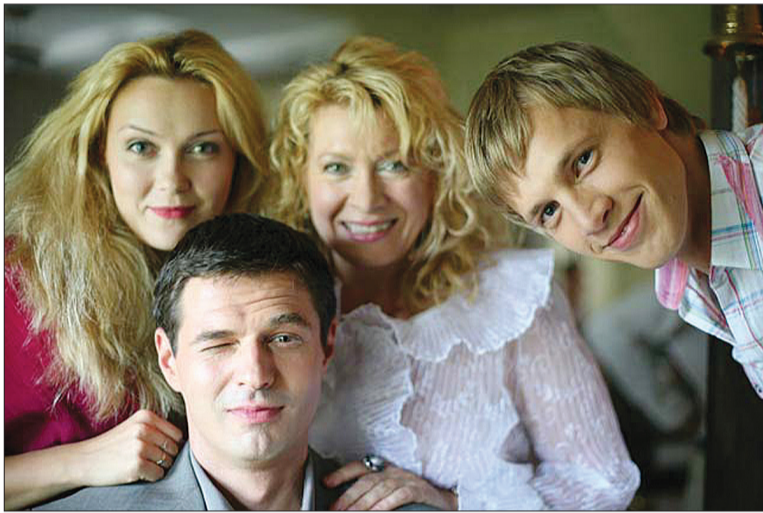
Действующие лица сериала «Саквояж со светлым будущим» по роману Татьяны Устиновой.

Можно быть скромным тружеником. Можно выбрать профессию, связанную с риском. Можно – сидеть за писательским столом или блистать на сцене. В любом случае – это должно быть ваше дело, в котором вы станете настоящим профи. А с какими профессионалами мы встретимся на этой неделе (с 23 по 29 марта) на телеканале ТВЦ?