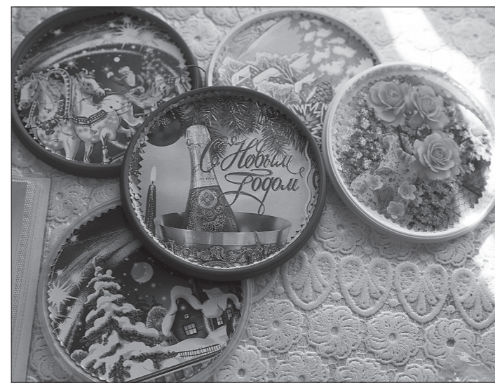
Маленькие сувениры подругам.

возглавляла кружок при центре по работе с ветеранами. В ее квартире до сих пор