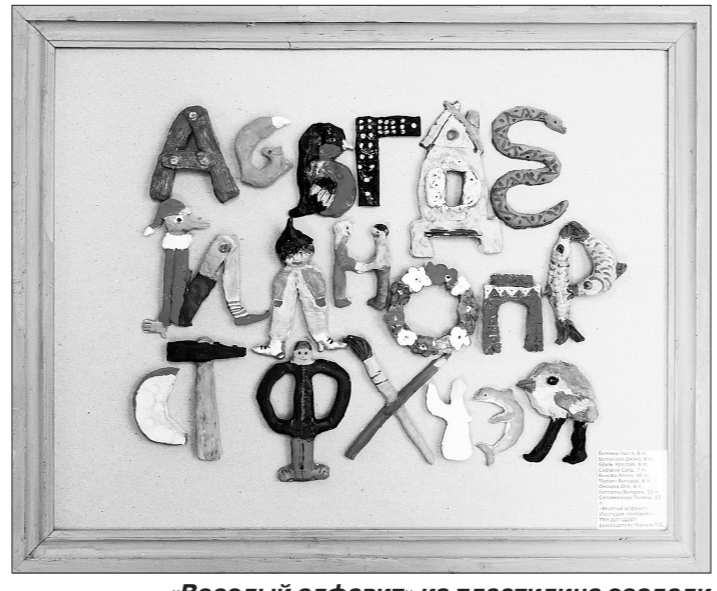
«Веселый алфавит» из пластилина создали ребята из студии «Колорит».