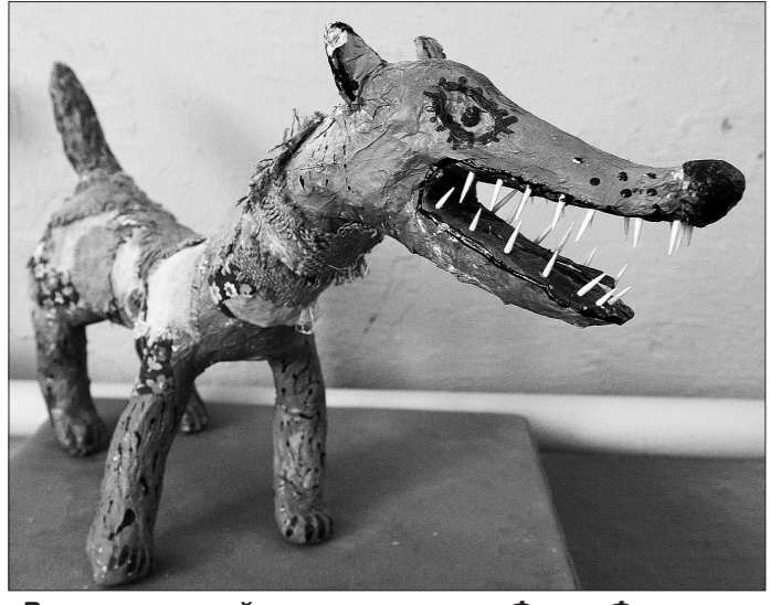
«Волчище-серый хвостиче», автор Федор Феоктистов.

Более 500 учащихся детских художественных школ, студий и кружков дворцов культуры, дошкольных и общеобразовательных учреждений стали участниками этой необычной выставки.