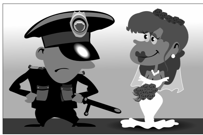
Иллюстрация Петра Угорова.

Жительница Нью-Йорка Лиана Барриентос арестована за 10 браков без разводов, передает Associated Press.