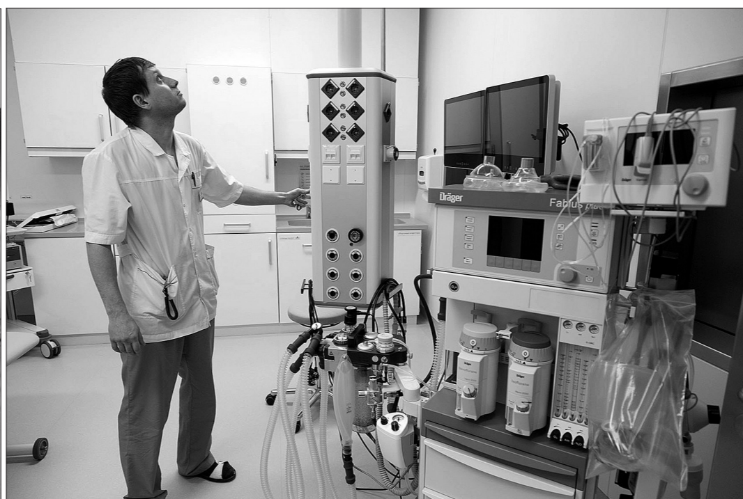
В кабинете колоноскопии.