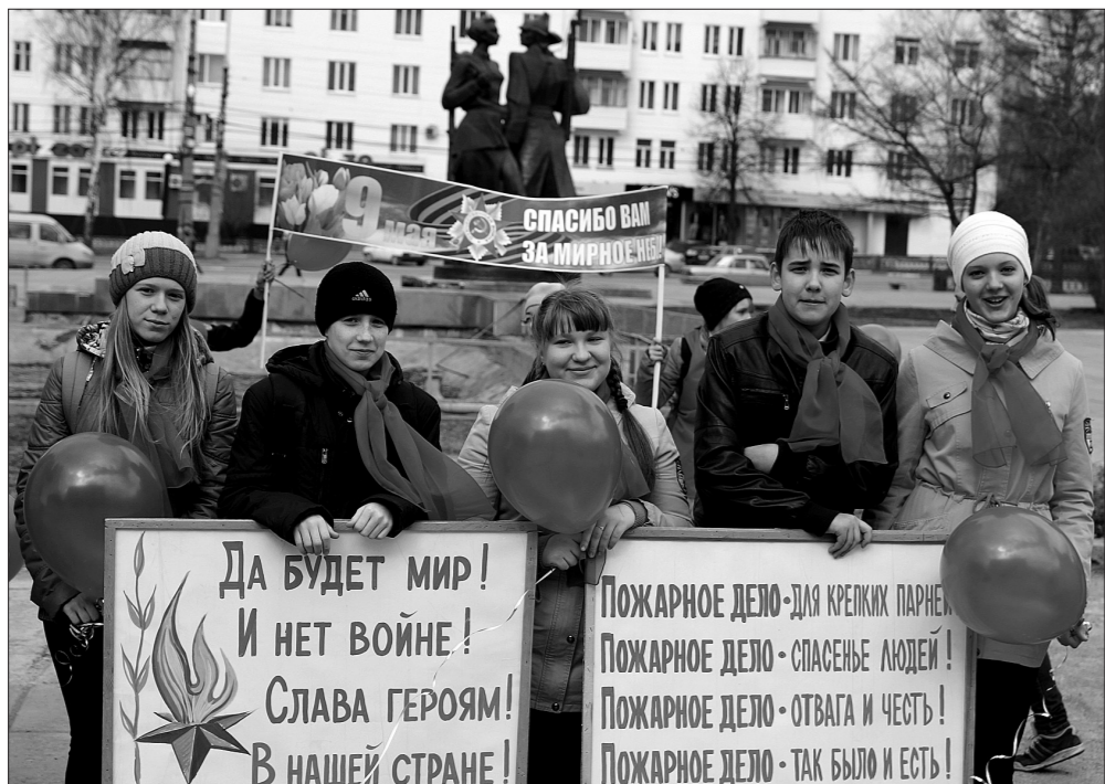
Юные пожарные.

На площади перед кинотеатром «Современник» юные пожарные из 30 школ города провели масштабный флешмоб.