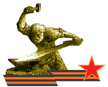
Великой Победе – 70

Анастасия ВАСИЛЬЕВА.