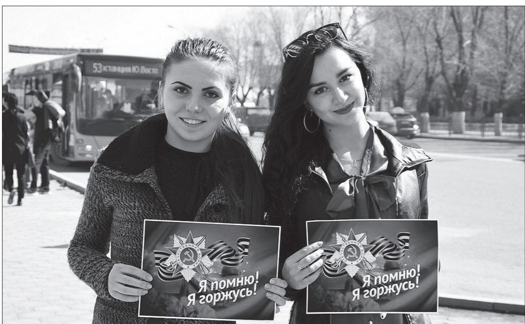
Участники проекта. Республика Казахстан, город Караганда.