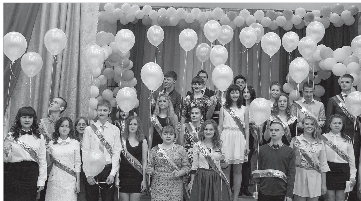
Выпускников чествовала вся школа.

В школах города прозвенел последний звонок. Для выпускников открыты двери во взрослую жизнь. Пусть она, напутствовали педагоги на праздничных линейках, будет светлой и счастливой.