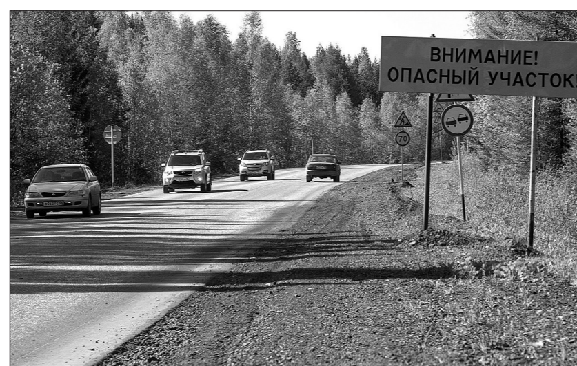
Все прошлое лето тагильчане наблюдали за вялотекущим ремонтом.

Собеседники ИА «Новый город» не раз предполагали, что такая инициативность