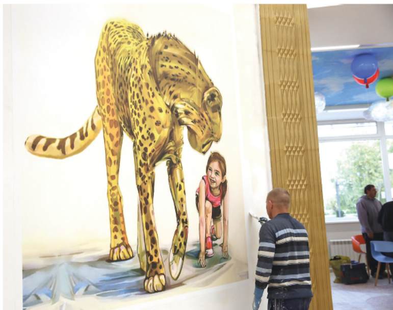
Последние «штрихи» капитального ремонта.