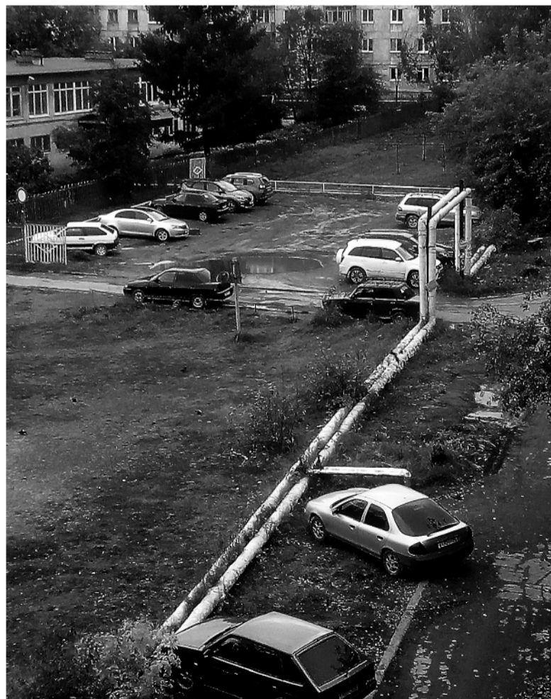
Наружные трассы по периметру двора – привычная картина для многих микрорайонов.