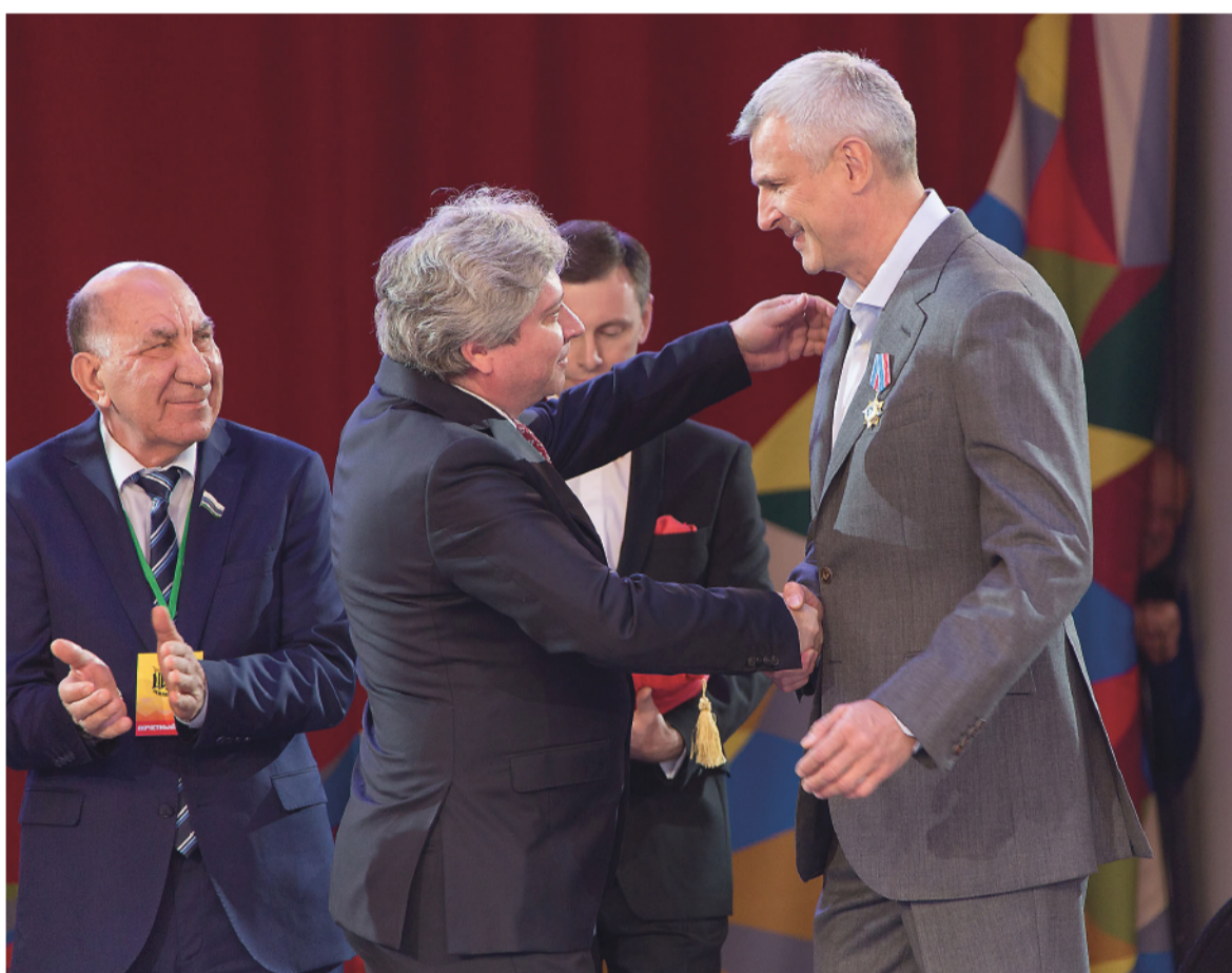
Торжественное вручение почетного ордена.