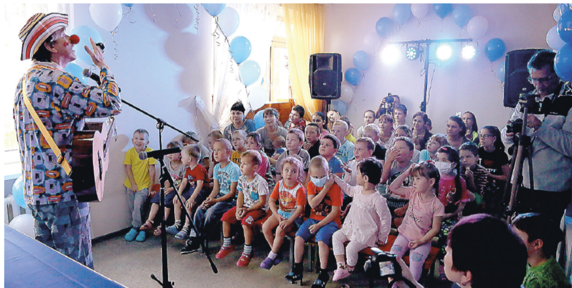
Праздник отвлек малышей от грустных мыслей.

Анжела ГОЛУБЧИКОВА.