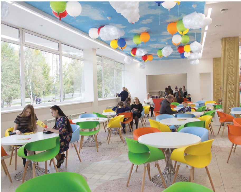
Вот такие в цирке детские кафе.