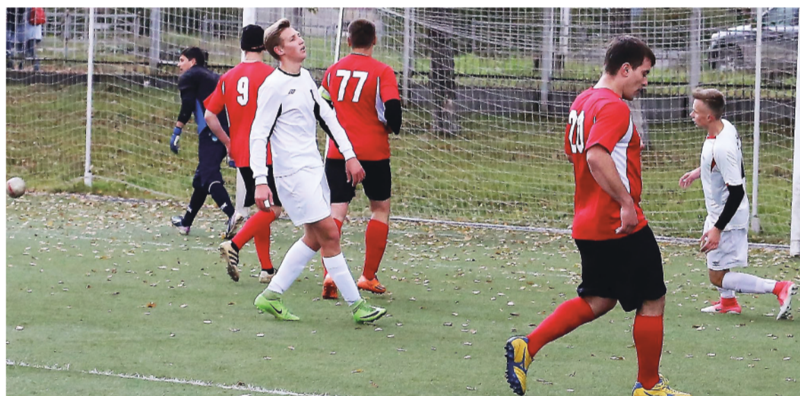
Стадион «Юность». «Спутник» - «Баранча». Очередной удар тагильчан (в белой форме) мимо ворот.