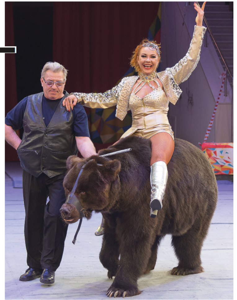
Номер с медведями.