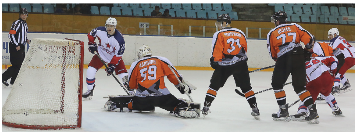
Момент матча «Спутник» – «Звезда». Шайба в воротах тагильчан.