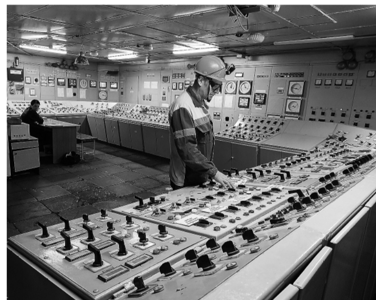
Работу ТЭЦ НТМК обеспечивают около 400 специалистов.

Ольга ДУМЧЕНКОВА.