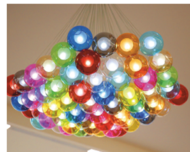
Новые люстры в виде воздушных шаров украшают фойе 2-го этажа.