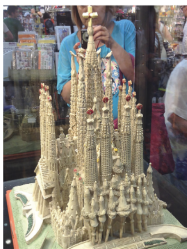
Так будет выглядеть творение великого Гауди в 2024 году.