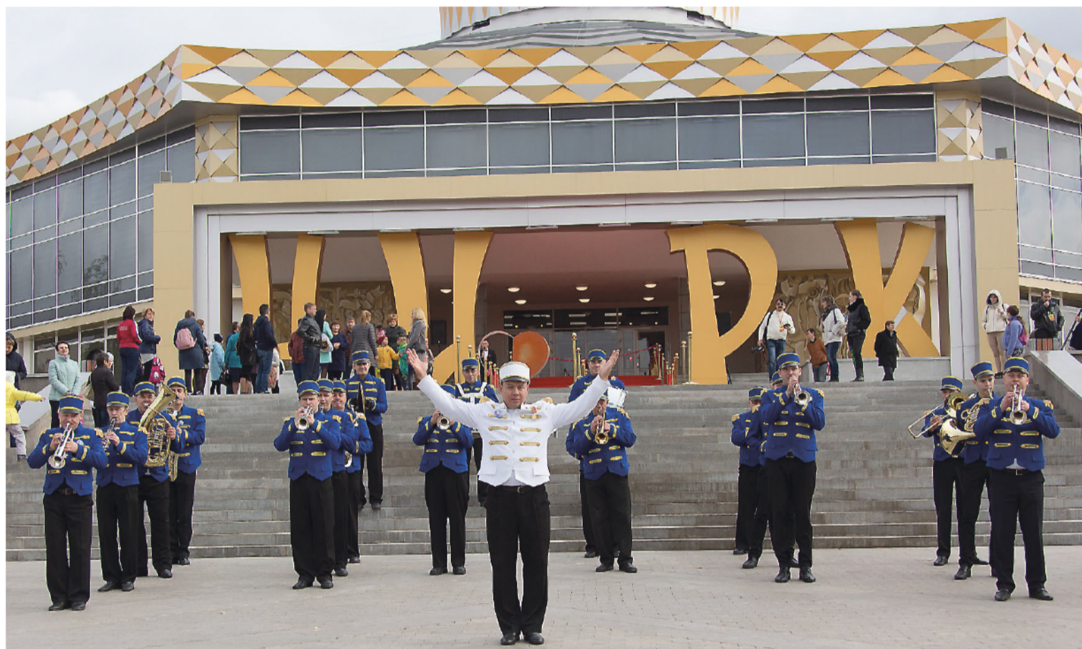
В день открытия цирка зрителей приветствовал праздничный оркестр.

- Показательным должен стать завтрашний день, открытие и премьеры. Последнее слово все-таки за зрителем, - заявил Сергей Носов. - Важно, что подрядчики и заказчики услуг