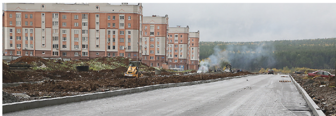
Новый асфальт на Гальянке.

Продолжаются работы на проспекте Ленина и на Восточ-