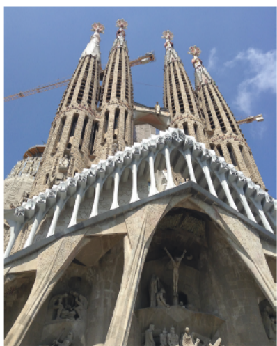
Строительство собора «Саграда-Фамилия» ведется уже 135 лет.