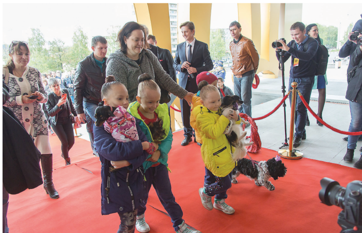
По доброй традиции, в новый цирк первыми вошли животные и дети.