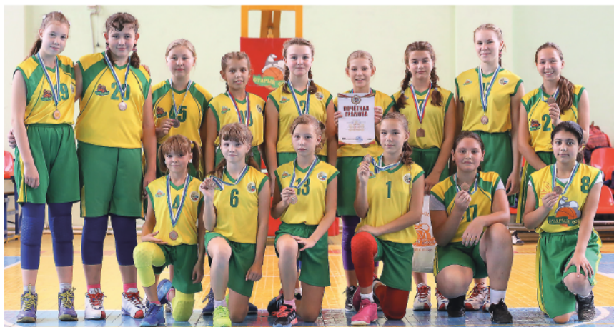
Девочки «Старого соболя»-2005 – бронзовые призёры областного первенства.