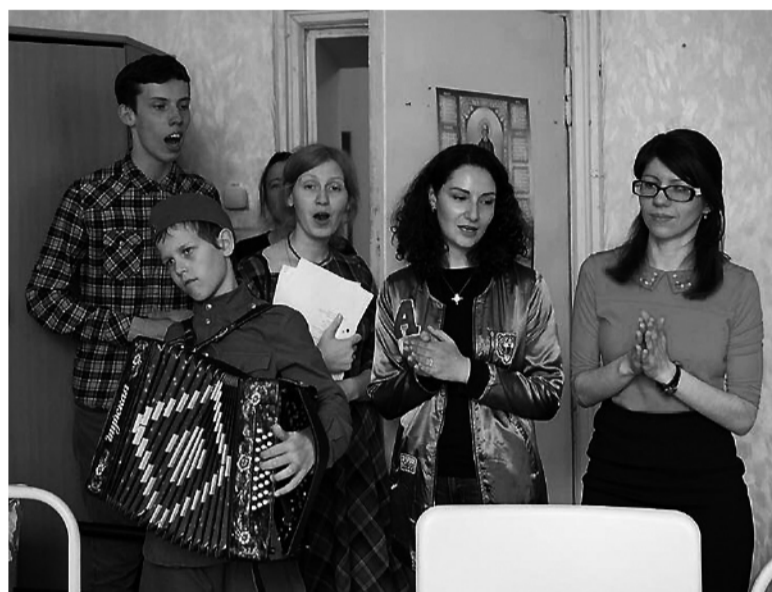
В пансионате «Тагильский».

В соцсети «ВКонтакте» планируется дата мероприятия, об этом извещаются люди, записываются на поездку. Обычно мы приезжаем, устраиваем концерт с песнями, танцами, викторинами и разговорами. В пансионате живут не только пожилые люди, поэтому в последний раз у нас было две площадки. На улице – эстафета для молодых зильцов «Тагильского», в актовом зале – викторина «Назад в 80-е». Бабушки были счастливы вспомнить то время: что сколько стоило, как они жили. После концерта мы обязательно идем по ком-