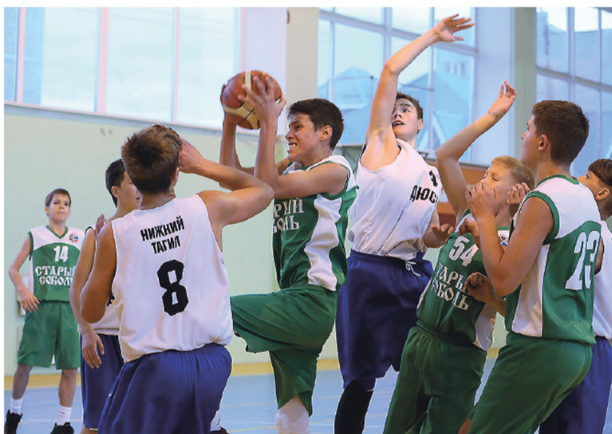
Отбор-2004. Тагильское дерби ДЮСШ «Старый соболя» – ДЮСШ №4.

Ранее в спортзале «Старый соболя» прошло первенство Свердловской области по баскетболу среди команд девушек 2005 г.р.