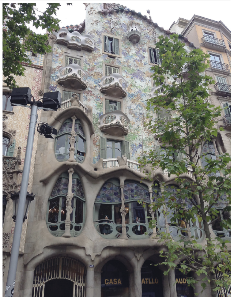
Узнаваемый стиль Гауди – отсутствие прямых линий и углов.

Попасть в собор совсем не просто: нужно отстоять огром-