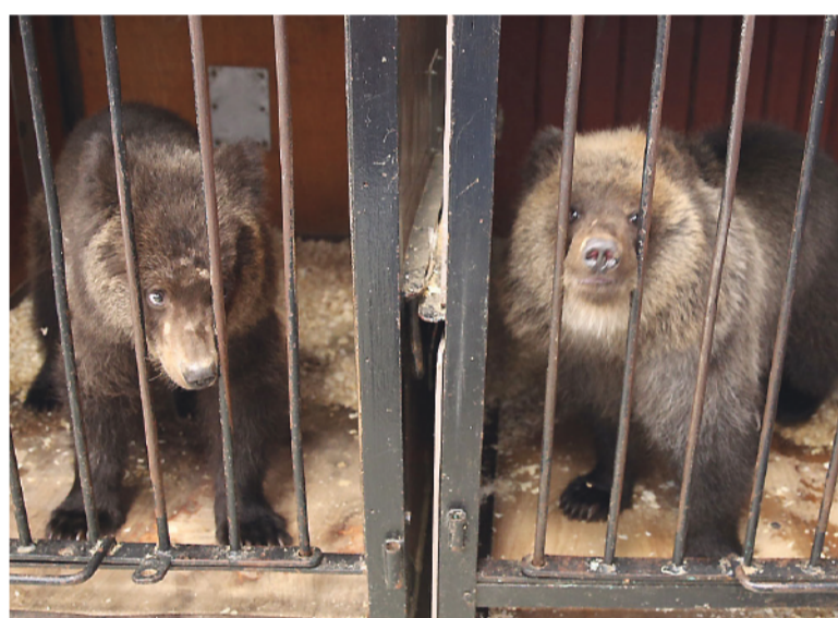
Эти медвежата - малыши, но уже принимают участие в программе.