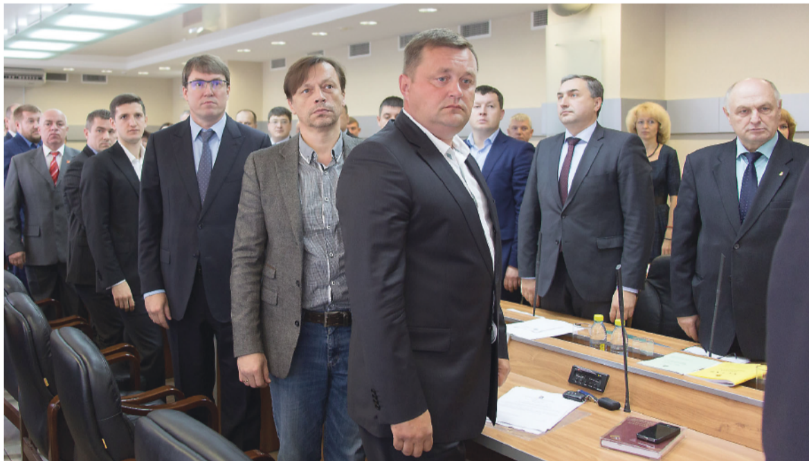
Первое заседание нового созыва горДумы.

Ангела ГОЛУБЧИКОВА.