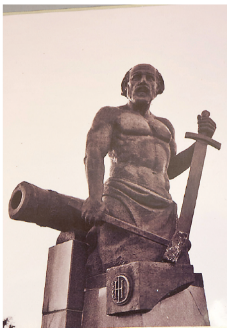
Современный памятник Никите Демидову в Туле.

1 октября в афише фестиваля торжественное открытие и фильмы: «Приходи свободным» (Таллин), «Владислав Ардзинба. Драма победителя», «Алексей Октябрьнич» (Таллин), «Зоя и Валера», «Другая война», «Про рок», «Фабрика грез для товарища Сталина» (Москва), «З/К» (Казань), «Детский мат» (Пермь). 2, 3 и 4 октября будут показаны еще по восемь картин из конкурсной и информационных программ фестиваля. 5 октября запланирован показ четырех серий фильма «Равная величайшим битвам» кинокомпании «СНЕГА» и встреча с авторами. Торжественное закрытие фестиваля состоится в Екатеринбурге.