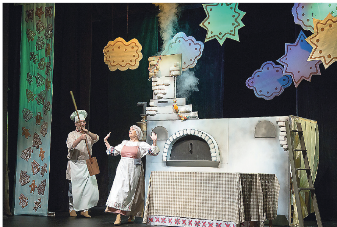
Фрагмент спектакля.

У тагильчан, конечно, будет своя версия сказки. Сценарий специально для нашего театра кукол написала бывшая тагильчанка, а ныне известный рос-