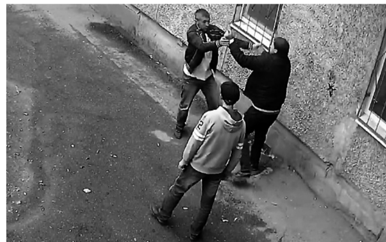
ФОТО С КАМЕРЫ ВИДЕОНАБЛЮДЕНИЯ.

неоднократно был судим за имущественные преступления, отбывал наказание в местах лишения свободы. Освободился в 2012 году, после чего не раз привлекался к уголовной ответ-