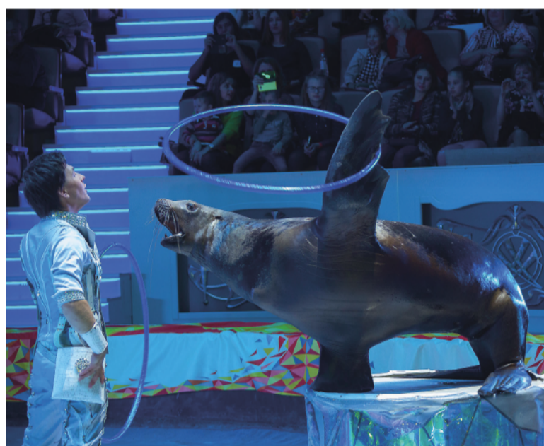
Выступают морские львы.