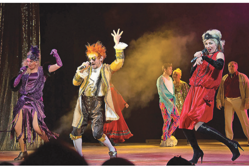
Выступают артисты Нижнетагильского драмтеатра.