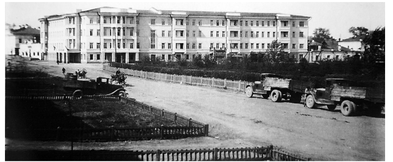
Гостиница на улице Ленина, 6. 1938 год.

Следуя от кинотеатра «Современник» по Театральному скверу, приближаемся к величественному зданию Нижнетагильского драматического театра, которое было принято в эксплуатацию 20 августа 1955 года. Ранее на этом месте находилось пожарное депо. Решением исполнительного комитета Нижнетагильского городского