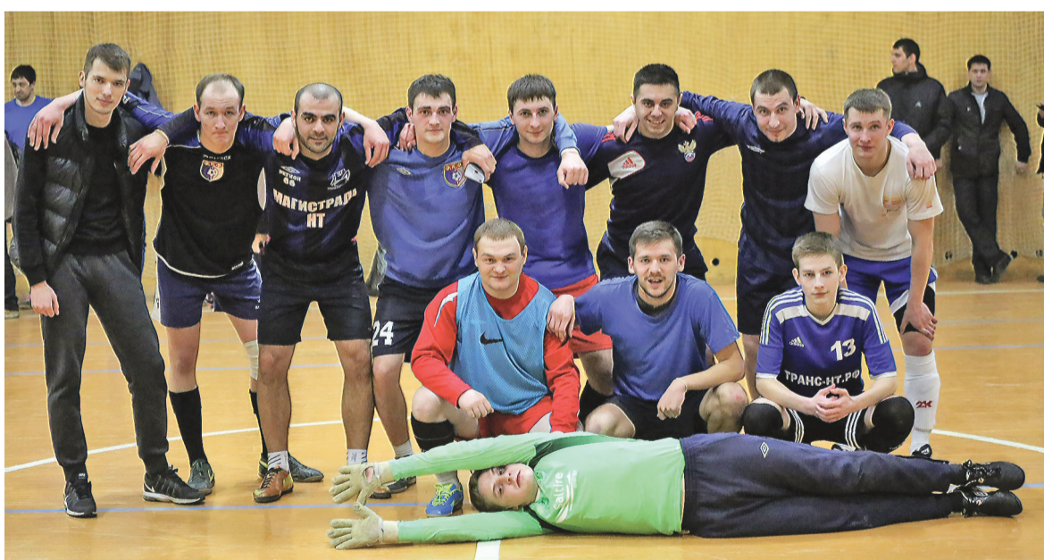
Команда Manchester United по-тагильски.

В Нижнем Тагиле финишировал футбольный сезон в Любительской футбольной лиге (AFL). В минувшую пятницу в спортзале школы №21 «Манчестер Юнайтед» нанес в финале поражение «Арсеналу» - 9:6 и выиграл почетный трофей.