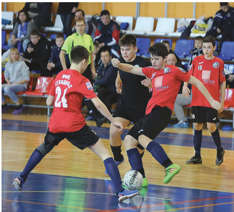
Финальный матч между МФК «Тюмень» и «Суходольем».