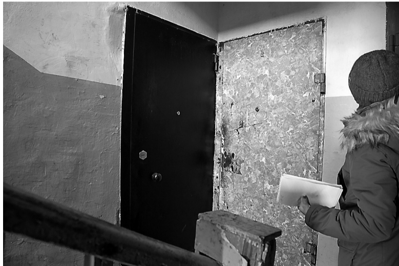
За черной дверью ведет работы аварийная служба.

Двухэтажка 1963 года рождения не считается ветхой. В 2009 году здесь даже был проведен капитальный ремонт на 860 тысяч рублей. На эти средства отремонтировали кровлю, модернизировали системы водо-