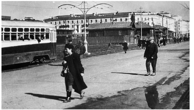
Улица Ленина, 1945 год.

Совета депутатов трудящихся в 1955 году трамвайную остановку «Вторая городская больница» переименовали в «Драмтеатр».