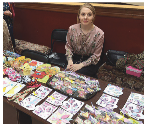
На благотворительном базаре собрано 12 тысяч рублей.