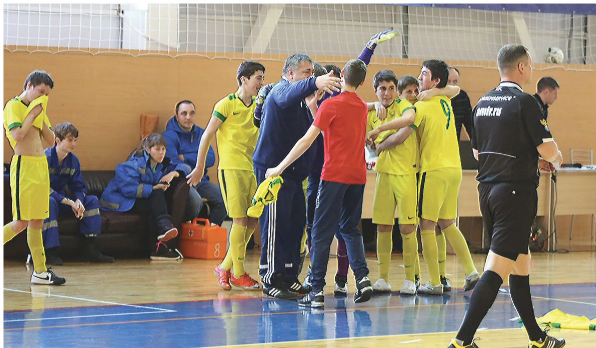
Команда Дагестана радуется «бронзе».