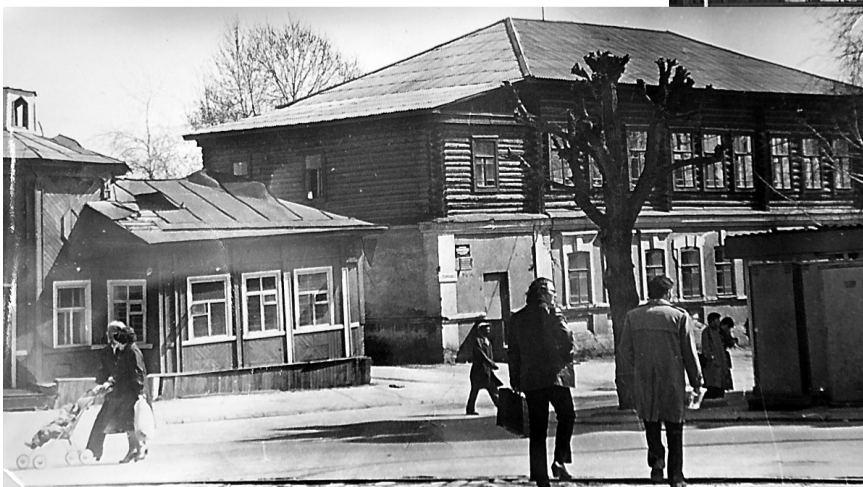
Вид на улицу Огаркова с проспекта Ленина, 1982 год.

Здесь можно увидеть кадры строительства Высокогорского рудоуправления и Дворца культуры «Юбилейный», старые деревянные дома в центре города и новостройки Гальянки. Есть тут план города в 30-х годах прошлого века, макет будущего «соцгорода» НТМЗ, созданный в 1934 году архитектором Моисеем Гинзбургом, эскиз застройки Красного Камня, который так и остался невоплощенным.