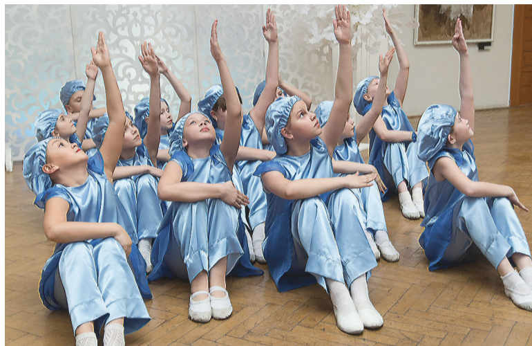
Хореографический ансамбль «Ассоль».

На торжественном открытии третьего этапа фестиваля «Цвет – Свет – Творчество» большой зал музея был полон, тагильчане пришли семьями. Праздничную концертную программу для них подготовил хореографический ансамбль «Ассоль» из досугово-культурного центра «Мир». Девушки театра-моды «Влада» показали новую коллекцию нарядов «Не отпускай», с которой они заняли первое место на конкурсе