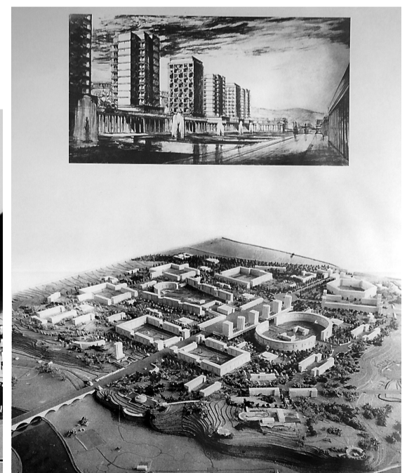
Макет и эскиз «соцгорода» НТМЗ 1934 года.

Пришедшие на выставку представители старшего возраста с интересом изучают снимки времен своей молодости, вспоминают ресторан «Каменный пояс», кинотеатр «Искра», проспекты Строителей и Вагоностроителей, вдоль которых когда-то росли тополя и не было столь бурного потока автомобилей. Некоторые фотографии хорошо узнаваемы, но есть и такие, которые нужно разгадывать, словно ребус, пытаться дога-