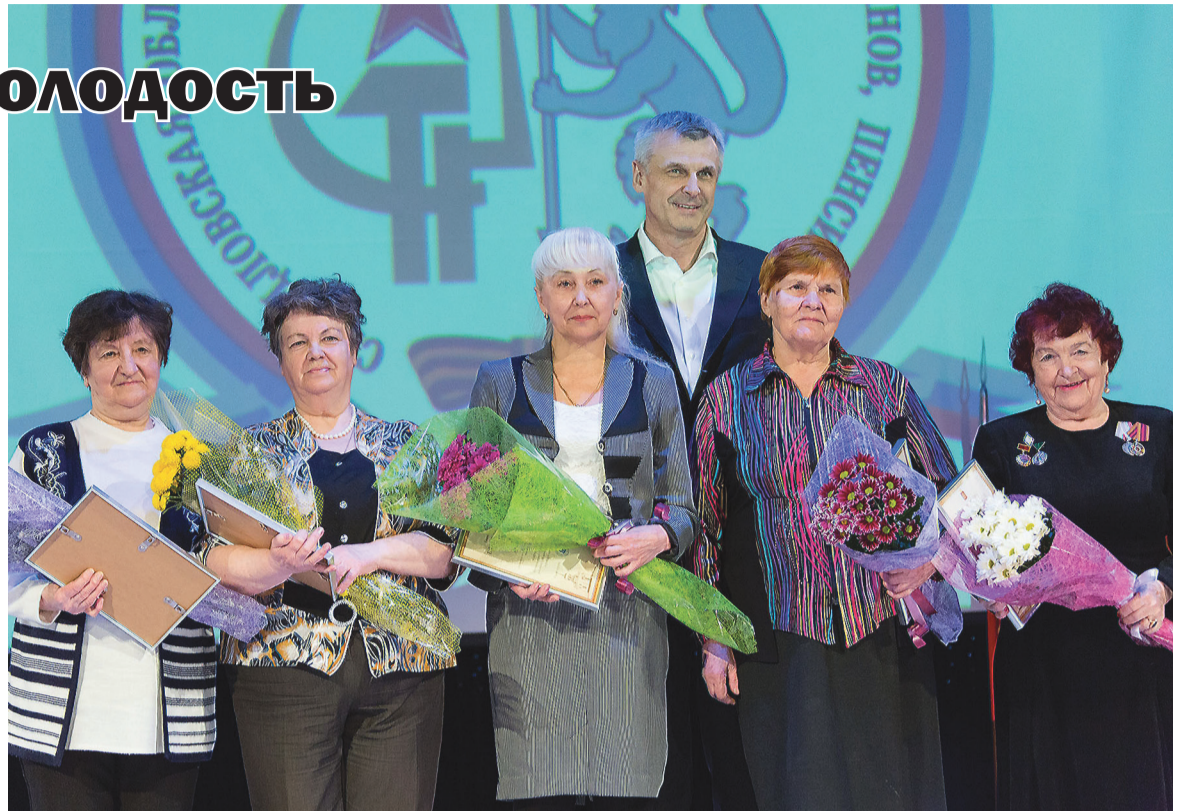
Глава города Сергей Носов вручил ветеранам благодарственные письма.

Ветеранам вручили благодарственные письма и ценный подарок от главы города, почетные