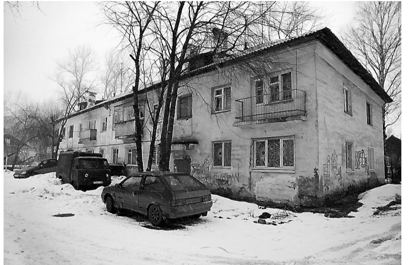
Жильцы сомневаются, что их дом «доживет» до капремонта.