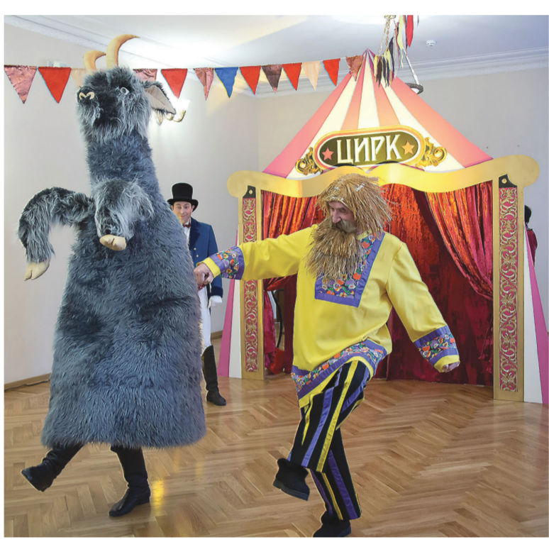
Смешно было уже в фойе.