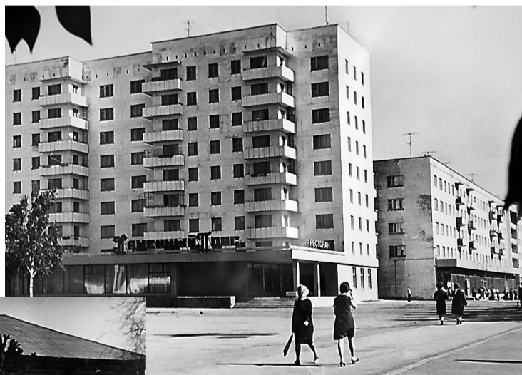
Ресторан «Каменный пояс» на Фрунзе, 70-е годы.