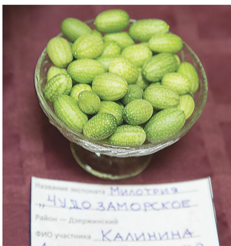
Мелотрия, выращенная тагильскими садоводами прошлым летом.

диковинку давно выращивают в Нижнем Тагиле. Журналисты «ТР» убедились в этом, побывав прошлым летом на садово-огородной выставке в городском центре по работе с ветеранами. Внешне растение выглядит так же, как и огурец. Разве что листья и цветки немного меньше. Листья такие же шершавые, как и у огурца.