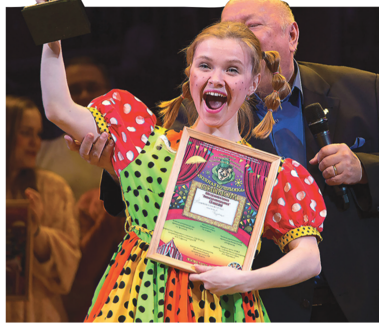
У Нижнетагильского театра кукол диплом за третье место.

Театральная фортуна в этом году оказалась благосклонной к тагильчанам. Наш театр кукол завоевал третье место, второе за тагильской драмой. Победа