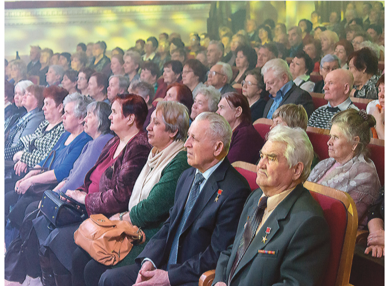
Зал был переполнен.