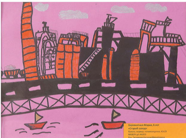
«Старый завод», автор Мария Заровняных, 6 лет. «Пионерки двадцатых годов», автор Н. Чернышев.

Еще больше фотографий – на сайте www.tagilka.ru