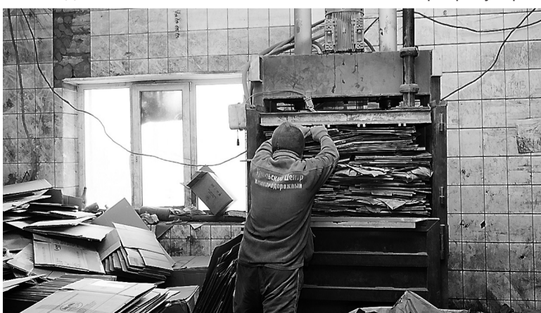
Работает картонный пресс.