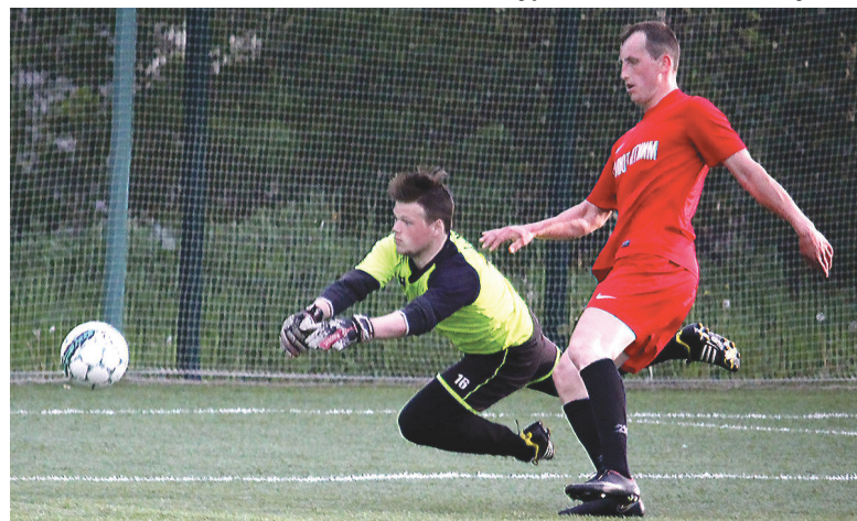
Поле школы №64. Очередная успешная атака «Салюта» в матче со «Спартой».