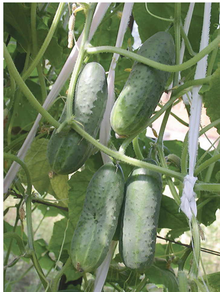
Чтобы огурцы отлично плодоносили, им необходима регулярная подкормка.

Внекорневая подкормка: 35 граммов суперфосфата на 10 литров воды, 1 чайная ложка борной кислоты и 10-12 кристаллов марганцевого калия на литр воды.