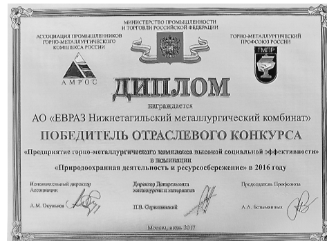
Диплом за экологическую работу.

ствует система запираания воды, которая позволяет проводить ее рециркуляцию. Мы стали первыми, кто начал применять в качестве биологической очистки прудков хлореллу. Она борется с «цветением» водоема. У нас есть лаборатории, которые следят за состоянием воздушного бассейна, за содержанием вредных веществ в воде. Мы контролируем все цехи, это достаточно серьезная и кропотливая работа. Посмотрите, сколько сделано с 2008 года. Закрыв обжимной и мартеновский цехи, мы полностью избавились от «лисыих хвостов» в небе, которые когда-то были визитной карточкой города и встречали путников, подъезжавших к вокзалу. Сейчас этого нет. Есть разовые выхлопы доменного цеха, но они кратковременны, и то количество вредных примесей, которое при этом выпускает комбинат в атмосферу, лишь незначительно превышает ПДК.