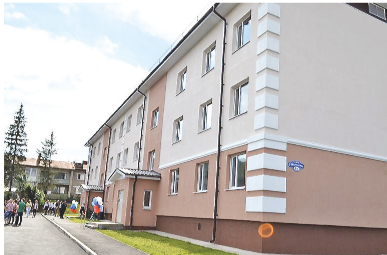
Новый дом в Артях.