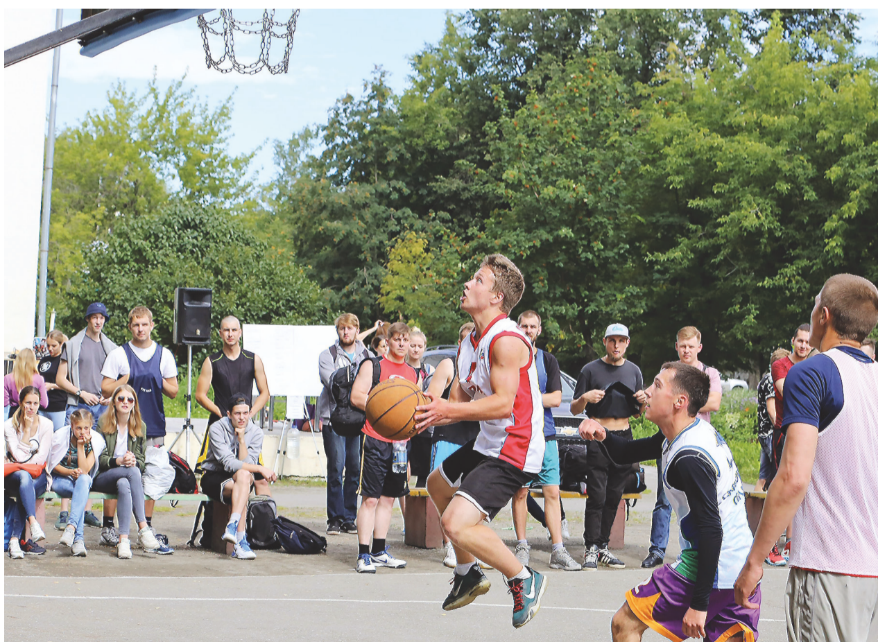
Стритбол в парке на Вые.

Последний срок подачи заявок – сегодня, 10 августа, до 18 час. (ул. Пархоменко, 37, ДЮСШ «Старый соболь»; e-mail: st.sobol@mail.ru, контактный телефон 42-00-20).