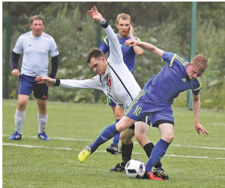
Стадион школы №64. ФК «Гальянский» - «Росметаллопрокат» (в белой форме). Борьба за мяч.