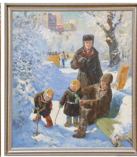
«На пленэре. Моя семья».