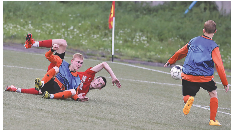
Стадион «Высокогорец». «Высокогорец» - «Салют» (в красной форме). Момент матча.