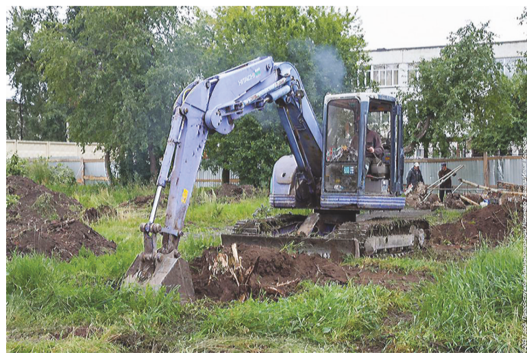
Идет планировка стадиона.