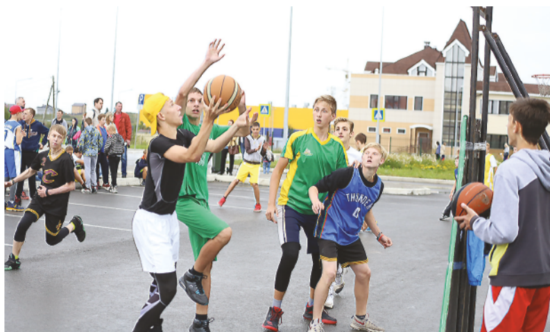
Забьет или нет?..

Конечно же, королем праздника был стритбол, или, как теперь его принято называть, баскетбол 3x3 – отныне олимпий-