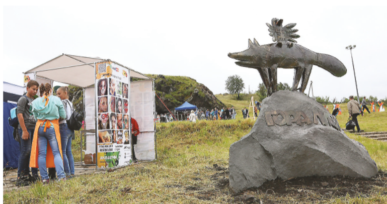
«Горный пикник» на Лисьей горе.