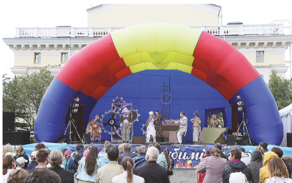
Спектакль в «Театрграде».