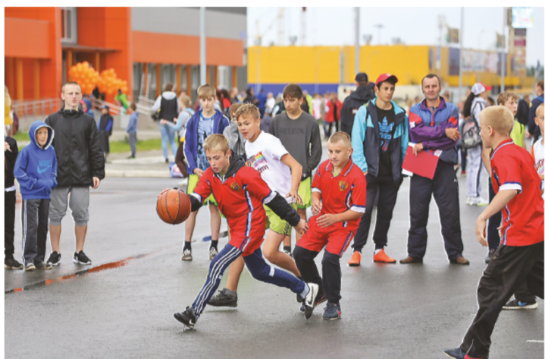
У каждой стритбольной команды – свои болельщики.