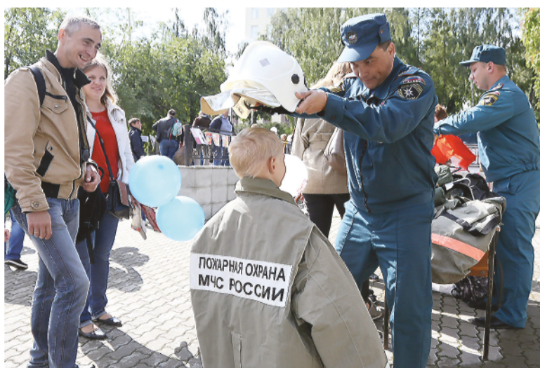
В «Киндерграде» можно было узнать много интересного про разные профессии.