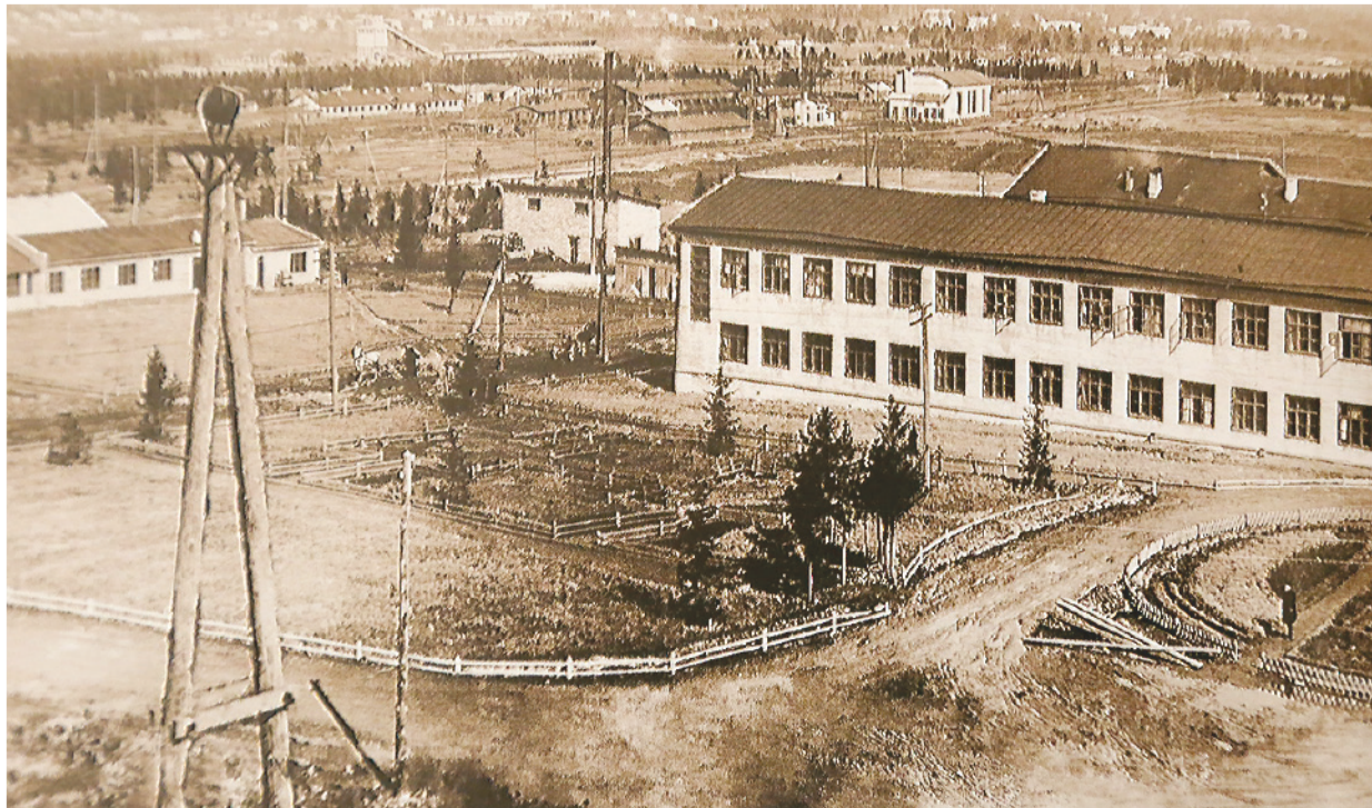
Управление строительством, промышленная площадка и жилой поселок Тагилстроя, 1935 год.

января 1946 года вышло постановление СНК СССР о передаче Тагилстроя из НКВД СССР в систему Наркомата строительства.