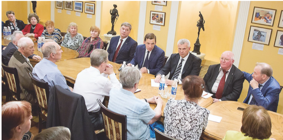
На встрече с ветеранами ЕВРАЗ НТМК.