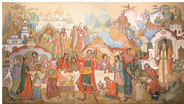
Панно «Каменный пояс. Торговое братство».

нах представлены шкатулки, ларцы, тарелка, кулон, солонка... Все названия сюжетов говорящие: «Жарптица», «Кому на Руси жить хорошо», «Трудовой семестр», «Спящая красавица», «Плач Ярославны». Здесь же можно посмотреть фильм о художниках Палеха.