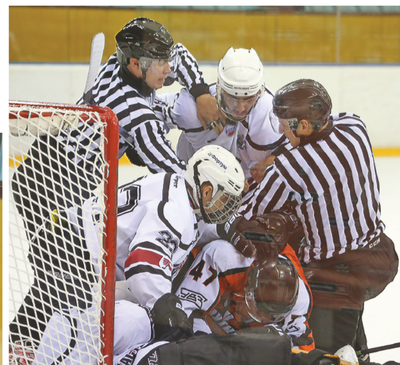
Потасовка у ворот «Рубина».