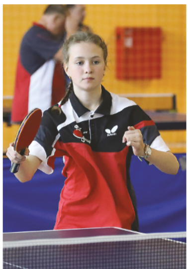
В разгаре – соревнования по настольному теннису.

ский вид спорта. Борьба шла в 18 номинациях.