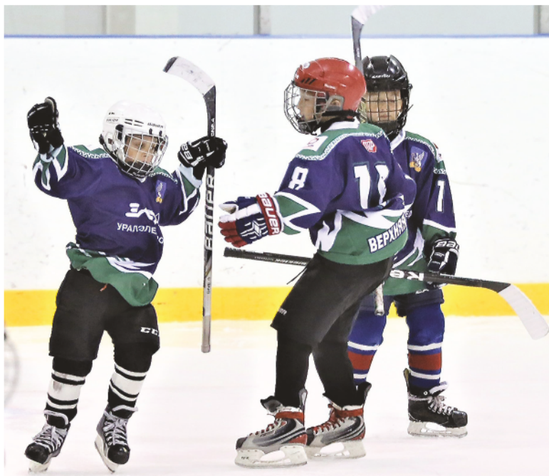
Турнир по хоккею. Команда «Элем» (Верхняя Пышма) радуется очередному голу в ворота серовского «Металлурга».