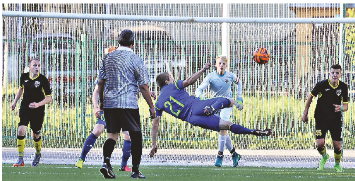
Стадион школы №64. Матч ФК «Гальянский» – «Металлург-НТМК-2». Мяч летит в ворота молодых «металлургов».