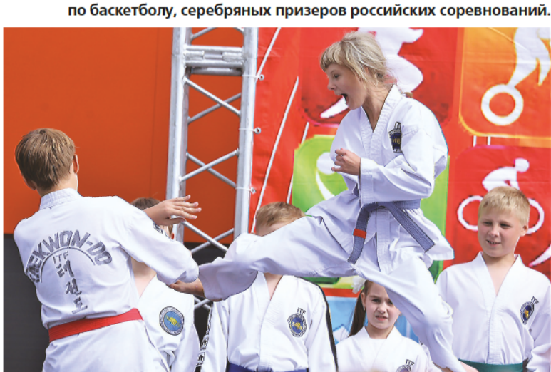
Показательные выступления тхэквондистов.