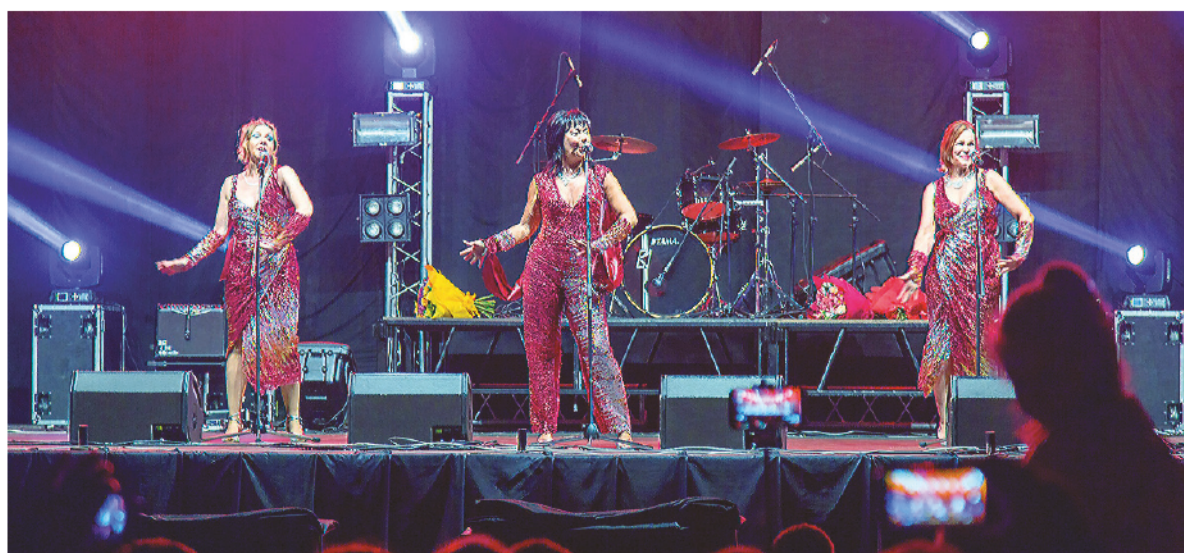
Группа «Арабески» напомнила тагильчанам музыкальные хиты из 1980-х.