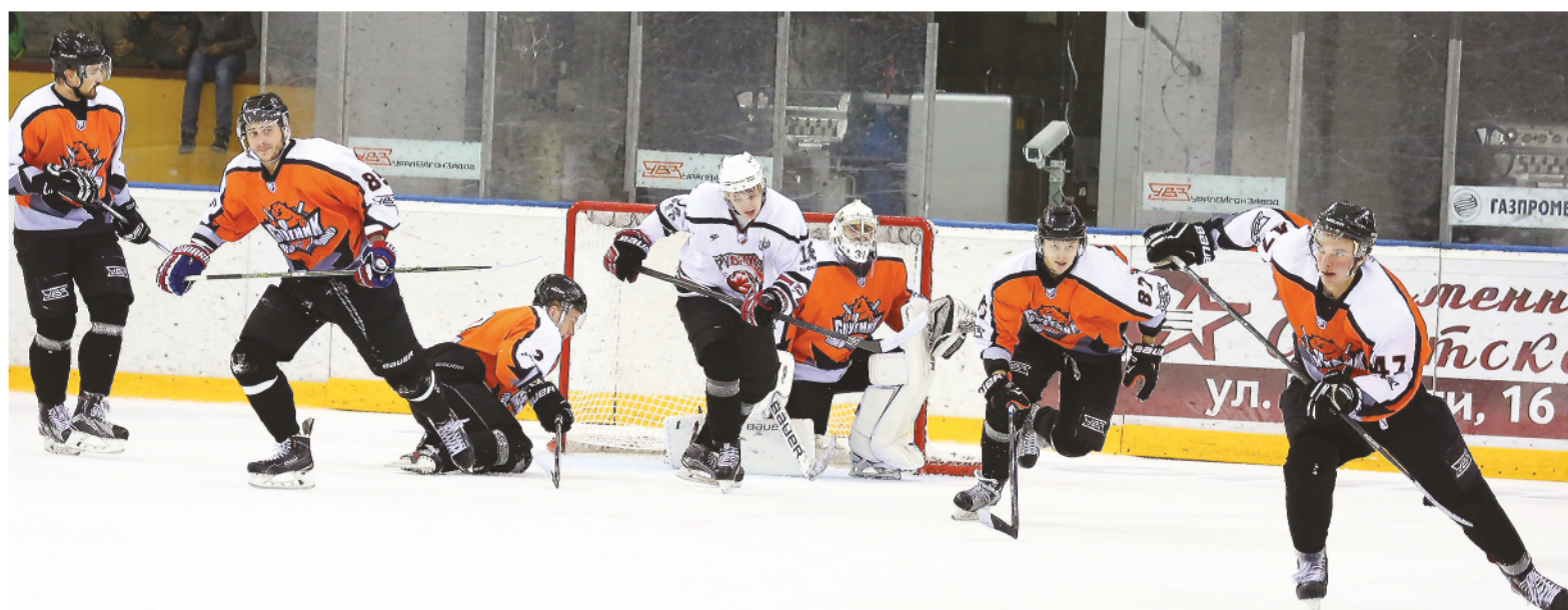
«Спутник» отбил очередную атаку тюменской команды.