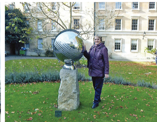
У символа Оксфордского университета.