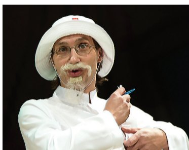
Добрый Доктор Айболит.

По традиции, самые важные и ответственные новогодние ребячьи праздники проходят в городском Дворце детского и юношеского творчества. Среди них праздник для особых детей и Елка главы города для юных победителей олимпиад, конкурсов и фестивалей