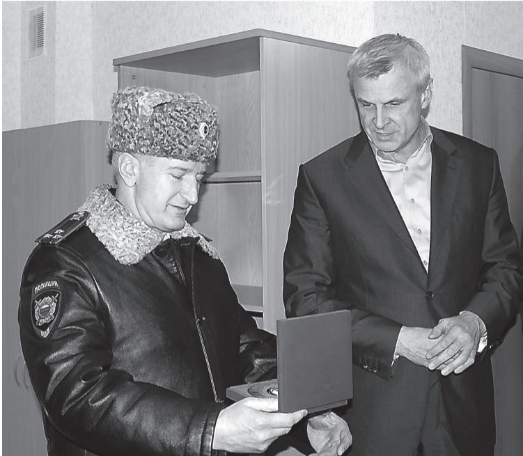
На открытии присутствовали Сергей Носов и Ибрагим Абдулкадыров.

Жители микрорайона Мурунские пруды получили от города прекрасный подарок. По адресу: улица Булата Окуджавы, 7, открылся новый опорный пункт участкового полиции. Торжественное открытие состоялось при участии главы города Сергея Носова, начальника МУ МВД России «Нижнетагильское» полковника Ибрагима Абдулкадырова и представителей общественного совета.