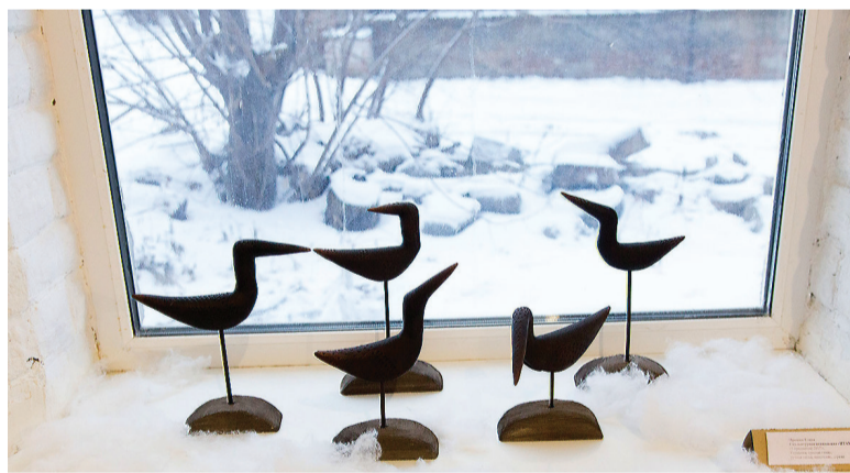
Е. Прошко, «Птахи».