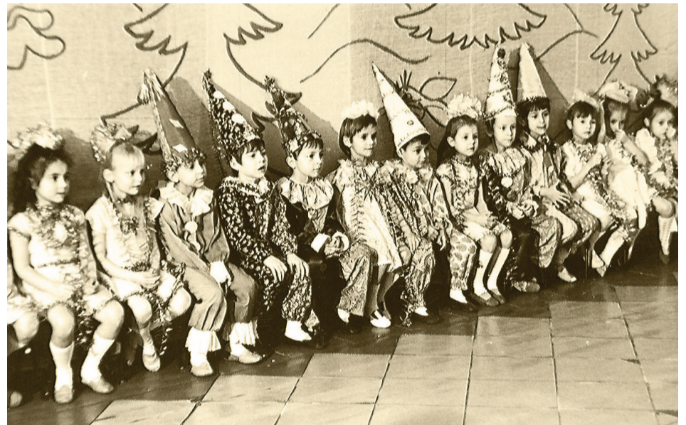
А это утренник в детском саду в 1989 году.