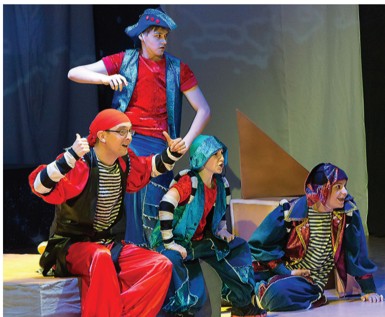
Бармалей и его разбойники.