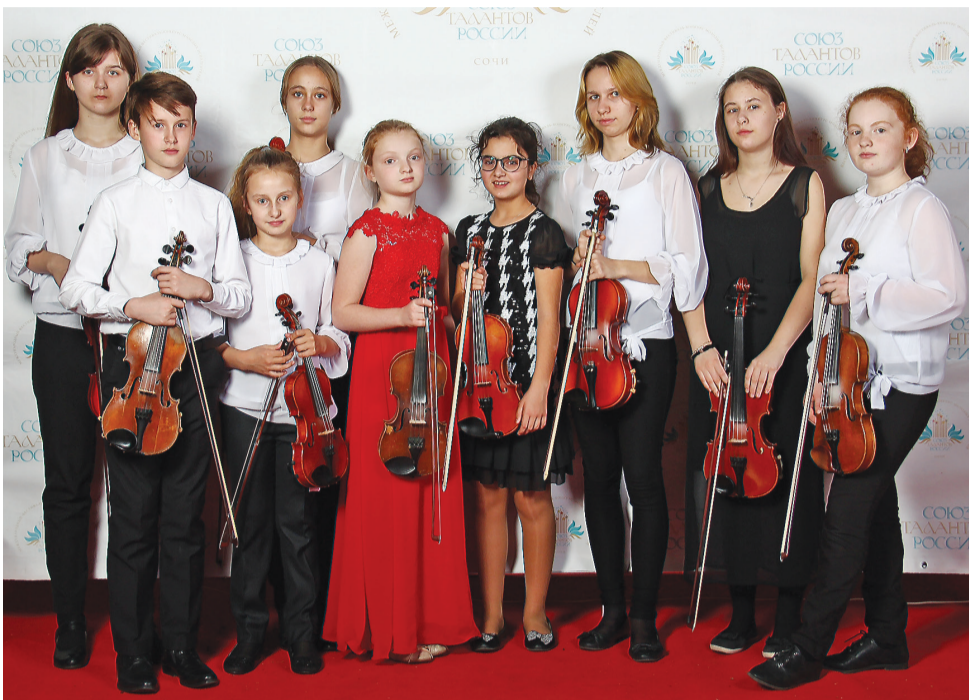
Ансамбль скрипачей.