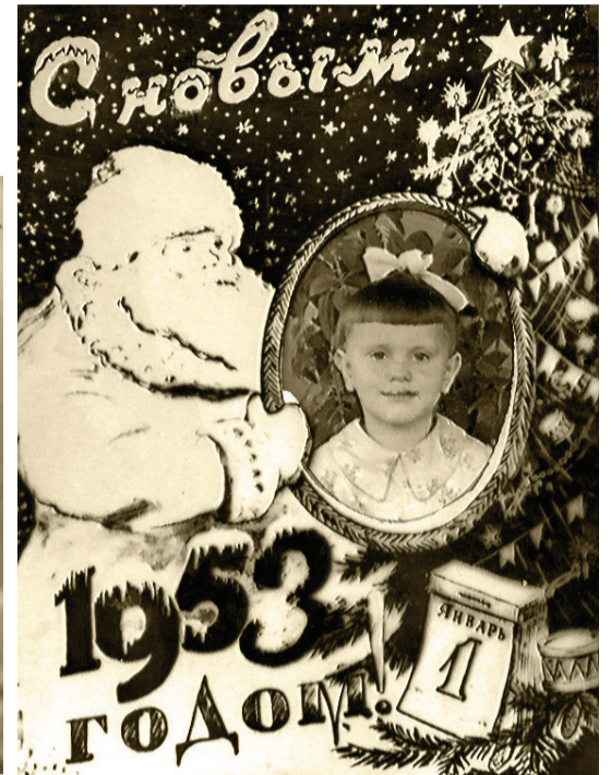
1953 год. Такие фотографии – открытки с Дедом Морозом были почти в каждой семье в середине прошлого века.