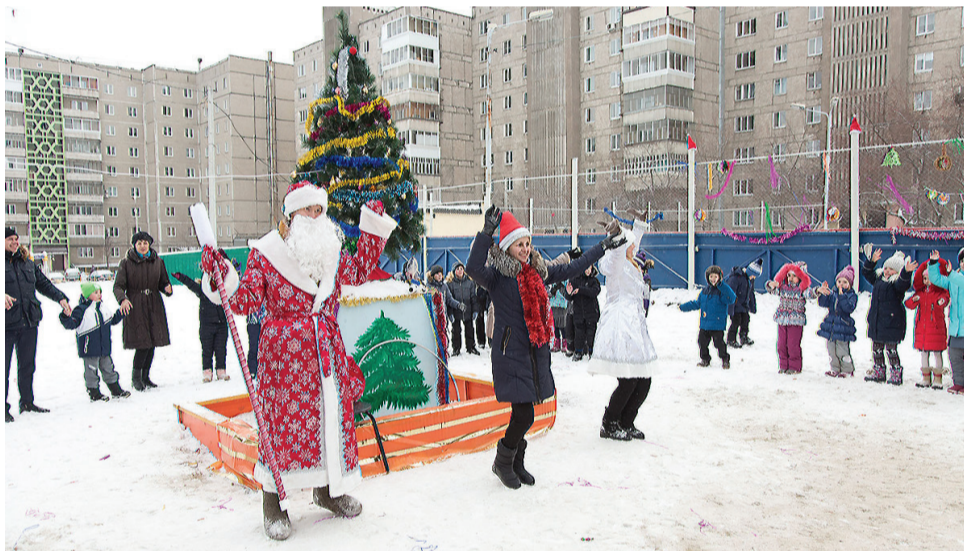
Праздник во дворе на ул. Красноармейской, 84а.