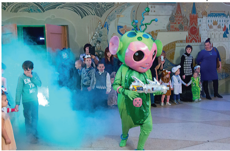
В театр забрел инопланетянин.