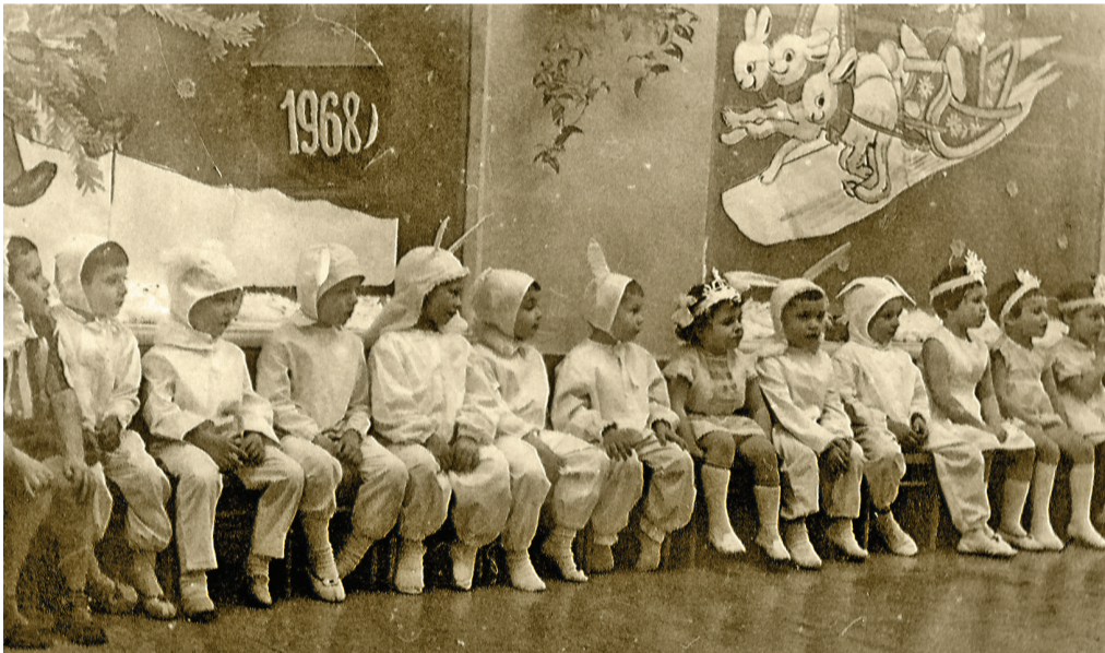
Мальчики – зайчики в 1968 году.