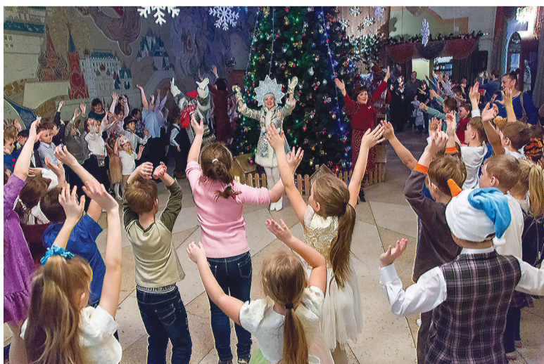
Игры у елки