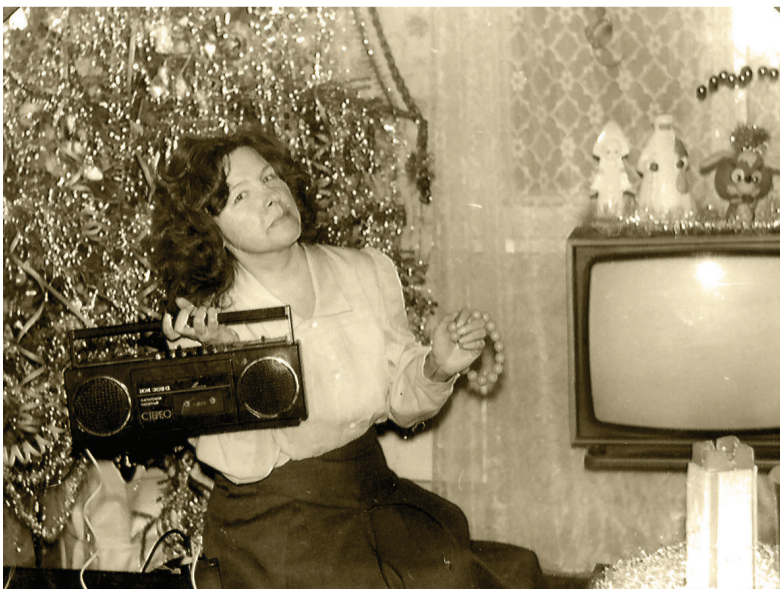
Декабрь 1993 года.