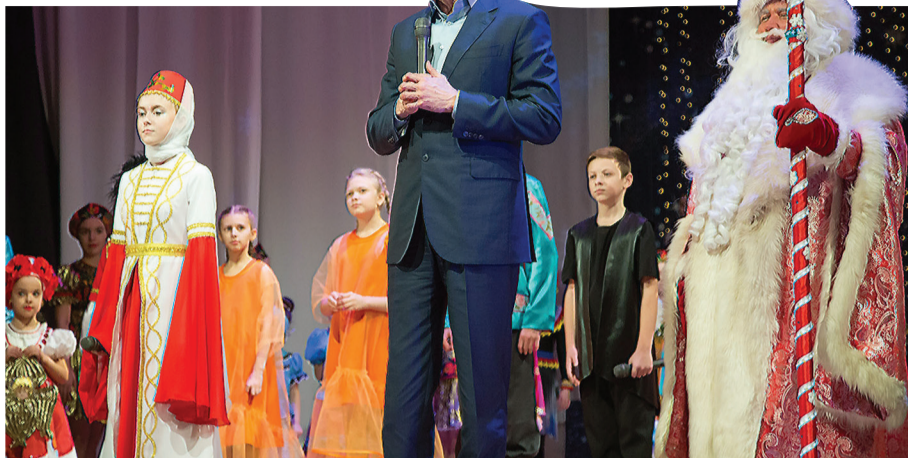
Юных тагильчан поздравили с праздником глава города Сергей Носов и Дед Мороз.