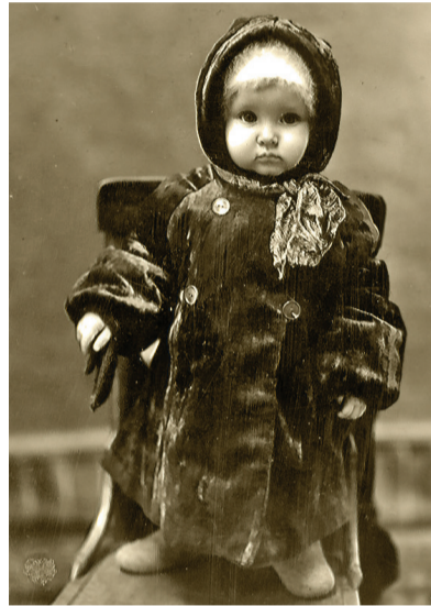
Детская зимняя мода образца 1958 года.