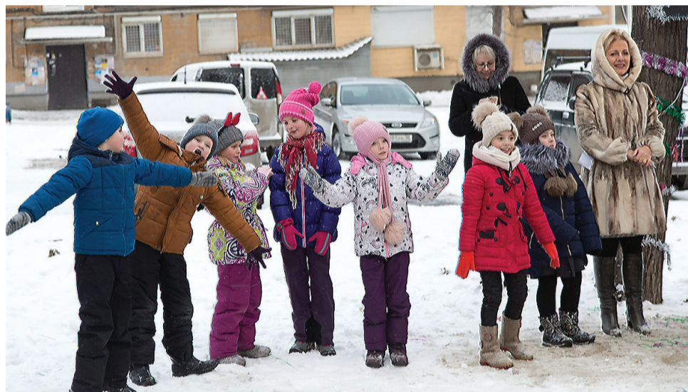
Неподдельная детская радость.