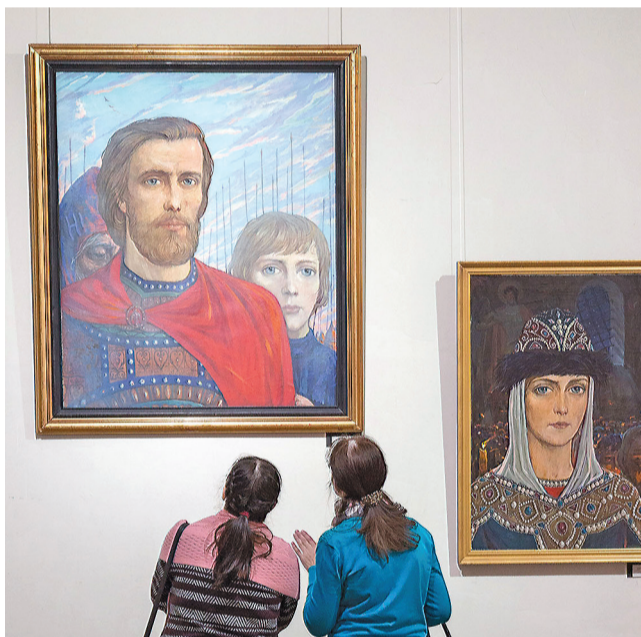
Посетители музея останавливались у картин «Князь Дмитрий» и «Княгиня Евдокия в храме», чтобы не только внимательно рассмотреть произведения, но и обсудить их.

Проект «Поле Куликово» был задуман мастером к 600-летию Куликовской битвы, и художник воплощал свой замысел на протяжении двадцати лет. Названия картин говорят сами за себя: «В монгольских степях», «Штурм града», «Засада», «Ночь после битвы», «Видение Бориса и Глеба», «Князь Дмитрий», «Княгиня Евдокия в храме», «Канун. Перед Куликовской битвой», «Бегство татар»... Для их создания автор изучал истори-