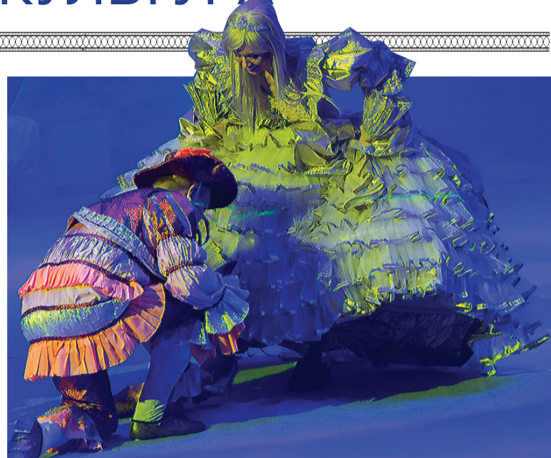
Золушка примеряет туфельку.

Однозначно самыми роскошными и красивыми костюмами стали платья феи и Золушки. Кстати, Золушка - не только скромна и красива, но и бесстрашна: без страховки летала