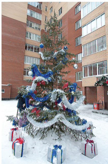
Елка с подарками во дворе на Уральском проспекте.