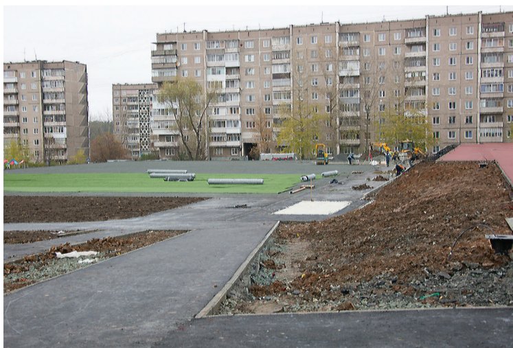
Здесь будет несколько полей для массовых активных игр и занятий спортом. Идут работы на втором уровне будущего спорткомплекса у школы №8.

Уроки физкультуры на улице в тагильских школах проходят по-разному. В одних образовательных учреждениях оборудованы современные многофункциональные комплексы, ученики других, не имея даже беговых дорожек, используют для кросса ближайшие тротуары и парки. У кого-то есть поле со специальным покрытием для массовых активных игр, а кому-то