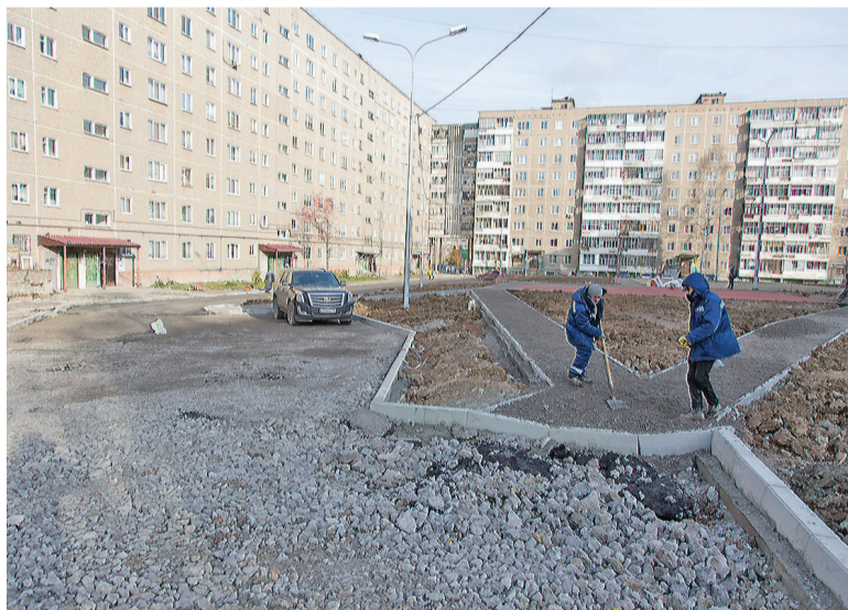
Во дворе на улице Зари.

Начали участники совещания с осмотра участка дороги по Ильича, между улицами Чайковского и Сибирской. Здесь проверяли ливневую канализацию возле тротуара. Многие годы на этом месте после дождей появлялась огромная лужа - не пройти и не проехать. Сейчас ситуация должна измениться: смонтирована водоотводная труба, установлены дополнительные колодцы, заменены бордюры, восстановлено асфальтовое покрытие.