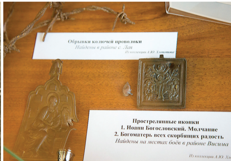
Иконки, пробитые пулями.