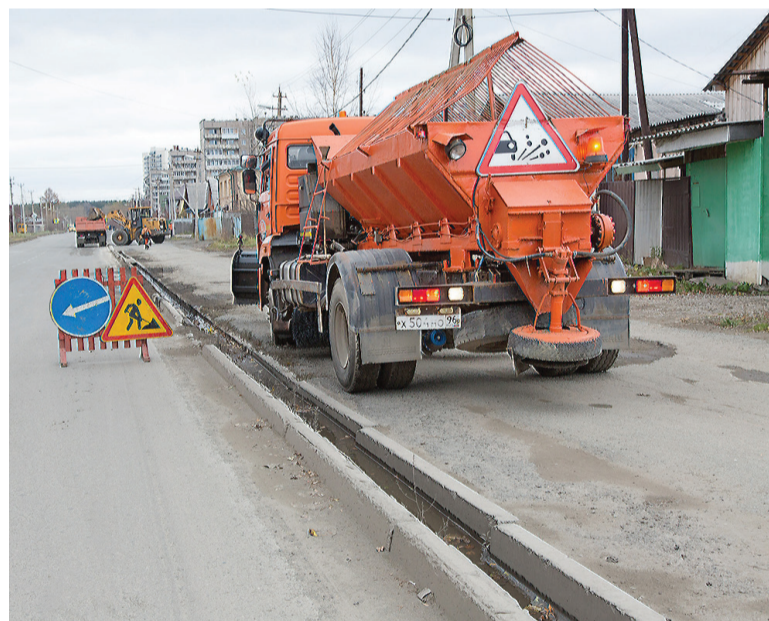
Участок на улице Ильича, где многие годы была огромная лужа.

предполагается сдать в эксплуатацию в течение двух недель: срок зависит от установки малых архитектурных форм, которые, к сожалению, вовремя не доставил поставщик.