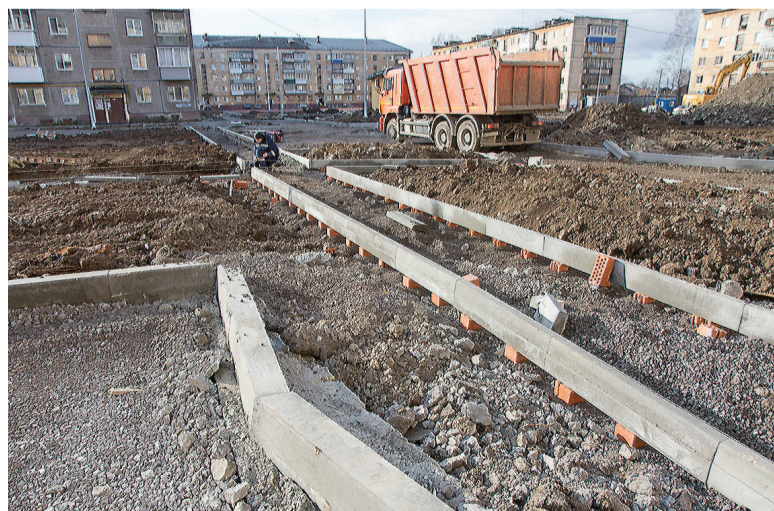
Дворовая территория на Ленинградском проспекте.

Людмила ПОГОДИНА.