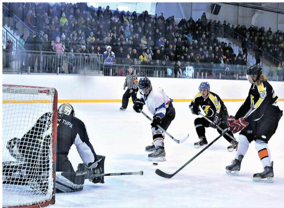
Прошлогодний финал проходил при полных трибунах.

3 ноября на ледовой арене ФОК «Президентский» будет дан старт новому сезону в Нижнетагильской любительской хоккейной лиге (НТЛХЛ).