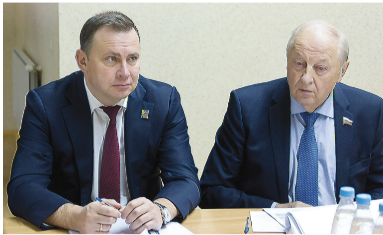
Глава города Владислав Пинаев и председатель наблюдательного совета кластера сенатор Эдуард Россель.

Первый вице-губернатор Свердловской области Алексей Орлов отметил, что необходимо ускорить межведомственное сотрудничество в рамках реализа-