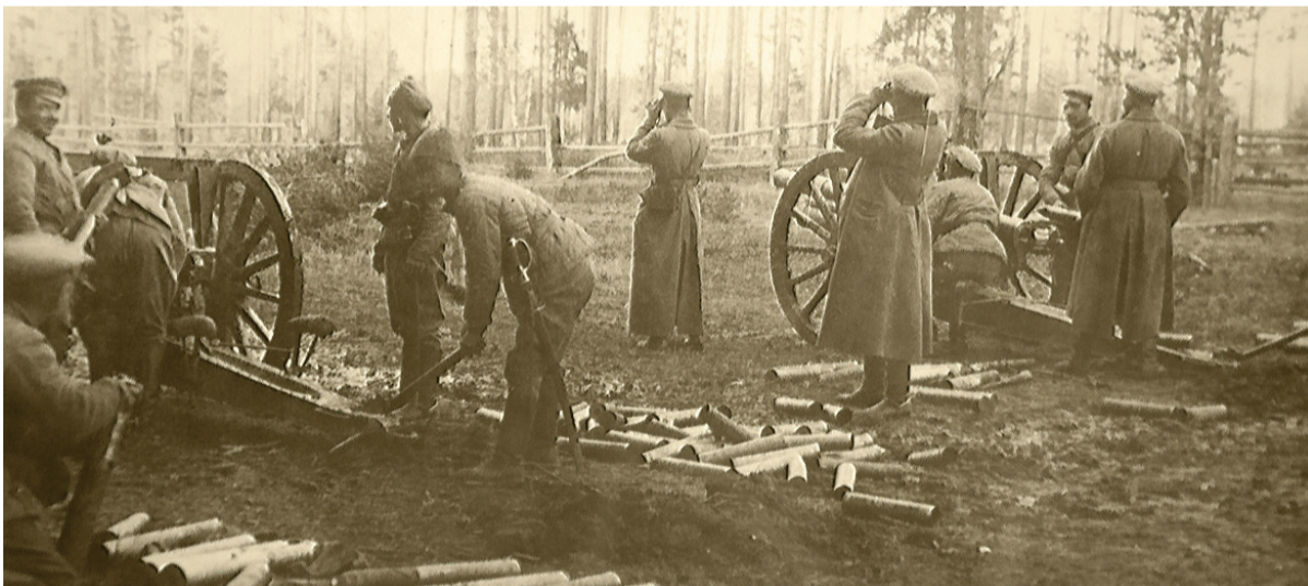
Бои за Нижний Тагил, фоторепродукция.

Людмила ПОГОДИНА. ФОТО СЕРГЕЯ КАЗАНЦЕВА.