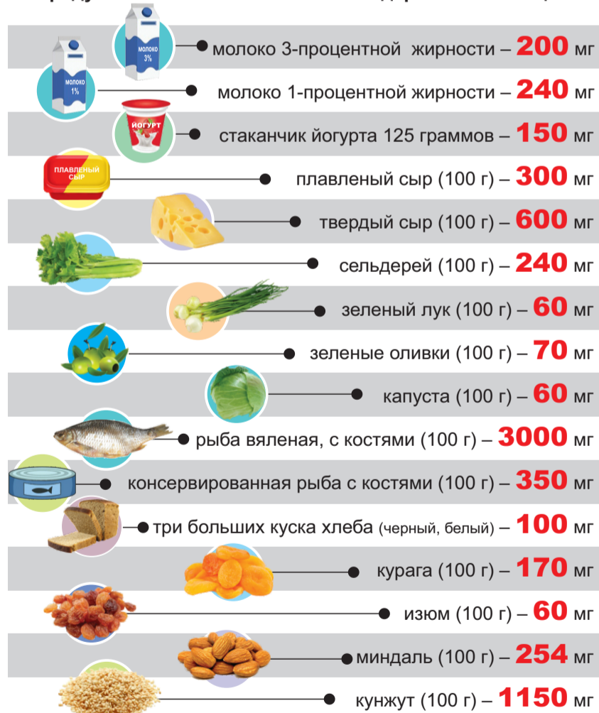
ИНФОГРАФИКА ПЕТРА УПОРОВА.

Это позволяет укрепить различные группы мышц и замедлить потерю костной массы. Пожилым людям больше подойдут прогулки на свежем воздухе и скандинавская ходьба. А для предупреждения падений и переломов необходимо также выполнять упражнения для тренировки равновесия.