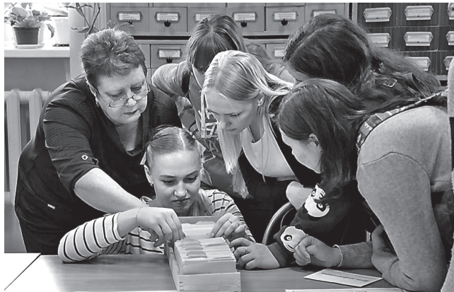
Поиск книг по каталогу.

Все собранные во время экскурсии буквы логично сложились в фамилию известного русского классика. Задание не случайно, ведь в этом году отмечается 190-летний юбилей Льва Толстого. Кроме