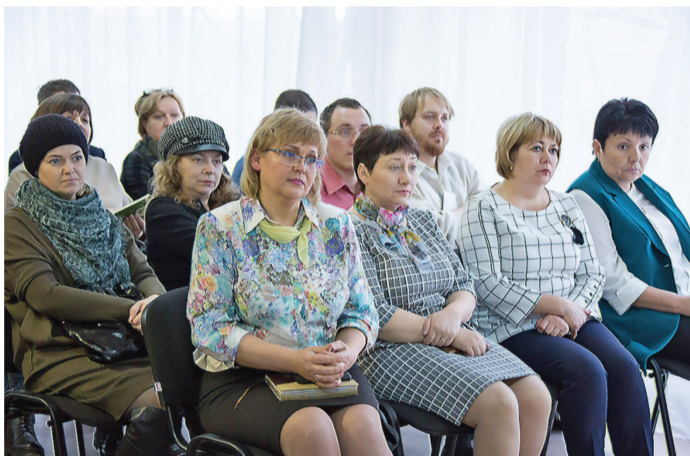
На встречу пришли педагоги и родители учеников.