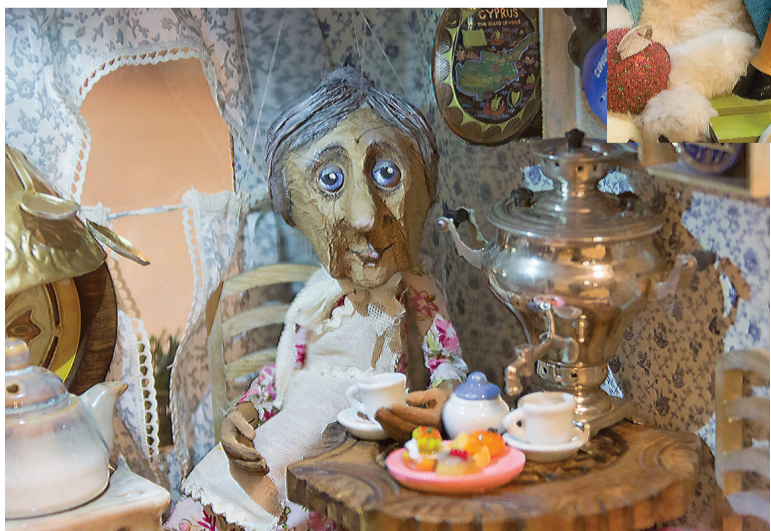
Бабушка у самовара.