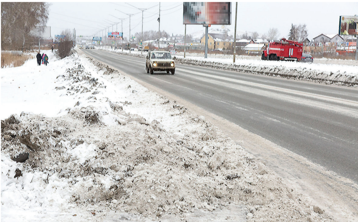
Черносточинское шоссе. По ощущениям, на Гальянке снега больше, чем в других районах, отвалы на обочинах выше.

Татьяна ШАРЫГИНА.