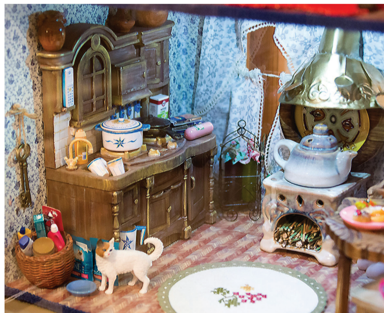
Фрагмент кукольной кухни.