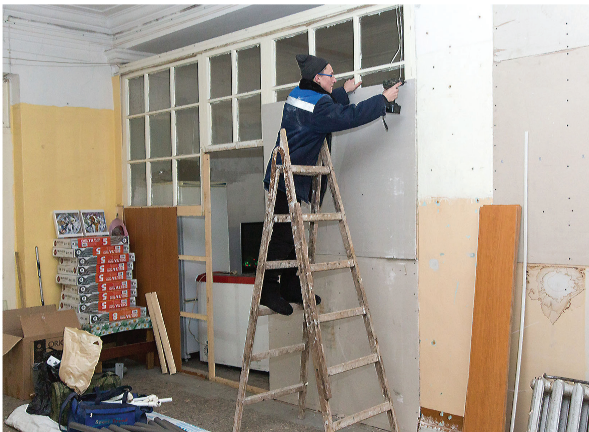
Постояльцы ремонтируют помещения сами.