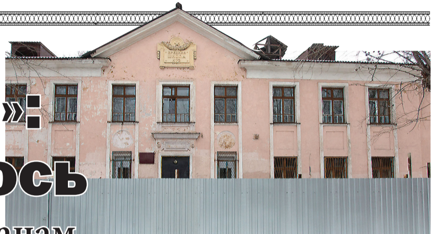
Здесь находится «Звездный остров».