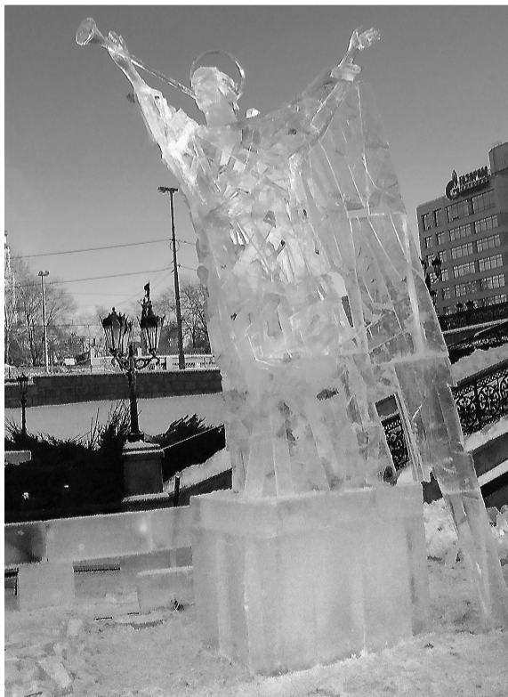
Скульптура «Посланник небес».

Тагильские скульпторы получили призы на фестивале «Вифлеемская звезда»