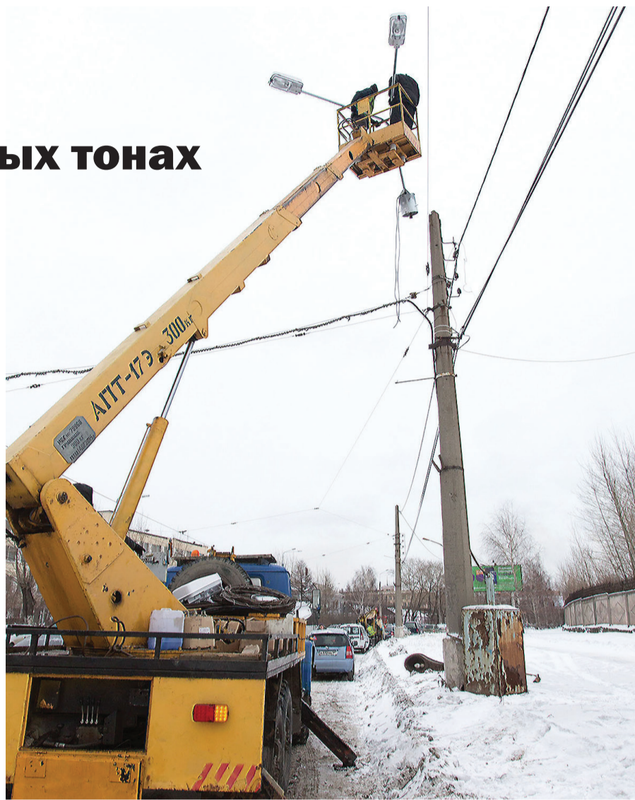
Новые светильники монтируют на старые опоры.

Татьяна ШАРЫГИНА.