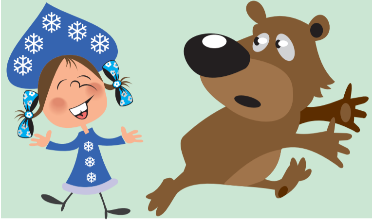
ИЛЛУСТРАЦИЯ ПЕТРА УПОРОВА.

выданное воспитателем: Ну, какие ж бабушки старушки — Это наши старшие подружки. Сколько будет дважды два? Что такое острова?