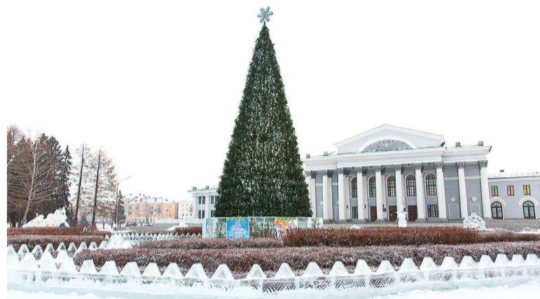
Дворцовая площадь с елкой и горками.

У главной елки на площади Дворца культуры имени И. В. Окунева на время новогодних