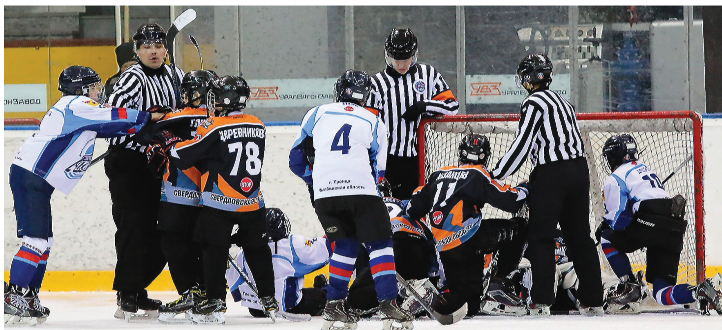
«Спутник 06» - «Юниор» (Троицк). Все как у взрослых.