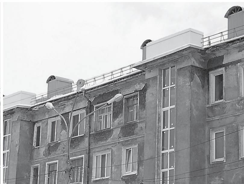
У старых выйских домов на Липовом тракте, 5 и Фрунзе, 54 - новые кровли. Фасады начнут ремонтировать весной-летом.