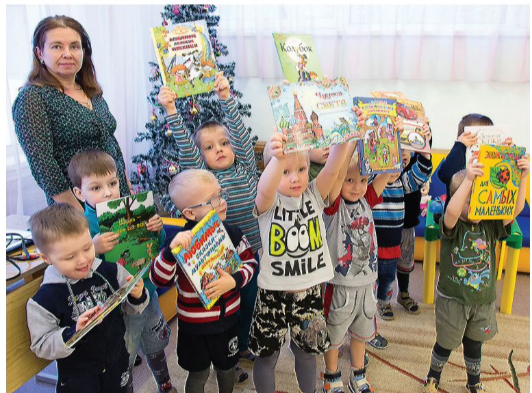
В группе «Бэмби» любят книги.

Журналисты побывали в двух группах – «Бэмби» для самых маленьких и «Улыбка», где занимаются старшие школьники. Дети сразу же продемонстрировали свой интерес к книгам,