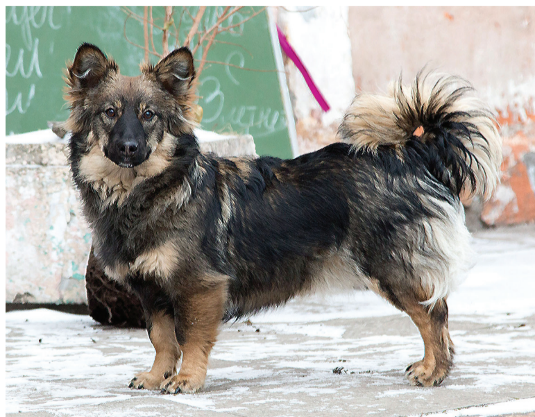
Стафеевым подбрасывают животных. Накормить их – проблема.

Ангела ГОЛУБЧИКОВА.