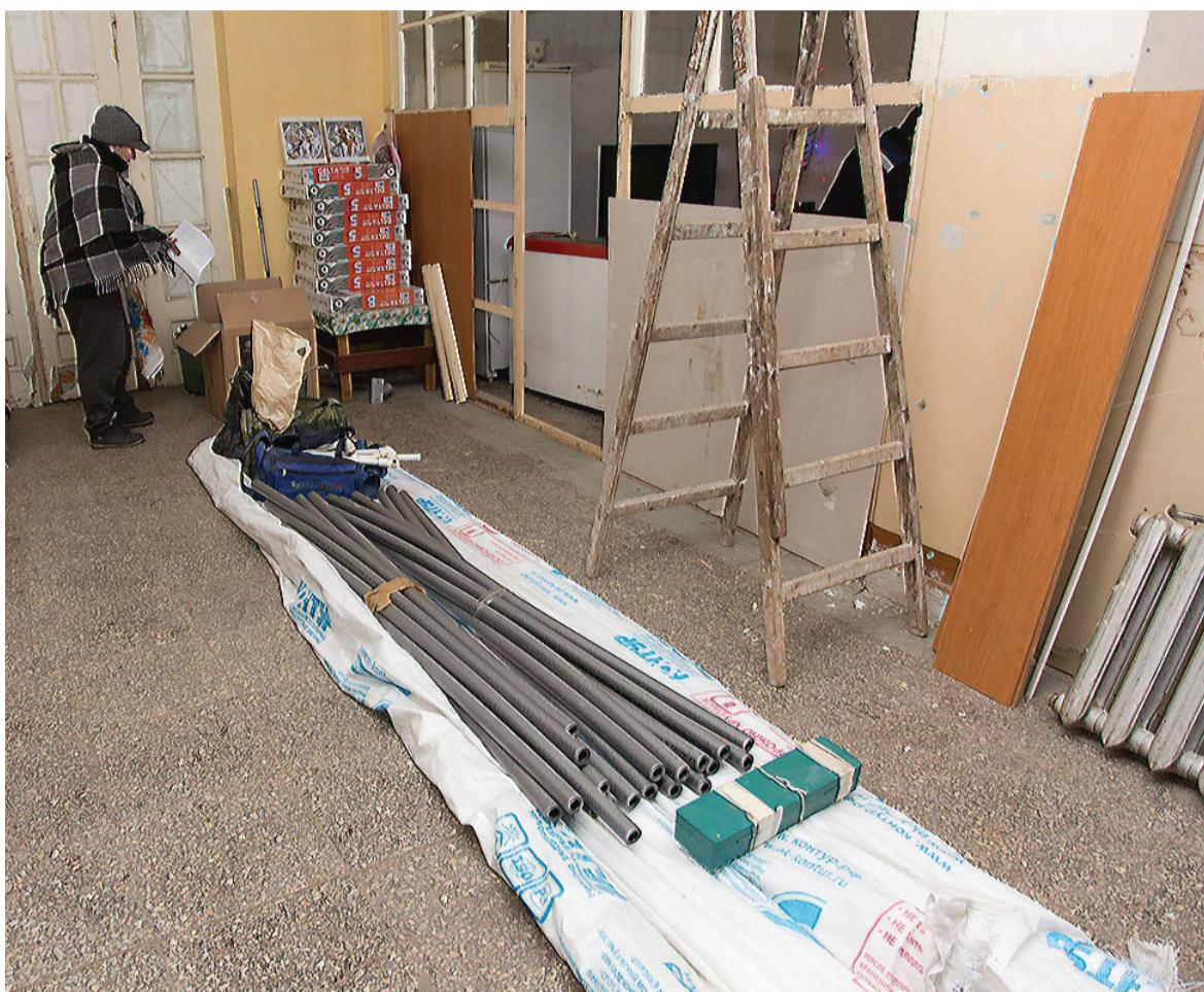
Есть все необходимое для монтажа теплосистемы.