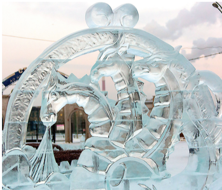
Ледяной Змей Горыныч.

Сотрудники Дворца культуры имени И. В. Окунева подготовили программы «Невероятное путешествие богатыря за новогодним чудом» и «Премия Деда Мороза», во Дворце культуры Сухоложского были свои «Новогодние витаминки», «Золотой ключик, или Дверь в Новый год» и «Рождественские встречи». Районный Дворец детского и юношеского творчества по-