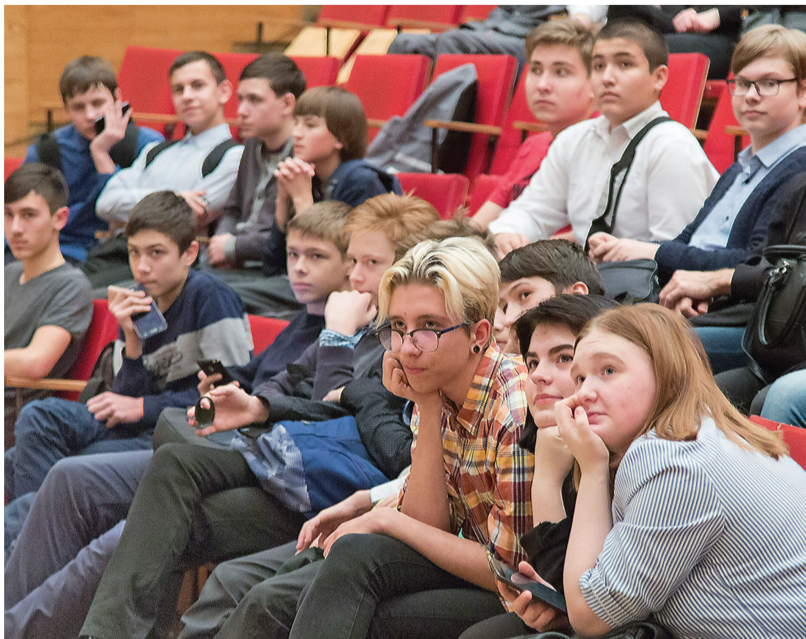
Участники IT-форума профориентации.

На разработку виртуальных симуляторов профессий он получил президентский грант в размере 2,5 млн. рублей. Еще 3 млн. рублей центр развития молодежных инициатив получил на развитие образовательного кластера в центре Нижнего Тагила. Кластер занимает цокольный этаж одного из подъездов дома по проспекту Строителей, 27. На площади 300 кв. метров созда-