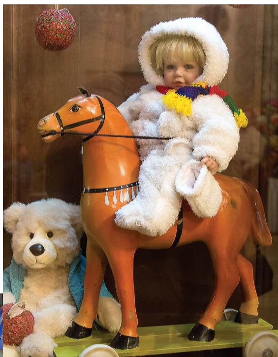
В витринах ретро-игрушки.

каждой комнаты можно долго разглядывать и обсуждать. Но, конечно, интереснее, если о выставке расскажут сами сотрудники театра. Поэтому воспитателям детских садов и учителям начальных классов есть смысл обратиться в театр с предложением провести для ребят тематическое занятие, посвященное куклам. Интересно будет всем, и взрослым, и детям.