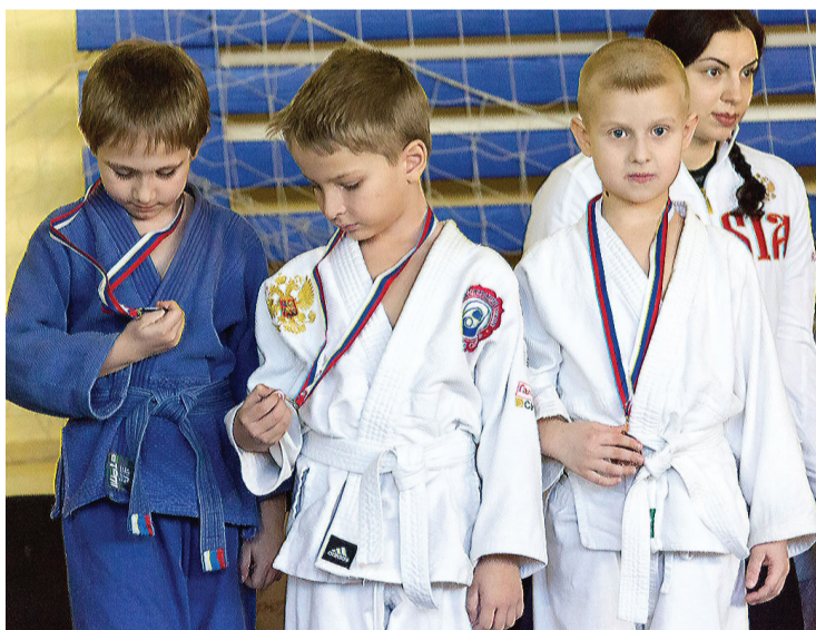
Медали пока в диковинку.