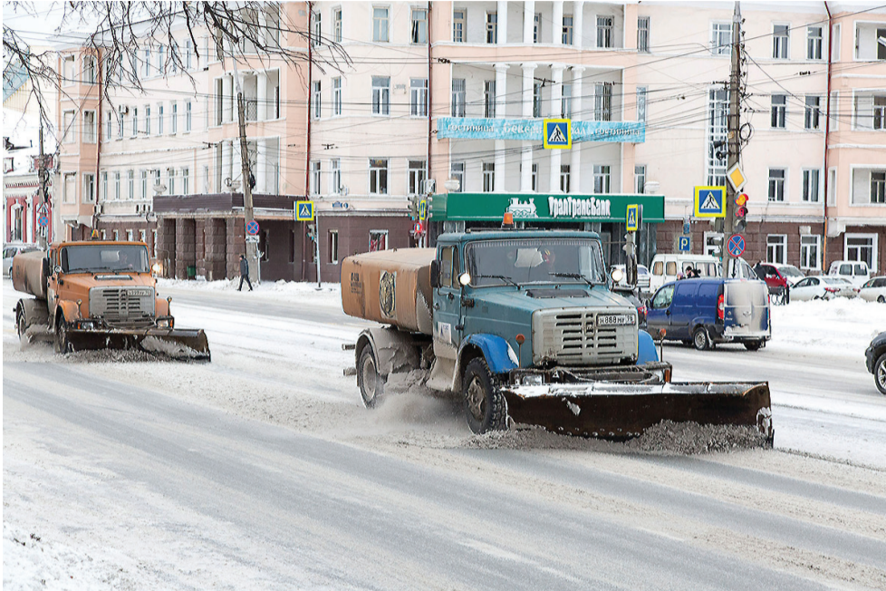
Уборка на проспекте Ленина.

Зима уже почти миновала свой экватор, но так и не расщедрилась для уральцев на снег и морозы