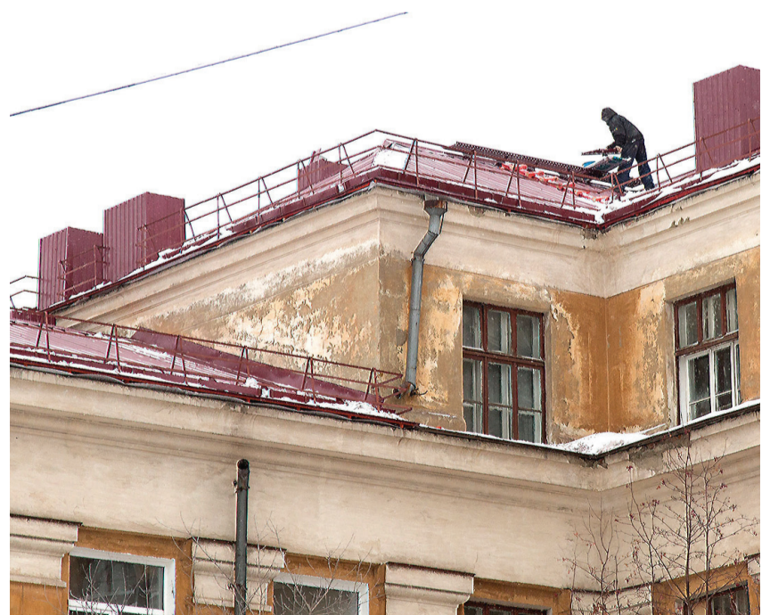
Новая крыша практически готова.

Еще одна хорошая новость – для школы №65 в поселке Сухоложский