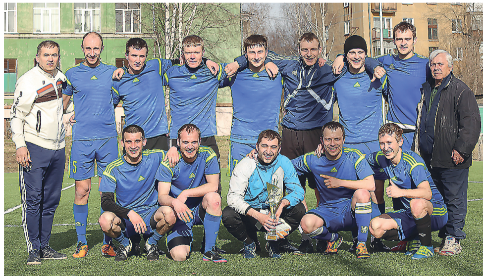
Обладатель Кубка Победы ФК «Гальянский».