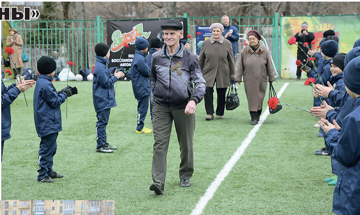
Живой коридор почета.

В итоге команда СШОР «Уралец»-2009 подписала на город-