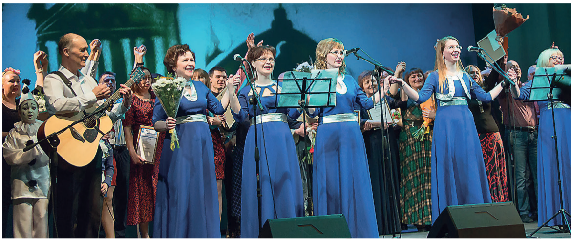
Ансамбль «Ли́ра» во время финальной песни.