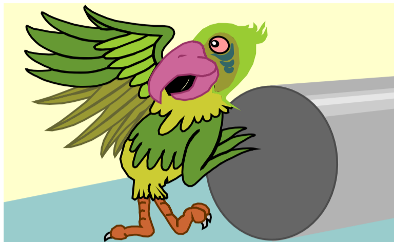
иллюстрация владимира трошина.

Обычно коматозное животное погружалось в контейнер наврде тубуса для чертежей, в котором просверливались аккуратные дырочки, и в таком состоянии везлось на новое место жительства.