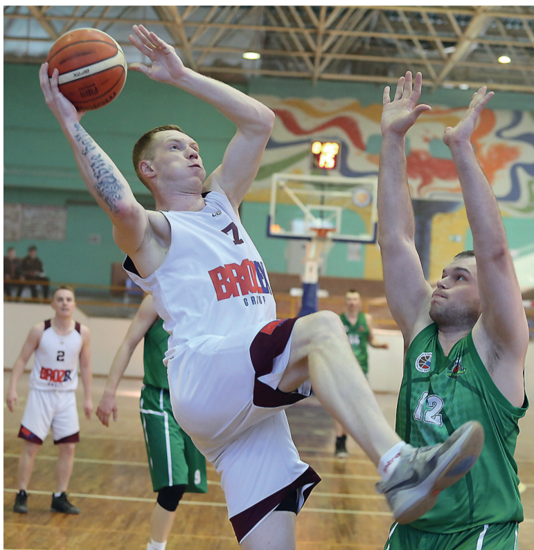
Березовский. Атака команды BROZEX.