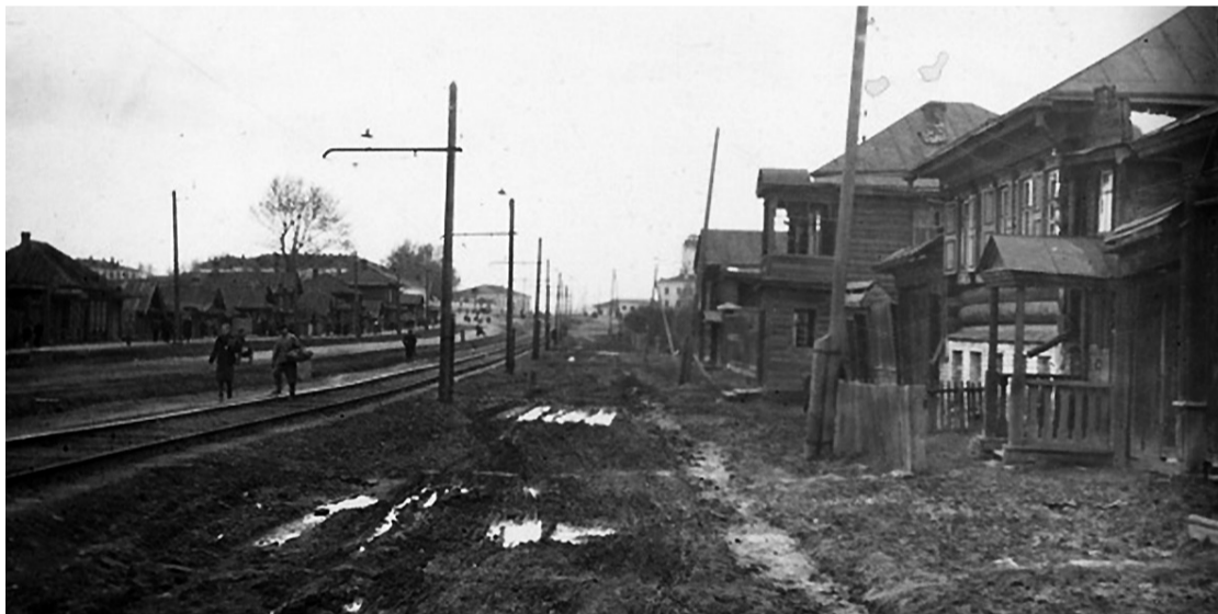
Однопутная трамвайная линия по улице Ленина, 1946 год.