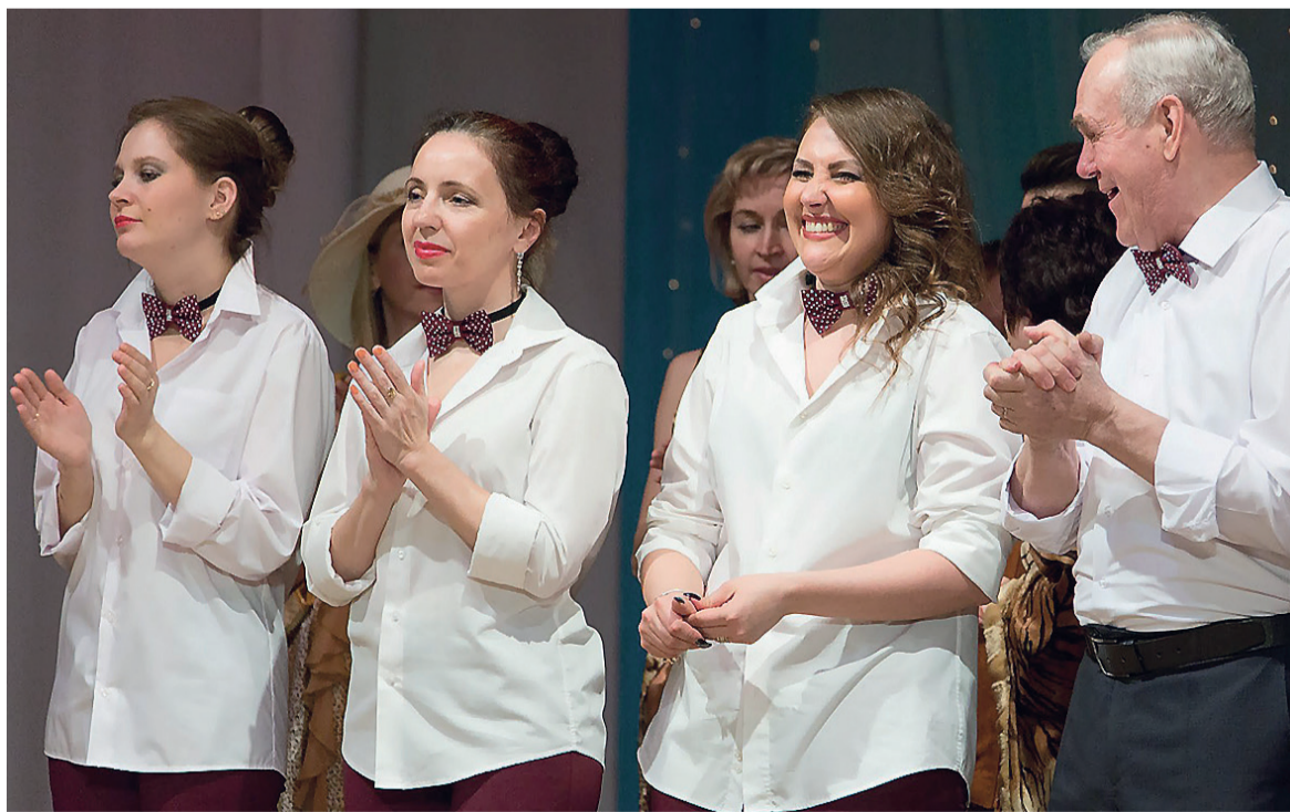
Вокальный ансамбль «Мелодия души» победил в номинации «Вокал: ансамбли, хоры».