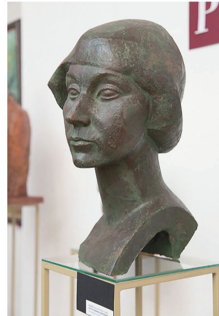
«Портрет Марины Цветаевой», стекловолокно, 1975 год.