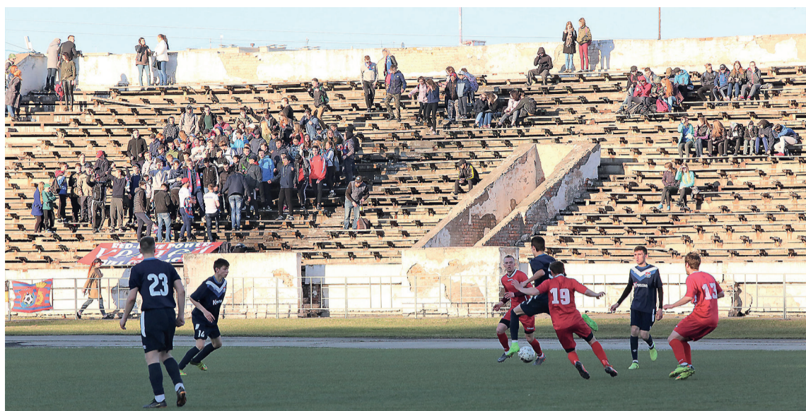
Болельщиков на трибунах все больше.

В первой группе чемпионата Свердловской области Нижний Тагил представля-