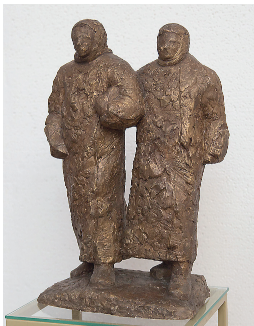
«Подруги», гипс, 1977 год.