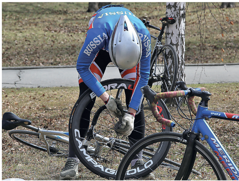
Сначала надо подготовить велосипед...

В Нижнем Тагиле состоялось первенство Свердловской области по велоспорту на шоссе. Соревновались более 200 спортсменов из семи городов, в том числе – представители Тюмени.