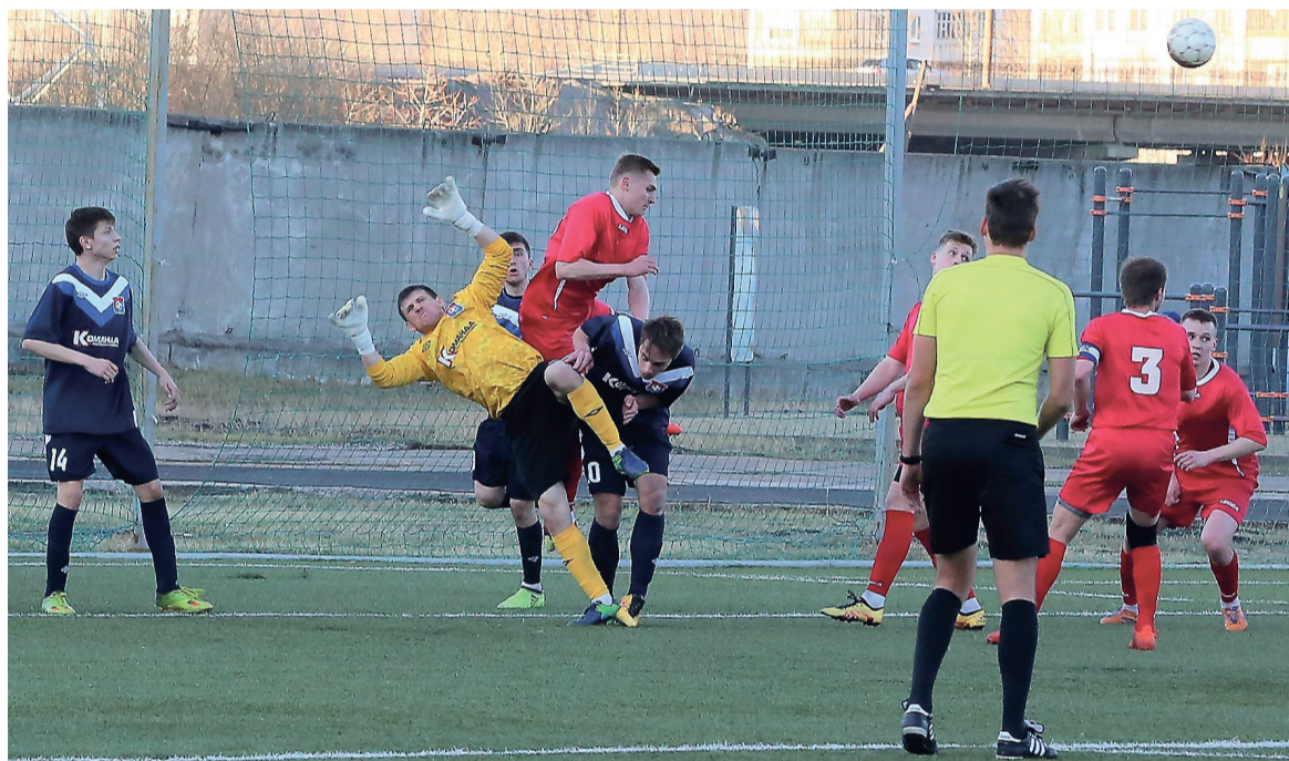
«Уралец-НТ» - «Металлург» (Магнитогорск). Опасный момент справа от ворот тагильчан.