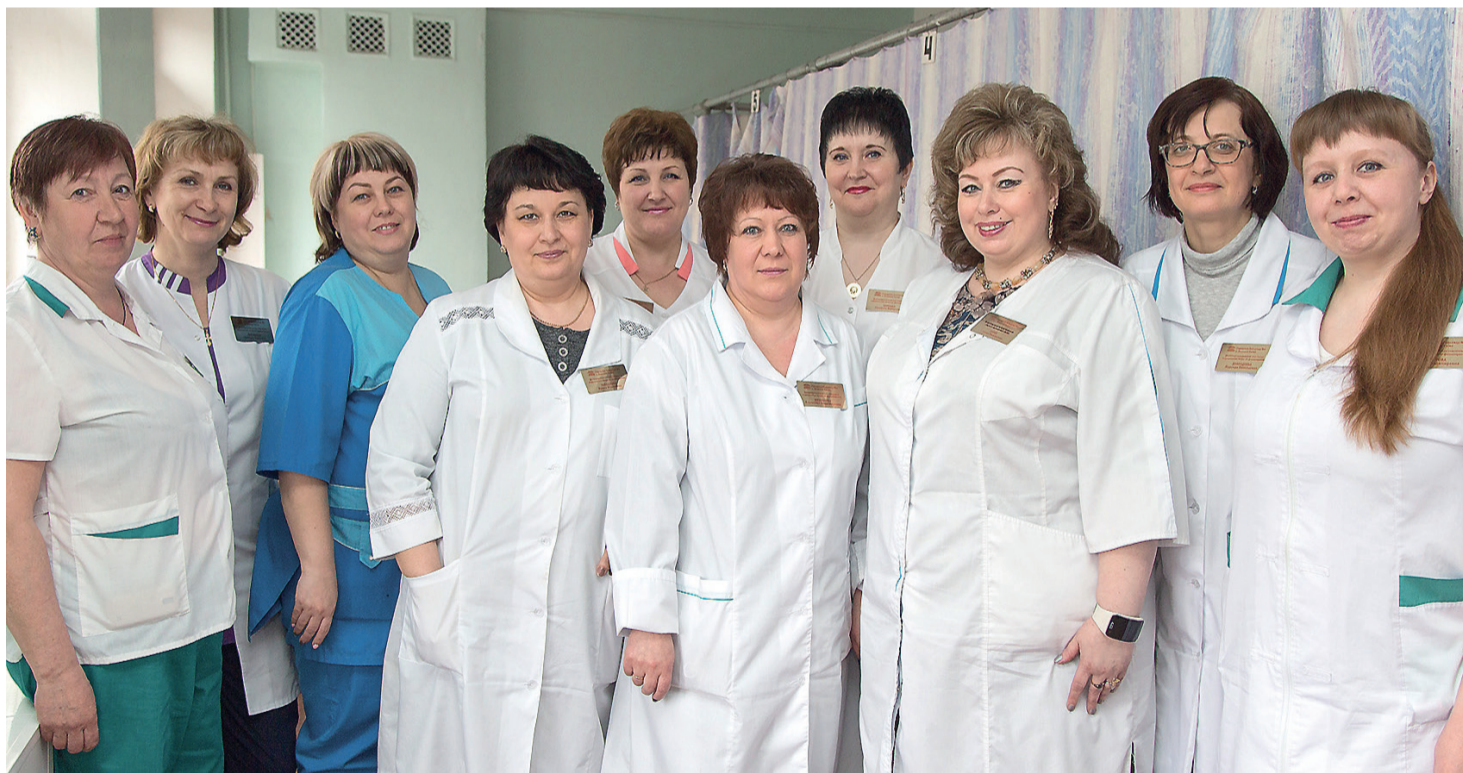
Дружный коллектив медсестер физиотерапевтического отделения горбольницы №4