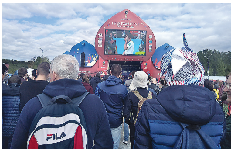
Фан-зона. Идет матч Уругвай – Египет.

ничего сказать, пропустили так. На втором пропускном пункте тоже пропустили. Приходим на свой ряд, и... Где мое 37-е место? Хорошо, что рядом было несколько свободных, и мы без проблем их заняли».