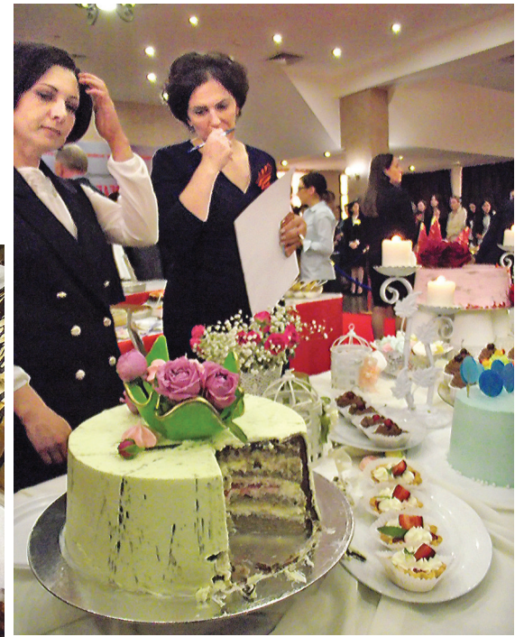
Тяжелая работа у жюри – надо попробовать все.

ющаяся по украшенной зеленым венком лестнице.