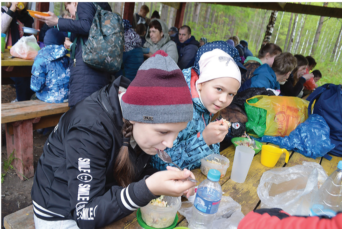
Главное в походе – это обед.