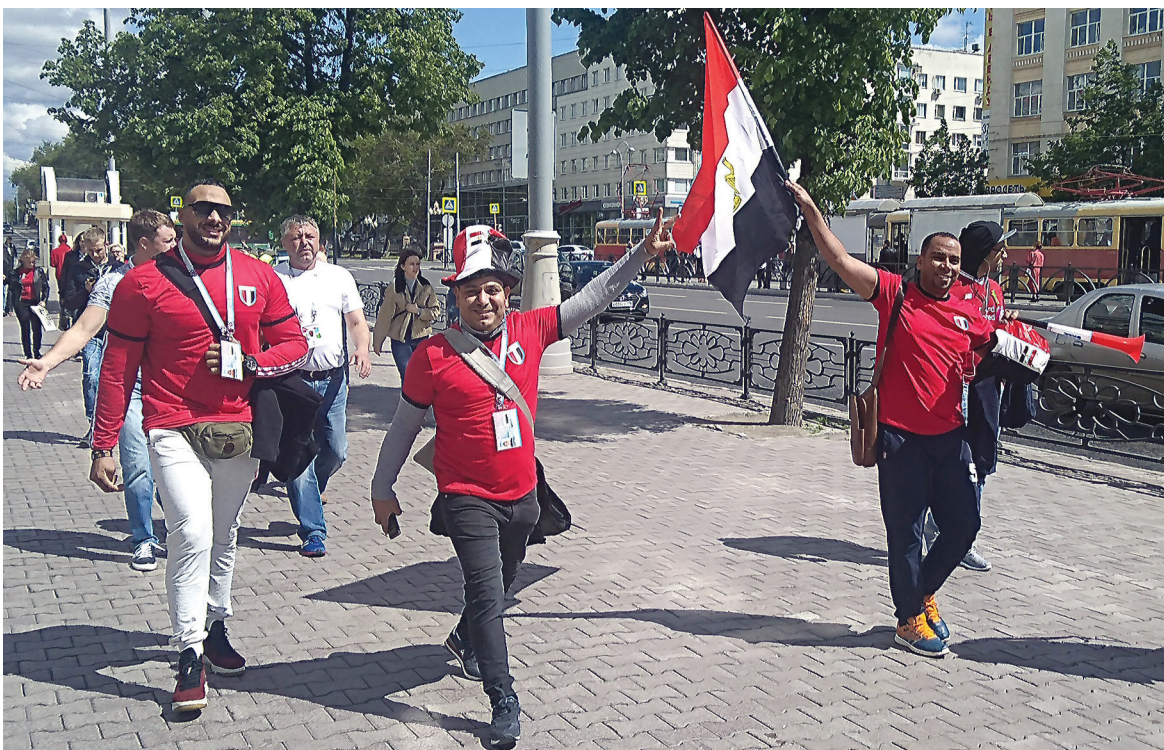
Египтяне на улице Ленина.

Проблема возникла и у другого нашего земляка: «Билеты были куплены еще в октябре. И буквально пару дней назад на почту приходит сообщение - какие-то проблемы, обратитесь в билетный центр. Ну ладно, перед матчем зашли, там что-то долго не могли понять, говорят, один би-