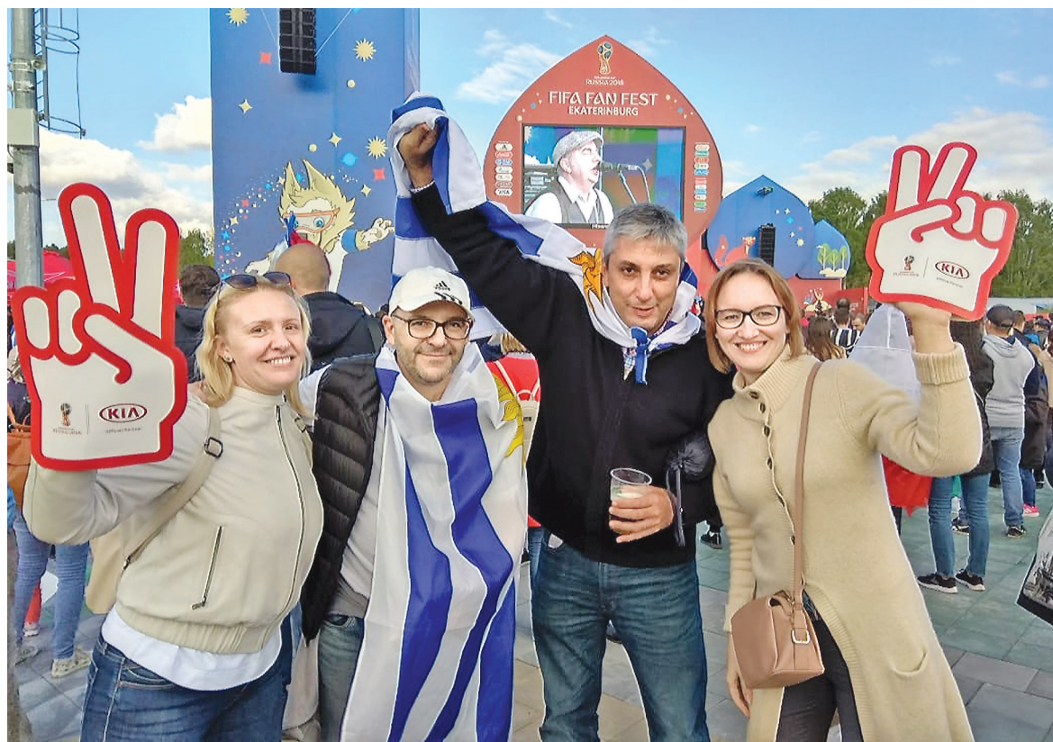
В фан-зоне перед матчем сборной России. Уральские и уругвайские болельщики.

Заранее сообщалось, что на встрече сборных Уругвая и Египта будет аншлаг: продан 30061 билет. На самом деле, зрителей собралось чуть более 27000. Осталось не занятыми зоны партнеров ФИФА,