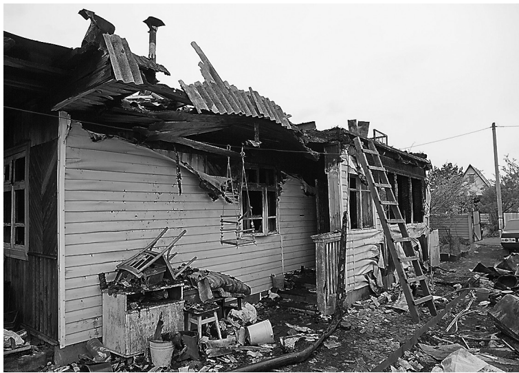
Дом выгорел полностью.