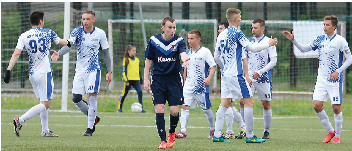
После очередного гола уфимского «Витязя» в ворота «Уральца-НТ».

Чемпионат мира в самом разгаре, но тагильские болельщики находят время, чтобы посетить местные стадионы и поддержать наши команды.