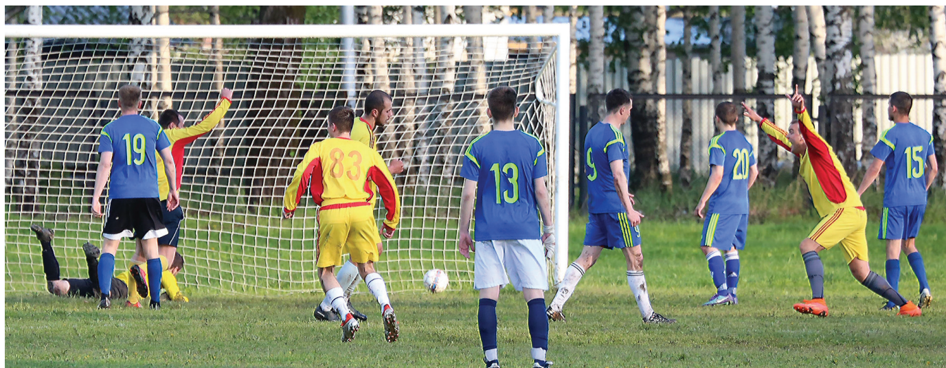
Футболисты АО «ХЗ Планта» поражают ворота ФК «Гальянский».