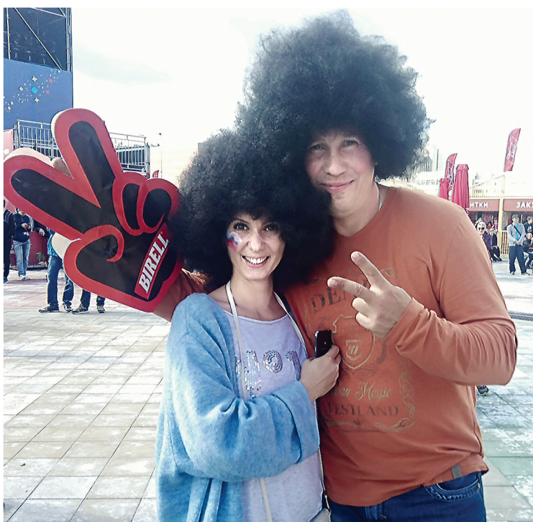
Болельщики из Екатеринбурга.

лет аннулирован. Послали нас в другой билетный центр около стадиона, сказали, там решат проблему. Пришли. А там такая же история, сказали идти на стадион, там разберутся. Ну, ок. На входе в стадион тоже не смогли