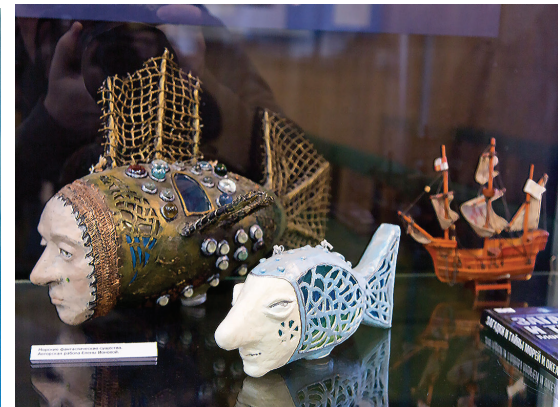
Морские фантастические существа, авторская работа Елены Иононой.