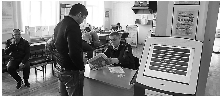
Очереди нет, практически все приезжают к назначенному сроку.

Поддача заявления через портал Госуслуг позволяет водителям значительно сэкономить