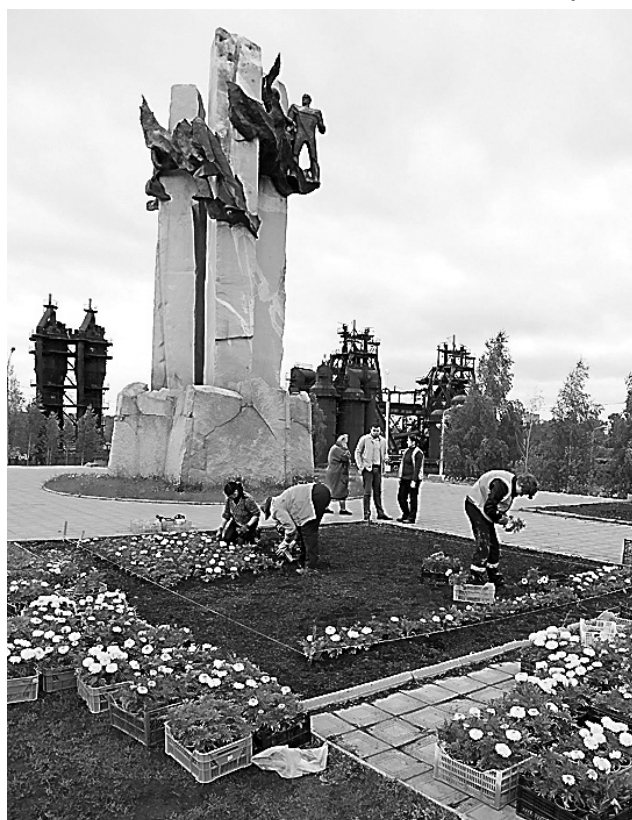
Формирование клумб под Лисьей горой.

Специально проверили, как идет процесс строитель-