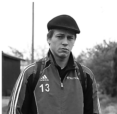
Леонид Голованов.