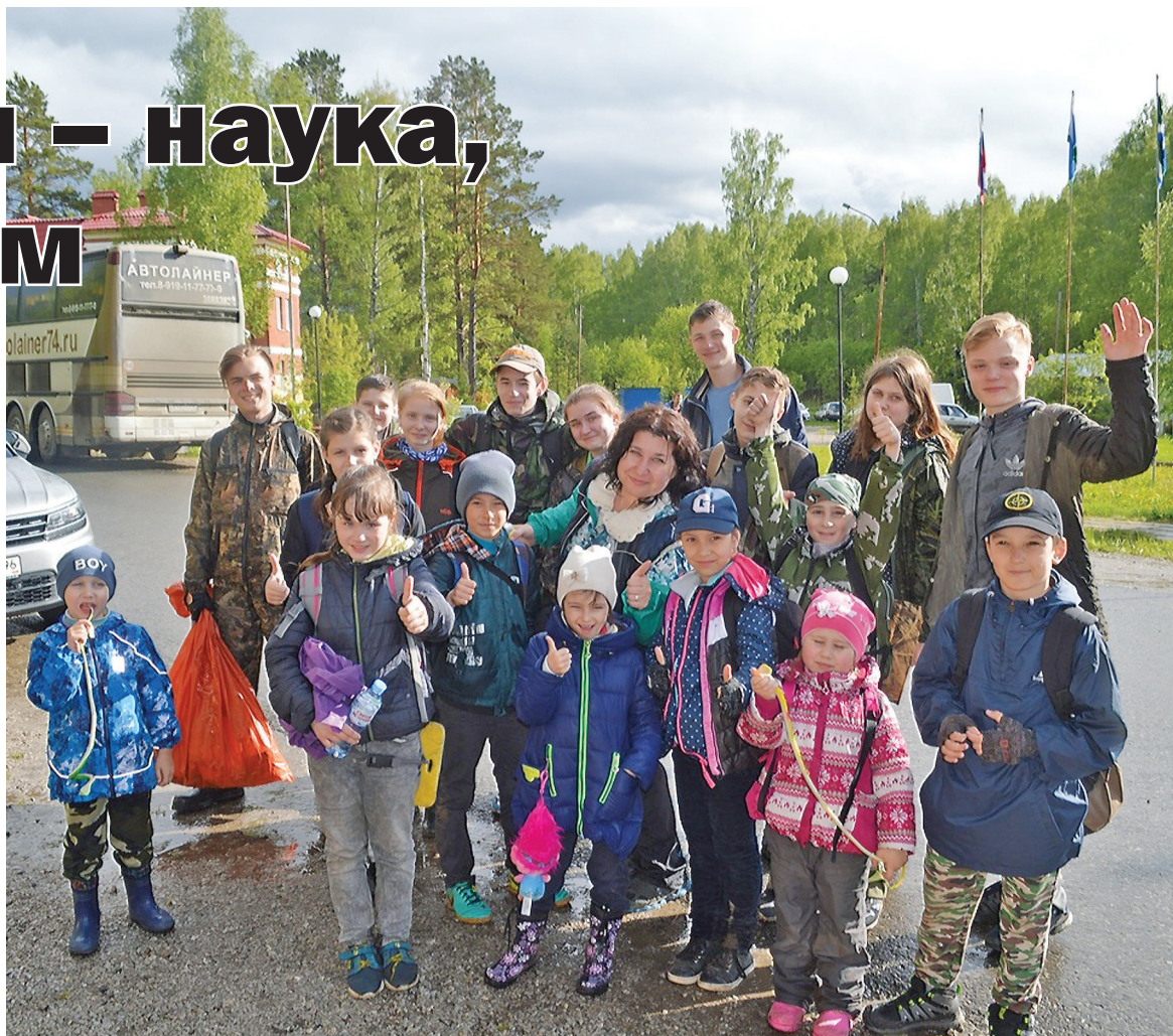
Немного уставшие, но счастливые юннаты.

В один из дней тагильчане совершили обход по так называемому «малому кругу»: около 6 км по тропам. Взрослый человек прошел бы такую дистанцию обычным шагом за час-полтора. Юные исследователи идут медленно, но не из-за усталости. Группа осматривает