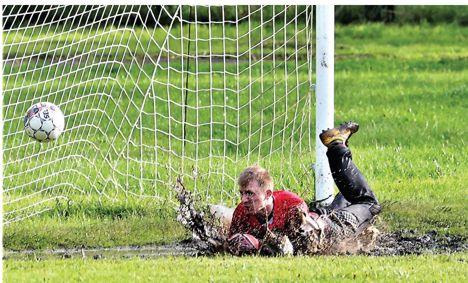
После дождя тяжелее всего приходилось на поле стадиона «Алмаз» вратарям.