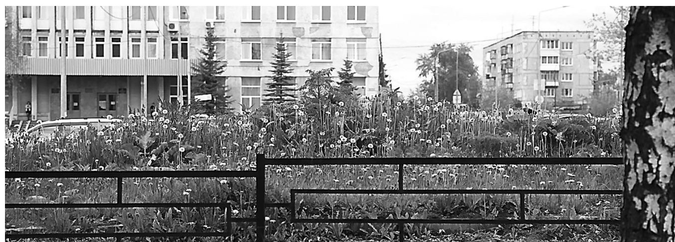
Заросли напротив администрации Дзержинского района.