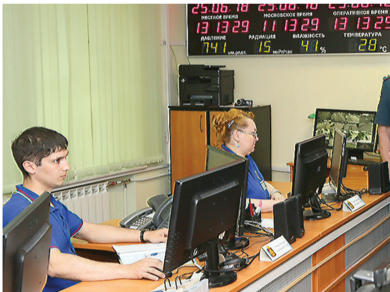
В единой дежурно-диспетчерской службе.