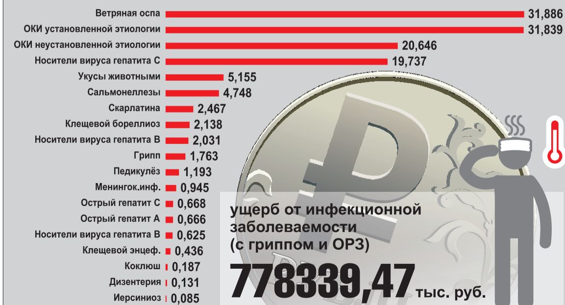
ИНФОГРАФИКА ПЕТРА УПОРОВА.