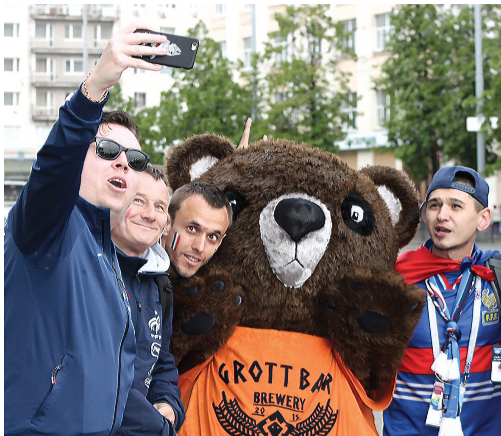
Кто сказал, что по Екатеринбургу не ходят медведи?!

В Екатеринбурге прошли оставшиеся три матча в рамках чемпионата мира по футболу