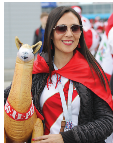
Надувные ламы, символы Перу, не помогли сборной одержать победу.