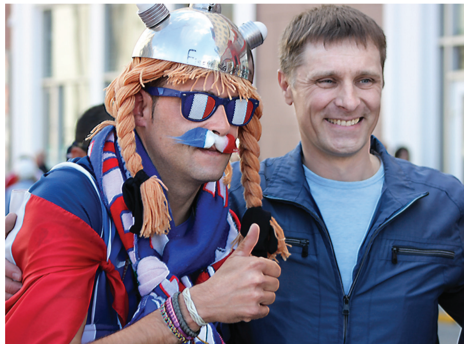
Фанат сборной Франции в образе Астерикса.