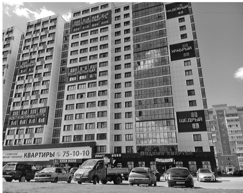
Так выглядят лучшие в России многоэтажки.