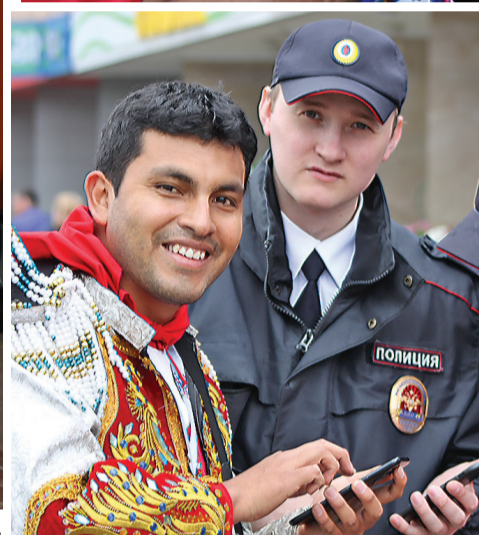
Перуанский болельщик и полицейский пытаются найти общий язык с помощью переводчика в смартфоне.