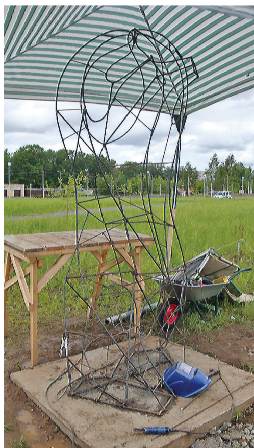
Пока трудно узнать, но это «Медведь. Хозяин тайги».