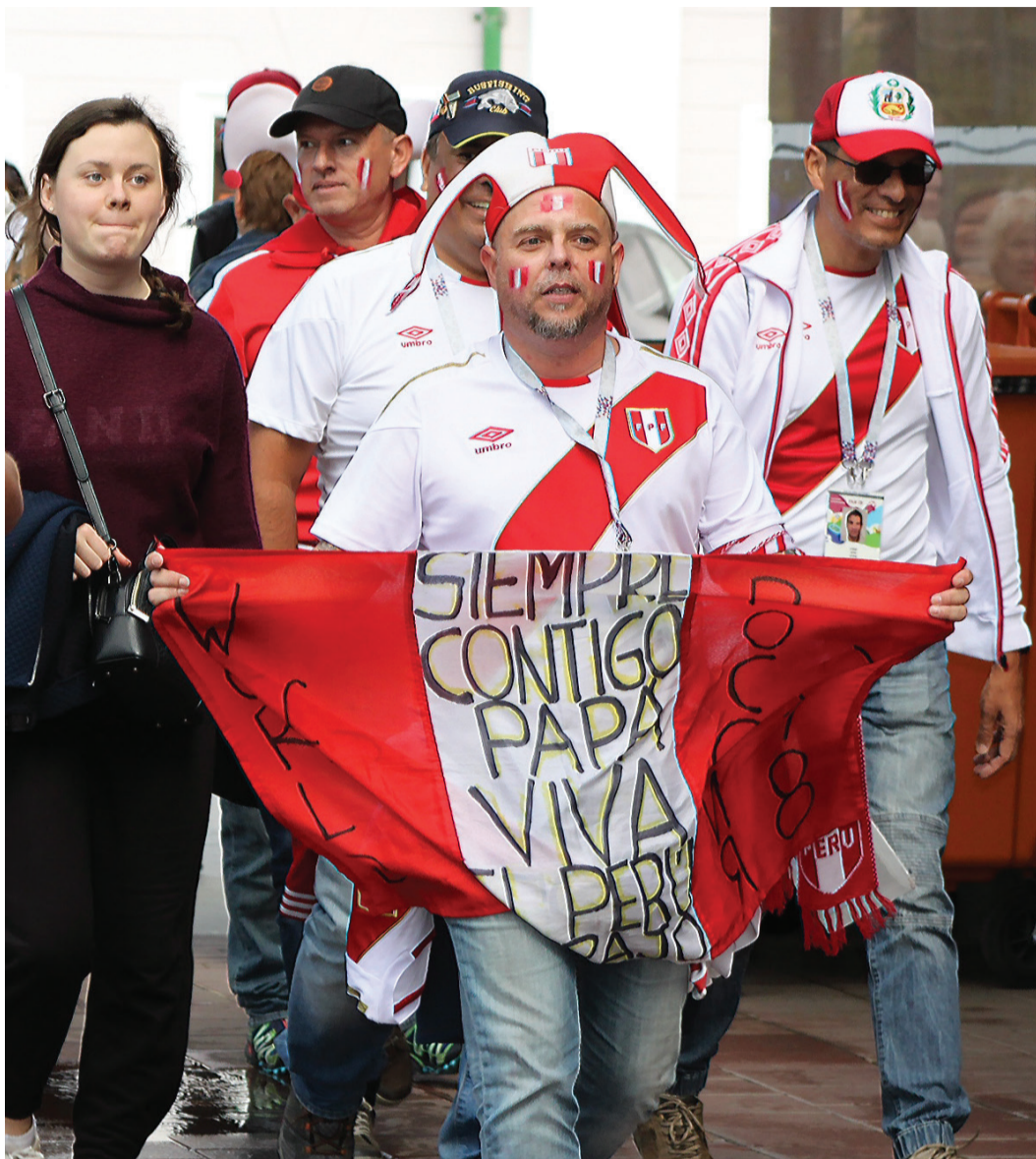
Красно-белая река потекла в направлении стадиона.