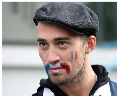
Россияне наносили на лицо изображение флагов обеих сборных.