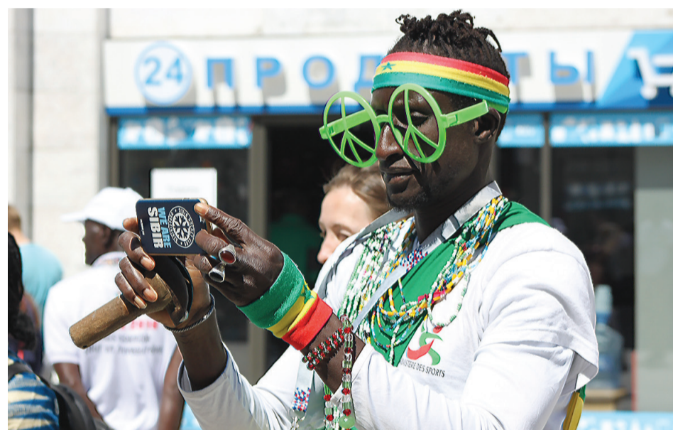
Болельщик из Сенегала.

Областной центр посетили болельщики Франции, Перу, Японии и Сенегала, Швеции и Мексики, раскрасив яркими красками уральские будни. Особенно постарались перуанцы, которые устроили настоящий праздник. Они не жалели эмоций: от всей души радовались перед матчем и так же искренне плакали после поражения любимой команды.