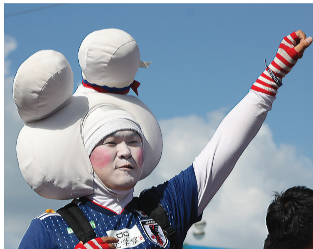
Креативные фанаты из Японии.

В отличие от тех же египтян, перуанцы были, в основном, в возрасте за 30. Много семейных пар, кто-то привез детей, даже грудных. К местному лету оказались готовы не все. Несмотря на