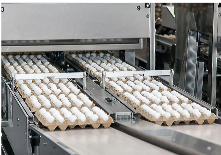
Нижнетагильская птицефабрика ежегодно производит более 300 млн. яиц.

модействие с Нижним Тагилом, которое, скорее всего, повлечет за собой наращивание производственного комплекса и увеличение числа рабочих мест.