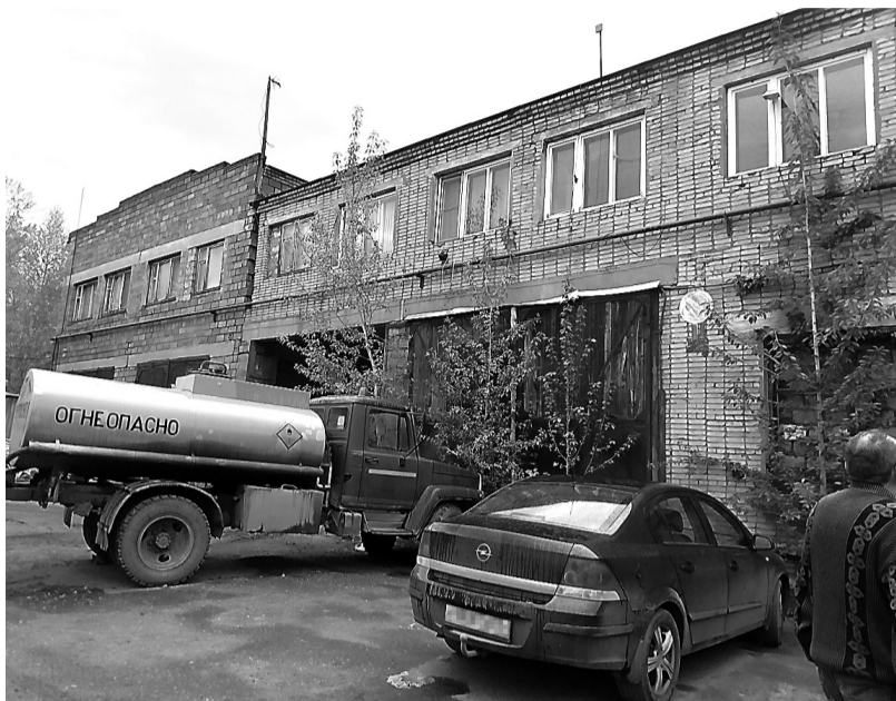
В любой момент имущество должников может пойти с молотка.

В свою очередь предприниматели, не желая запятнать свою репутацию перед партнерами-арендаторами, а также надеясь и дальше вести коммерческую деятельность, приносящую доход, оплатили часть задолжен-