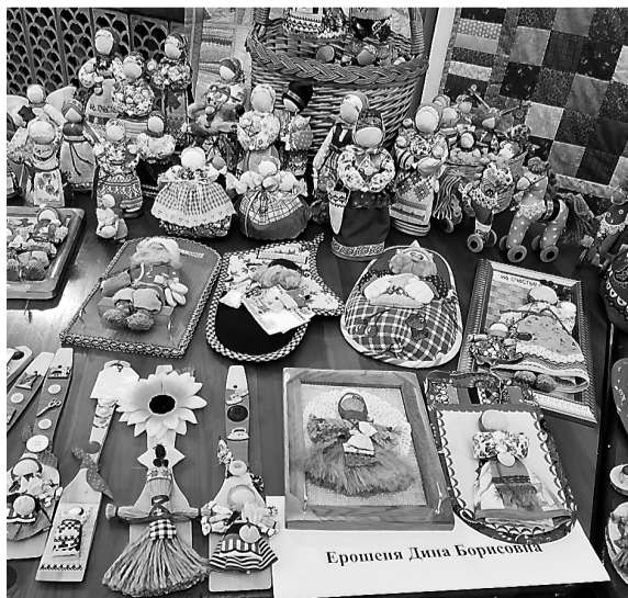
Народные куклы и обереги. Автор – Дина Ерошениа.