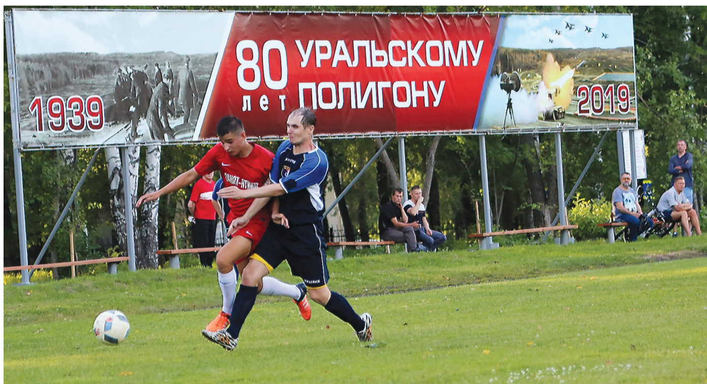
Момент матча «Салют» - ФК «Фортуна».

По отзывам гостей, футбольное поле стадиона «Салют» в хорошем состоянии.