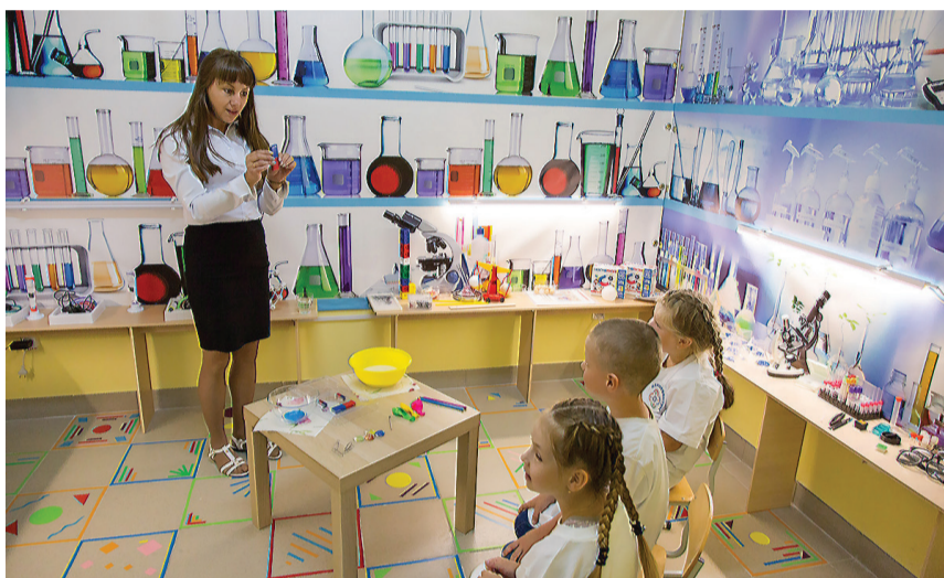
В одной из лабораторий детского сада.