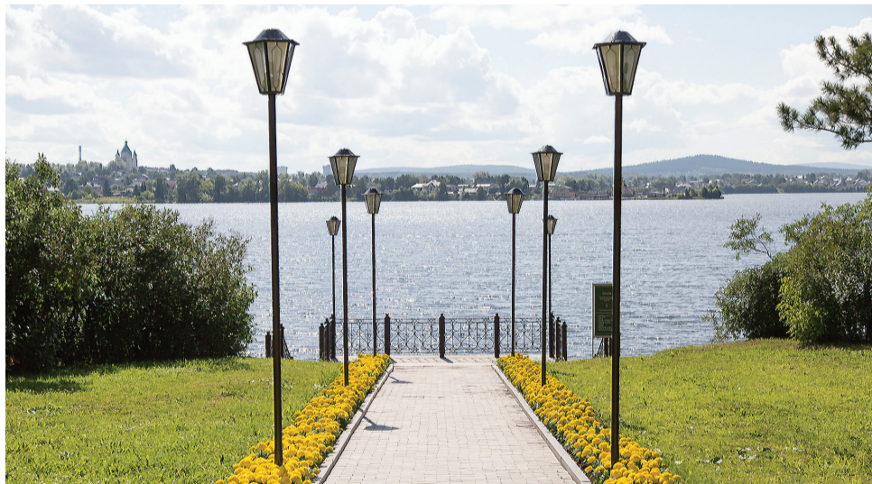
Вид с территории «Демидовской дачи».

Когда говорю это, многие смеются, но я говорю только о том, что вижу. В нашем городе много возможностей, больше, чем в областных центрах. Молодежь старается уехать, не понимая того, что именно в Тагиле можно добиться серьезных результатов.