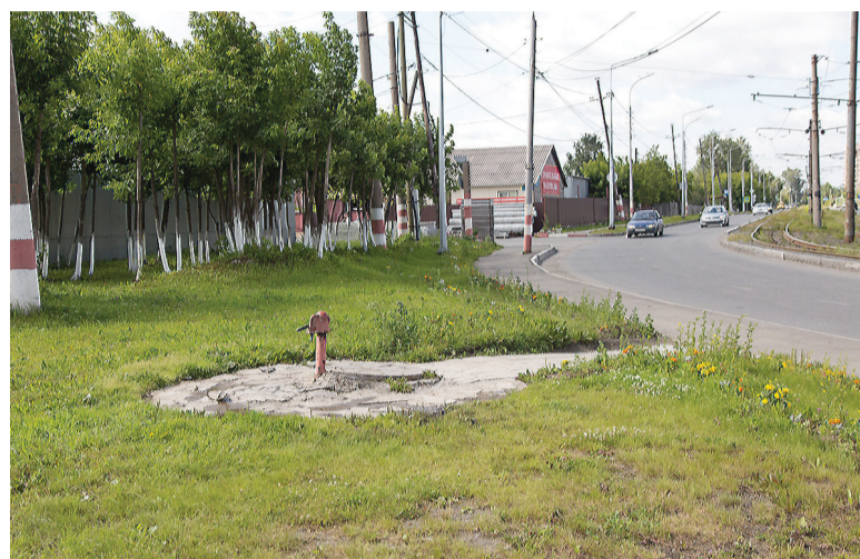
Газон, рожица, клумбы – все это появилось по инициативе предпринимателя.

Амояны (а на исконный для курдов манер - Амои) - родом из Армении, откуда немало народа выехало в Россию после