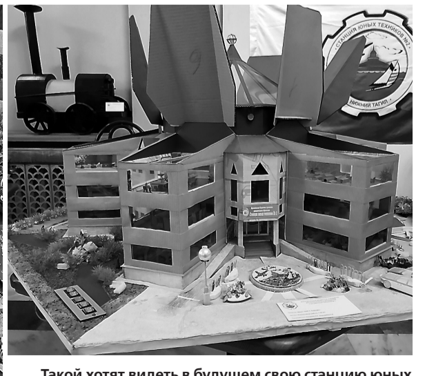
Такой хотят видеть в будущем свою станцию юных техников №2 ее воспитанники.