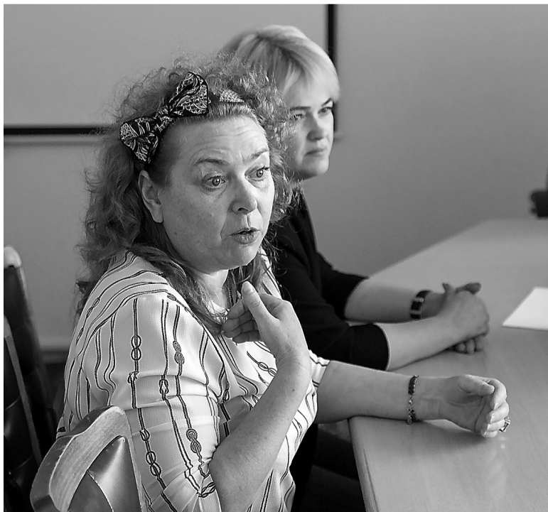
Родители учащихся школы №55.

Ольга ДУМЧЕНКОВА.