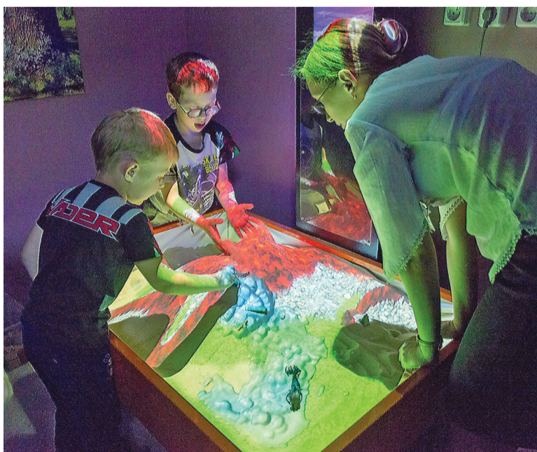
Занятие в сенсорной комнате.