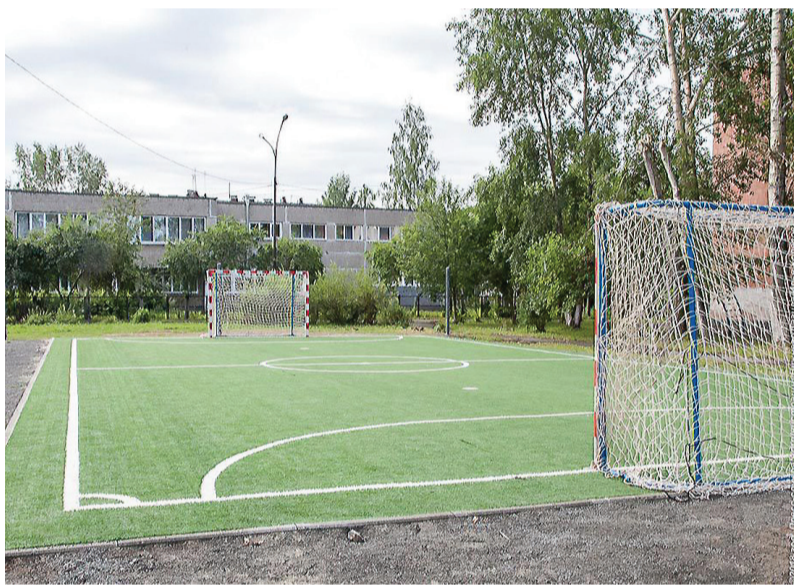
Новое футбольное поле ждет школьников.