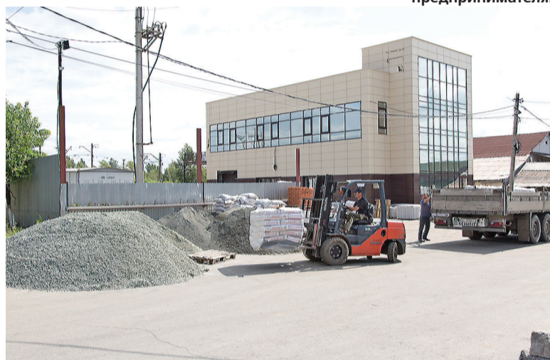
Заканчивают строительство офисного здания.

разрушительного землетрясения 1988 года.