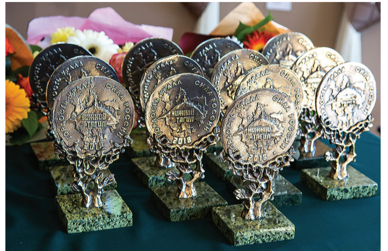
Памятные знаки к Дню города.

Н аграждение победителей смотра-конкурса к Дню города впервые прошло в музее-усадьбе «Демидовская дача». Это идея временно исполняющего полномочия главы города Владислава Пинаева. Исторические интерьеры, солнечная погода и звуки оркестра создали теплую атмосферу. И, похоже, новая традиция приживется, говорят участники конкурса. Победители определены в 28 номинациях. Эти люди – гордость Тагила, подчеркнул Владислав Пинаев: