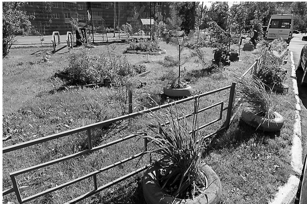
Во дворе ТСЖ «Зари,11» посадили новые деревья.