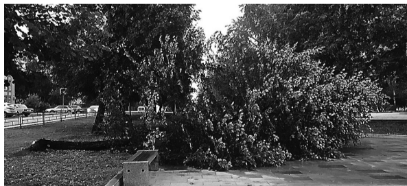
Липа на набережной.

Сильный ветер повалил несколько деревьев. В частности, на набережной «Тагильская лагуна» рухнула липа. Также поступали сообщения о сломанном дереве у детского сада № 162 в центре Нижнего Тагила. Во дворе дома № 38 на Садовой улице сломаны ветки тополей. Такая же картина в других районах города. В центре и на Тагилстрое встали трамваи: повалившийся тополь повредил контактную сеть. Электроэнергия