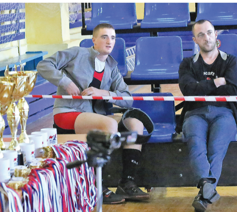
А как выступают другие?

В командном зачете у девушек на первом месте Кур-