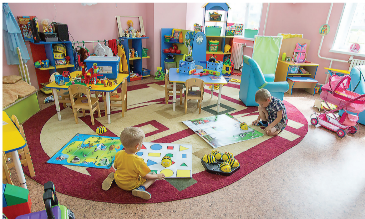
Одна из групп.

В коридорах здания установлены сенсорные экраны, с помощью которых мамы и папы могут получить ответы на свои