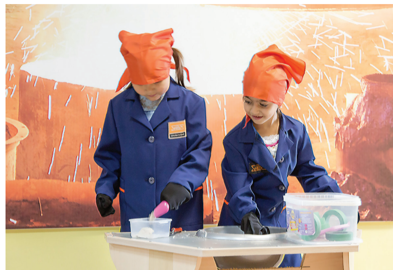
За работой юные формовщицы.

Здесь малыши знакомятся с металлургическим производством.