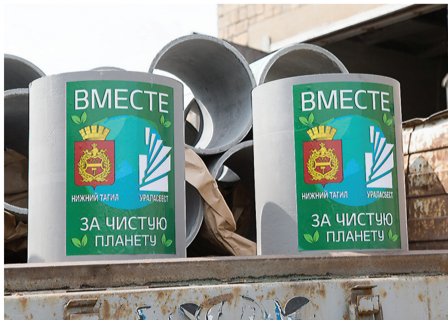
Скоро такие урны появятся на улицах Нижнего Тагила.

- Урны изготовлены из хризотила. Это долговечный материал, кото-