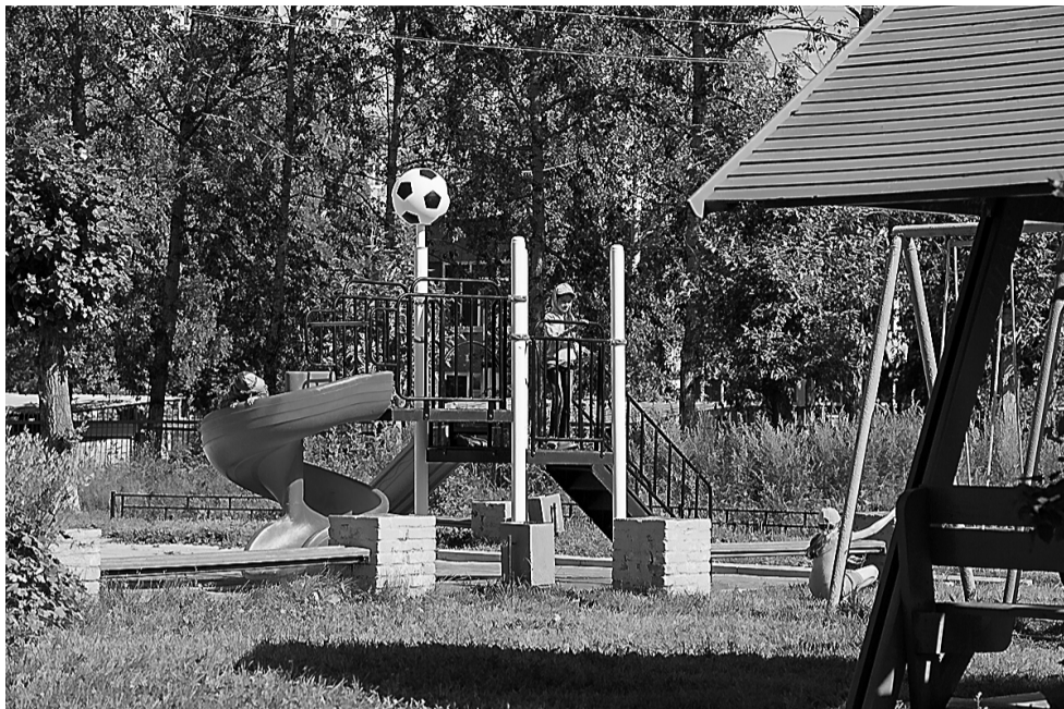
Во дворе ТСЖ «Зари,13» удобно и юным, и пожилым.