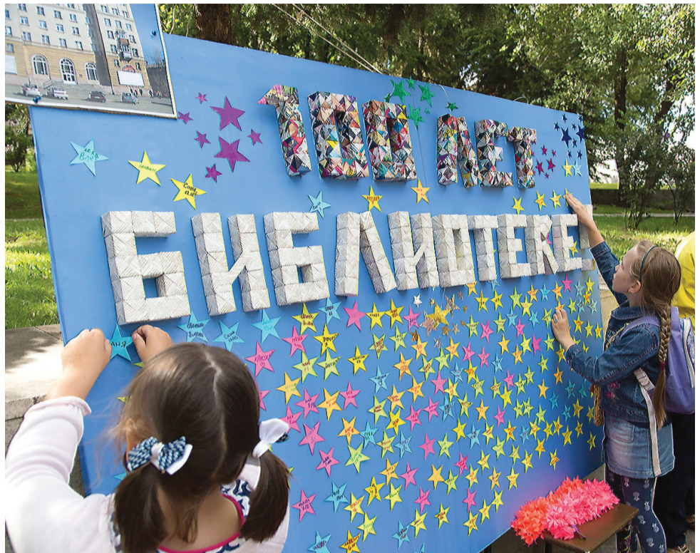
Звезды юных тагильчан – на память библиотеке.