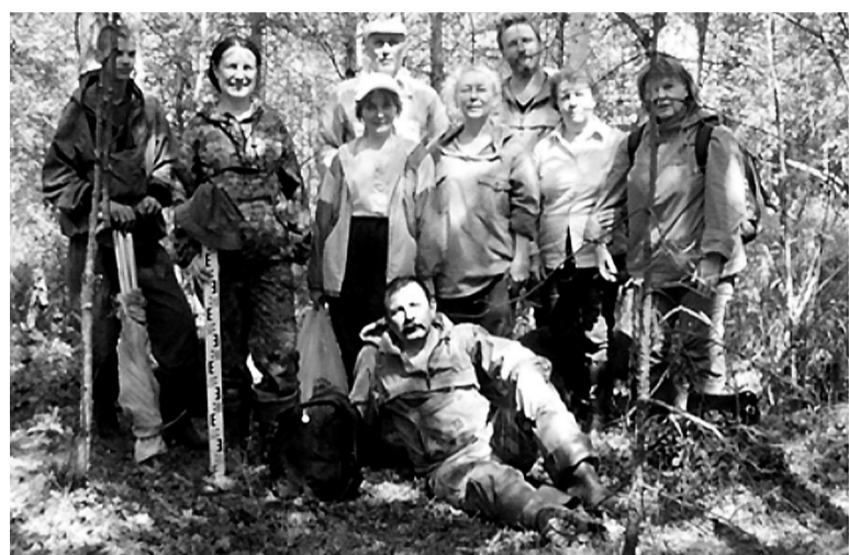
Участники полевого семинара, посвященного 100-летию исследования Горбуновского торфяника. Июль, 2008 г.

С начала 2000-х открыты новый береговой памятник (Береговая XI) и три памятника в прибрежной зоне, проведены раскопки берегового памятника – Береговая IX; торфяниковой части стоянок Береговая I, II, IX и новой мастерской по изготовлению рубящих орудий Береговой IXА, продолжены раскопки VI разреза, осуществлен мониторинг объектов культурного наследия