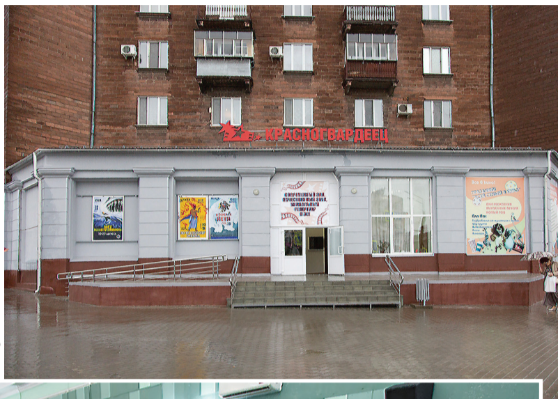
Новое крыльцо «Красногвардейца».

Теперь единственный в городе муниципальный кинотеатр может показывать тагильчанам любое кино: классику начала прошлого века и суперсовременные блокбастеры, советские киношедевры и авторские картины для узкого круга зрителей, документальные фильмы и мультки с потрясающими спецэффектами... И при этом здесь сохраняют традиции проведения кинофестивалей, за-