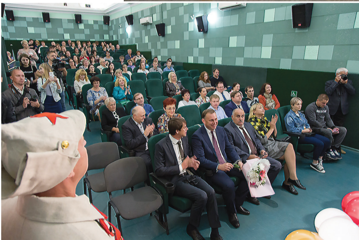
В обновленном зале.

нятий в кино клубах, праздников для школьников и малышей.