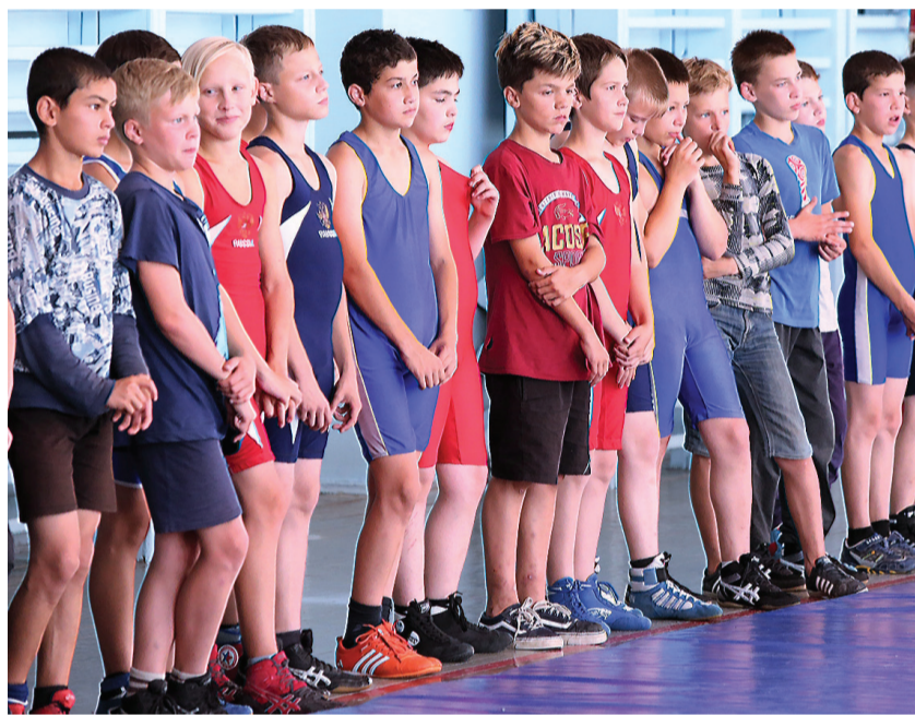
На параде открытия.