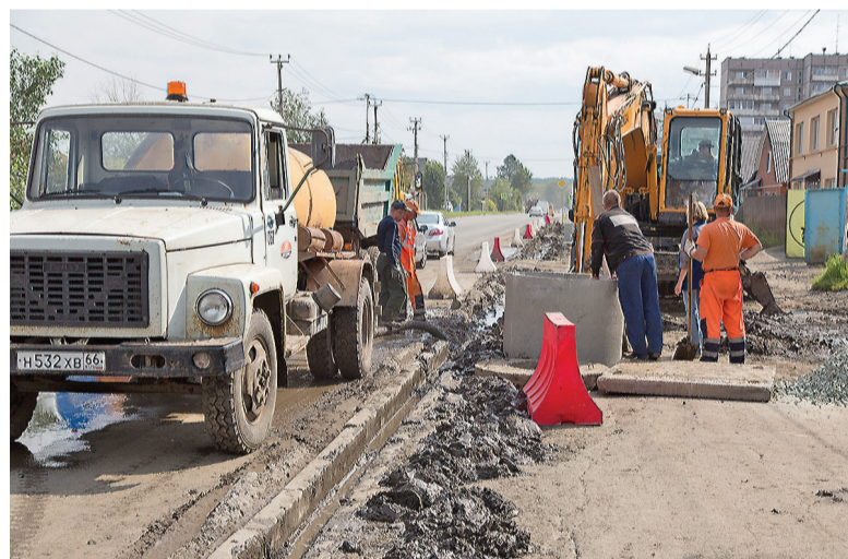
На улице Ильича.