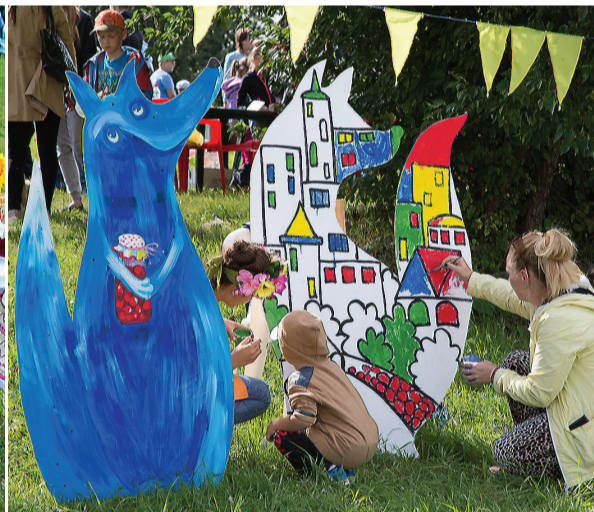
Лисы на Лисьей горе.

гостей развлекали квестами, загадками, традиционным аквагримом и уникальным трансформером.