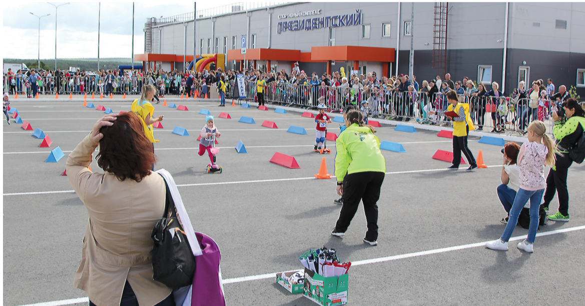
Если так пойдет дальше, гонки на самокатах будут собирать больше народа, чем стритбол.