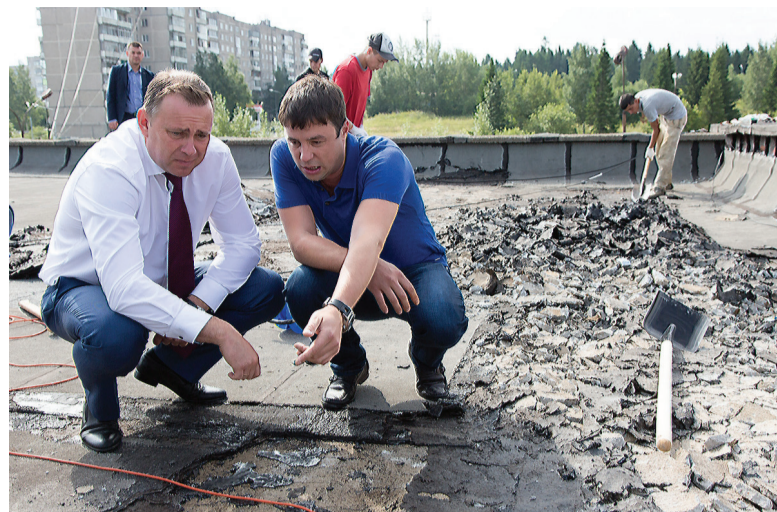
На крыше школы №55.

Строители готовы успокоить взволнованных жителей и уверяют, что неудобства временные и двор будет благоустроен согласно плану и в назначенный срок.