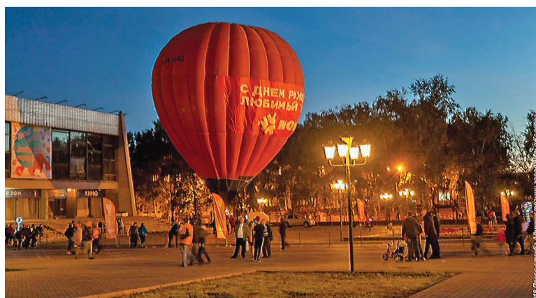
Воздушный шар для смельчаков.