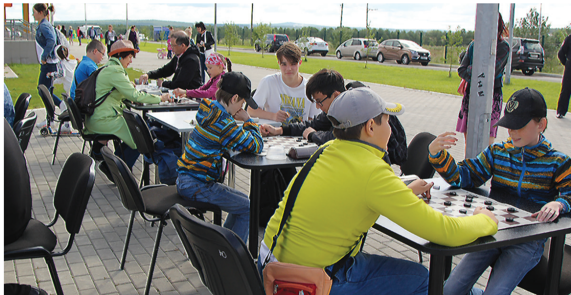
Не забыли и про шашки - тоже спорт!

тоже не протолкнуться - около 300 участников. Мальши в возрасте три-четыре года преодолевали дистанцию в 25 метров, а те, кто постарше (пять-шесть и семь-восемь лет) - целых 50 метров.