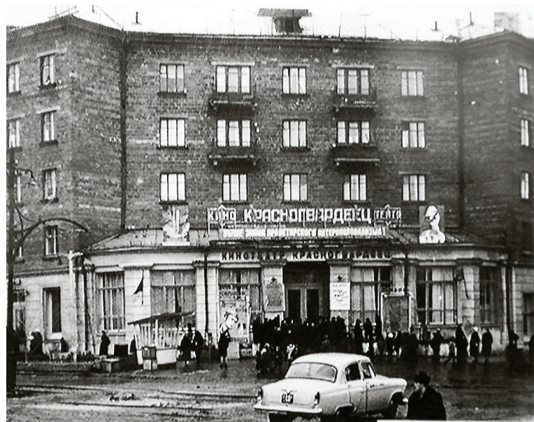
А таким кинотеатр был несколько десятилетий назад.