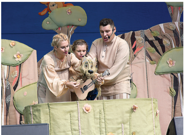
На сцене актеры театра кукол.

Дети и взрослые знакомились с профессией бутафора.