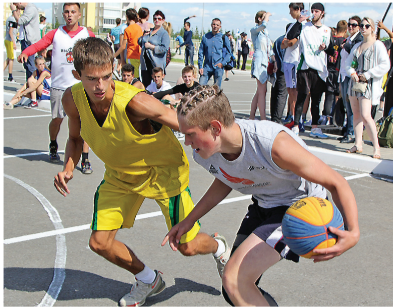
Стритбол в разгаре.

В День города-2018 на площади ФОК «Президентский» прошел большой спортивный праздник.