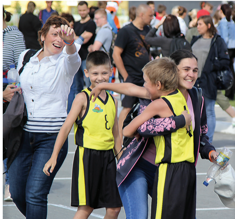
Вот так радовались победам в стритболе.

Настоящий ажиотаж среди родителей вызвали детские гонки на самокатах. Здесь было