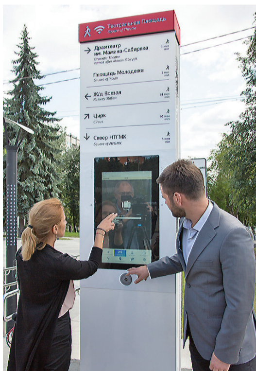
Интерактивный путеводитель по городу.

Тагильчане заинтересовались информационным автоматом с навигационной системой и большим набором функционала в Центральном сквере. Он появился в преддверии Дня города. Как нам сообщили представители Уральского оптико-механического завода, чьей новинкой является инфомат, это – информационно-навигационная стена. Завод представил ее на выставке «Иннопром-2018». Пилотная стена была установлена в Екатеринбурге к чемпионату мира по футболу. Теперь по договоренности с городскими властями решили сделать такой подарок и Нижнему Тагилу.