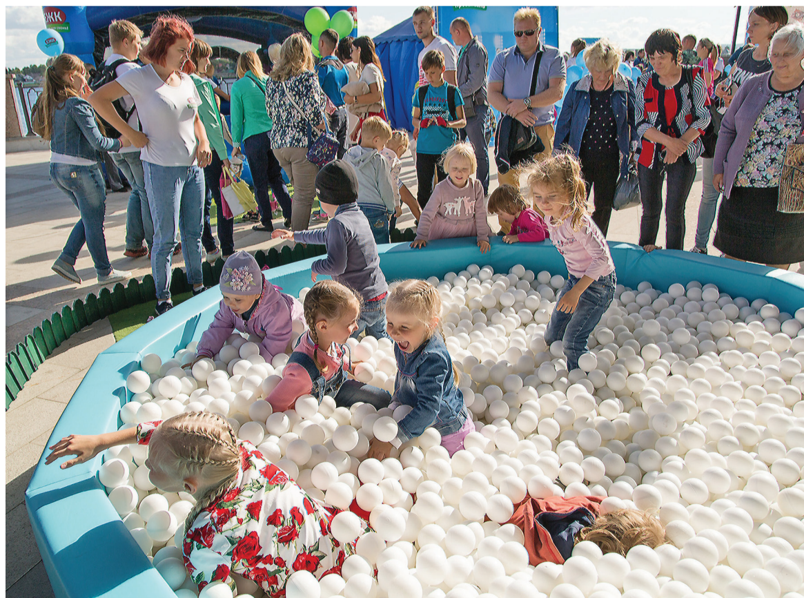
Игры для детей на набережной.