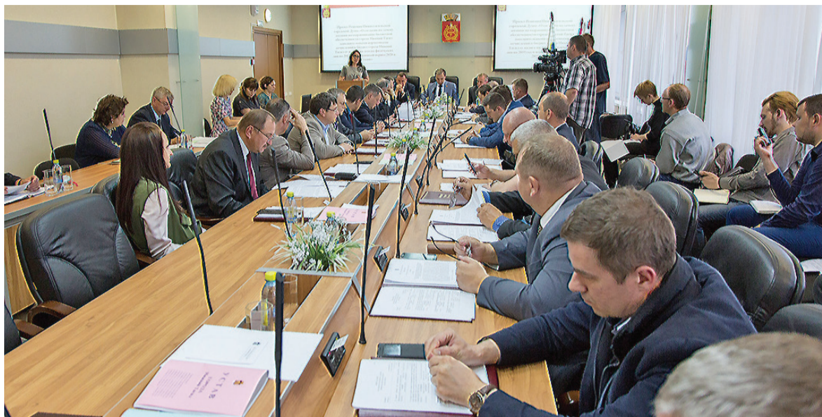
Внеочередное заседание местного органа власти.

никам конкурса на должность главы города являются возраст от 21 года, высшее професси-