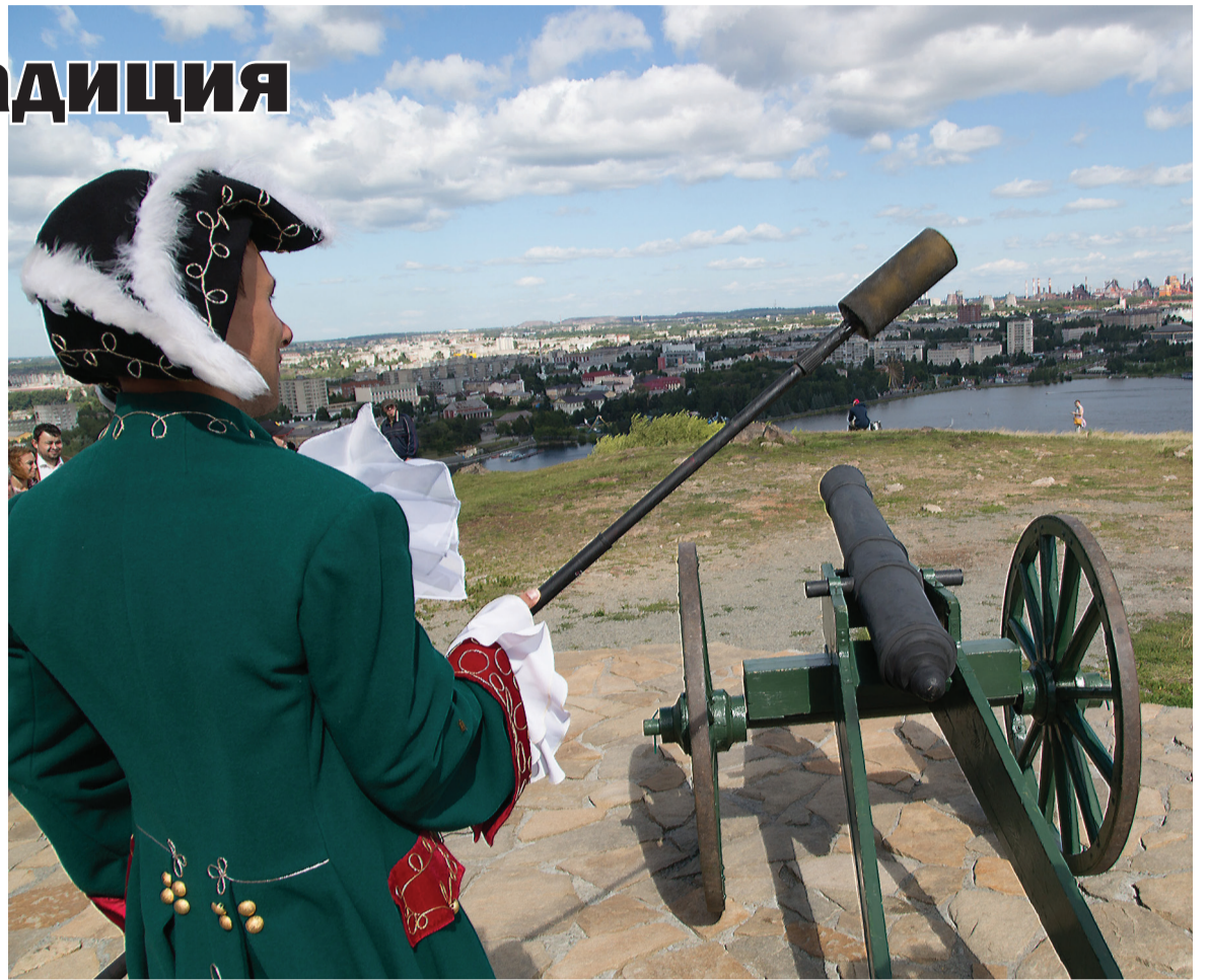
Залп из пушки известил о начале праздника.

В «Городе на горе» (именно так называлась программа) были и двор добрых дел, и фотороща, и библиотека. Сильный ветер, поднявшийся днем, ничуть не помешал празднику. Предприниматели города обу-