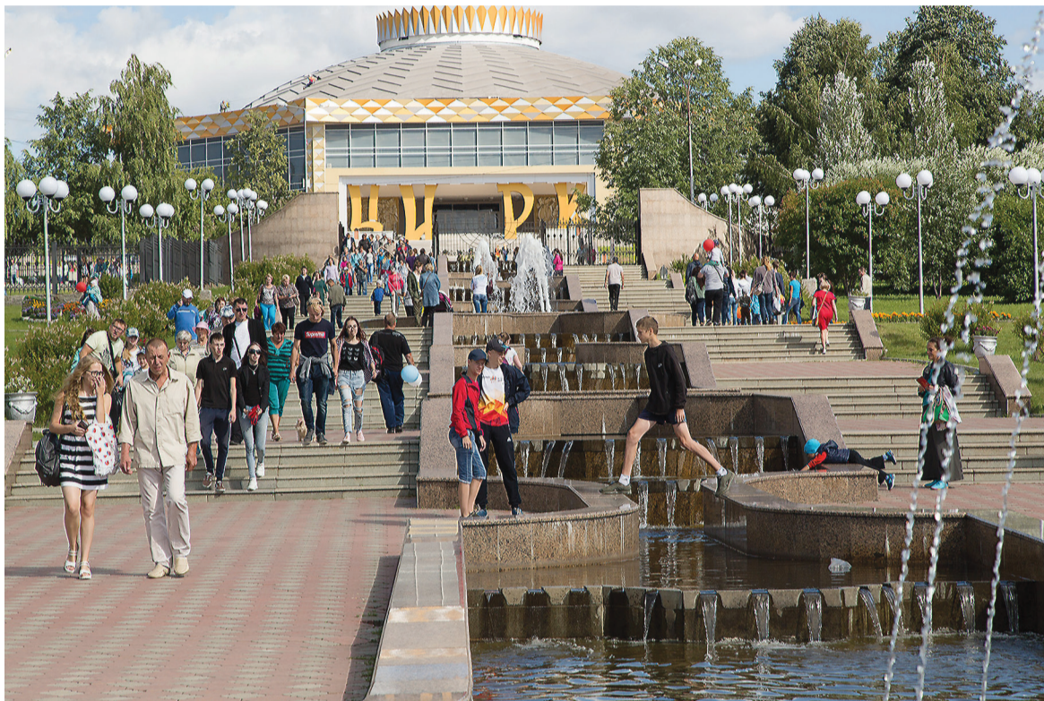
В парке имени А. П. Бондина.

выстраивалась очередь из желающих сфотографироваться.