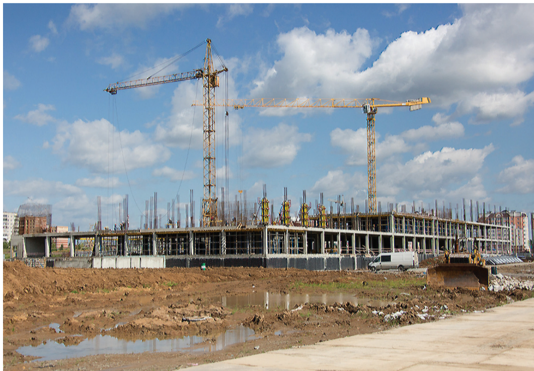
Возводится второй этаж.

В рамках празднования Дня города губернатор Свердловской области Евгений Куйвашев посетил Нижний Тагил. Глава региона побывал на стройплощадке школы на Муринских прудах, оценил технические возможности нового низкопольного трамвая УВЗ и увидел в действии интеллектуальную систему управления городским освещением.