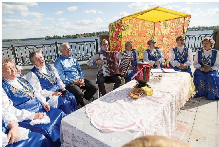
Выступление хора ветеранов.