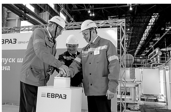
Запуск нового шаропрокатного стана.

Инвестиции ЕВРАЗа в проект составили около 1 млрд. руб. 300-метровая линия шаропрокатного стана была построена за год. В цехе будут производить шары диаметром 60-120 мм пяти групп твердости. Высокая твердость по всему сечению самых прочных заготовок достигается с помощью сквозной прокаливаемости. Технологию закалки разработала российская компания ТЭК. Во время этого процесса каждый шар находится в отдельной ячейке в закалочном барабане.