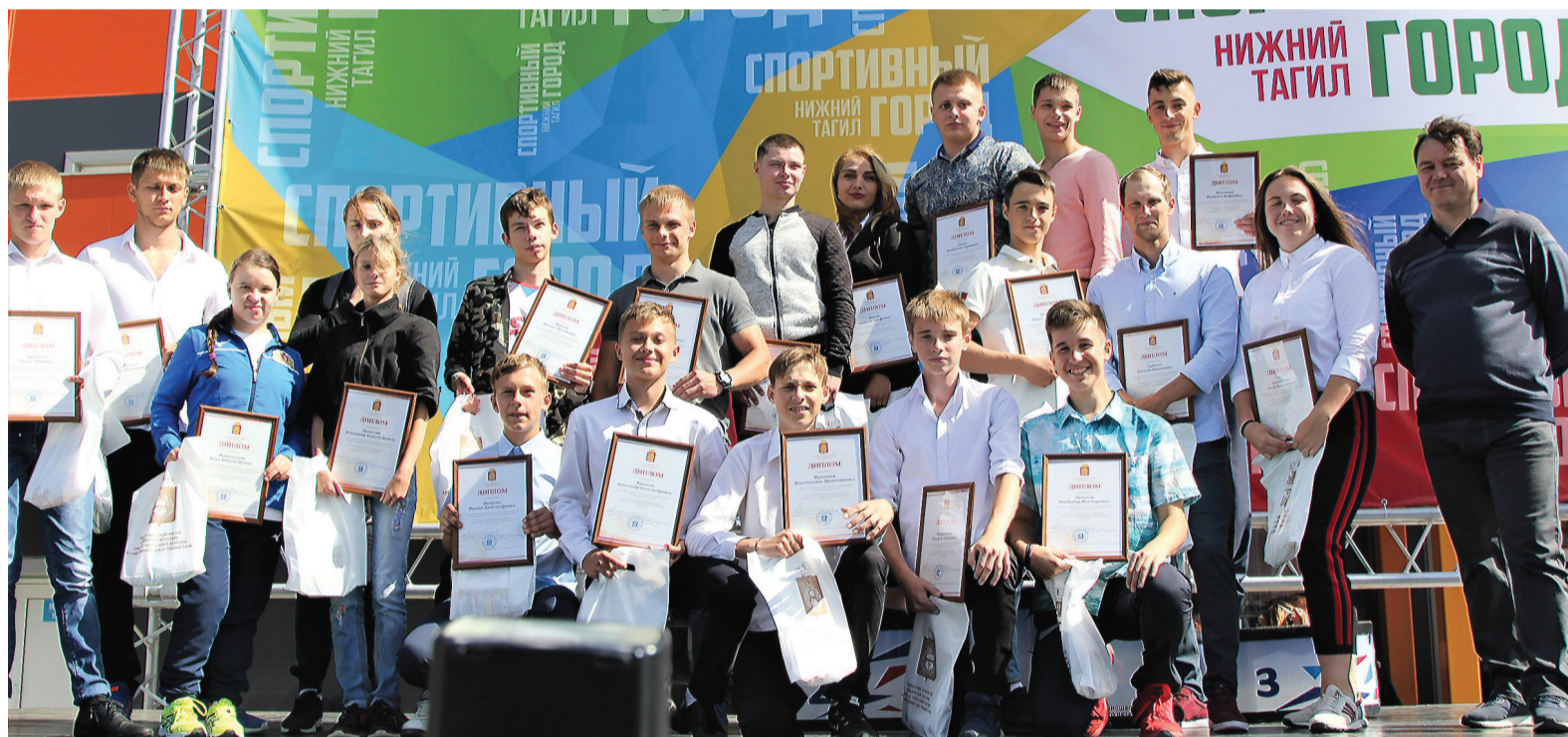
Наградили лучших представителей различных видов спорта - от пауэрлифтинга до баскетбола.

В самой юной категории участников (мальчики 10 лет и младше), как и в компании муж-