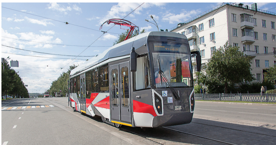
Инновационный трамвай на улицах города.