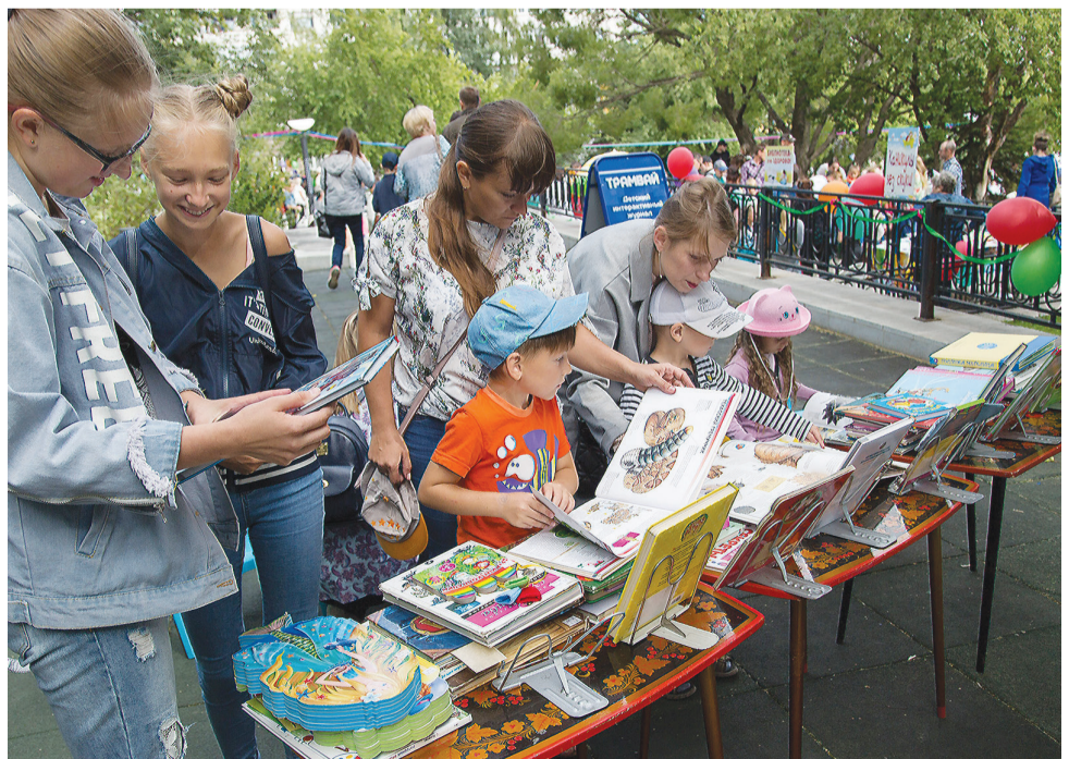
Читальный зал под открытым небом.

Людмила ПОГОДИНА.