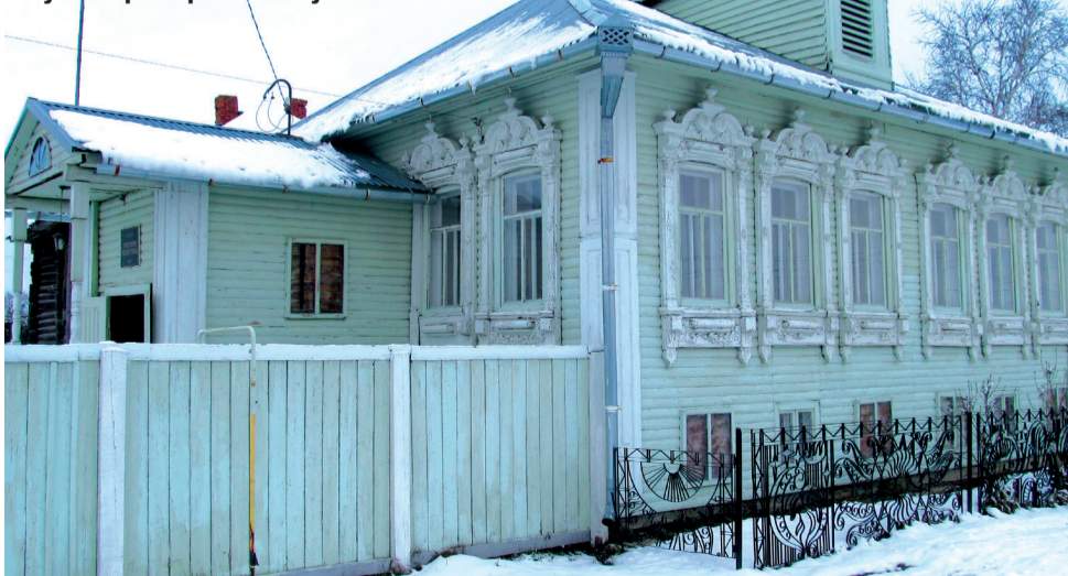
Музей Григория Распутина