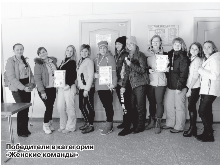
Победители в категории «Женские команды»