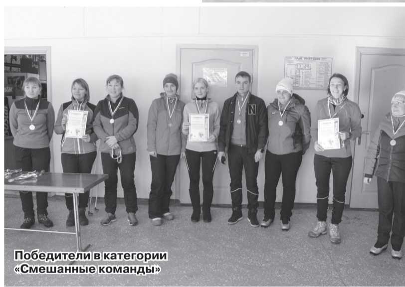
Победители в категории «Смешанные команды»

КОПИРОВАНИЕ A4 СКАНИРОВАНИЕ A3 ОТПРАВКА по электронной почте РАСПЕЧАТКА ул. Юбилейная, 6 т. 3-02-52