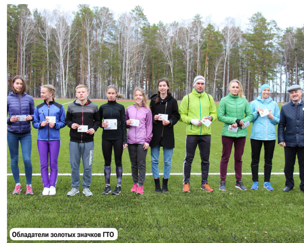
Обладатели золотых значков ГТО

Нынешняя эстафета уникальна тем, что организаторы сменили локацию проведения этого соревнования: отошли от привычного забег по поселковым автодорогам и опробовали беговые дорожки нового стадиона. Это помогло избежать перекрытия дорог для автотранспорта и сделать бег более безопасным для участников.