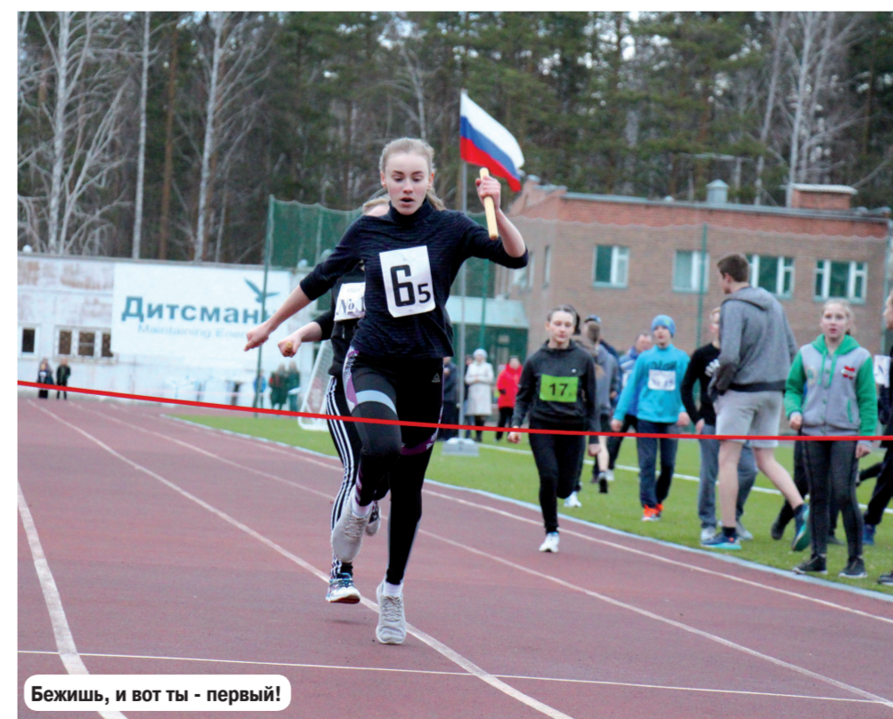
Бежишь, и вот ты - первый!

В эстафете 4x100 среди девушек победила команда «Олимп», среди юношей - команда СУВУ. В спринтерском командном забеге лучшими стали: «Дитсманн» (предприятия), СУВУ (специальная группа), школа №6 (10-11 классы), школа №8 (8-9 классы),