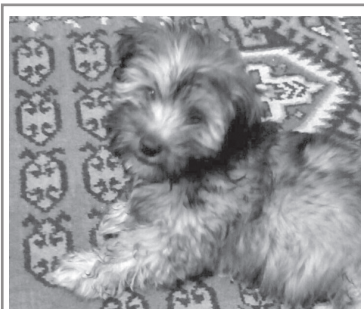
Найдена собака, около больницы – 89502037279.