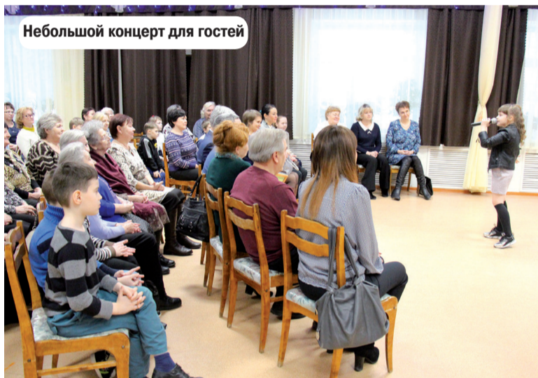
Небольшой концерт для гостей

Отдельная благодарность была выражена тем предпринимателям и жителям, кто в 2017 году поучаствовал финансово в