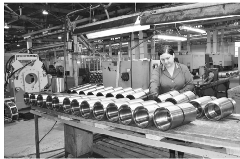
Готовые изделия - на контроле ОТК