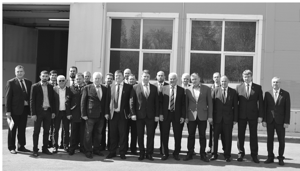
Почетные гости вместе с представителями Серовского механического завода