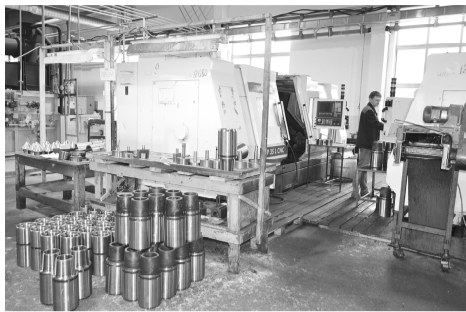
Изготовление замков для бурильных труб

В одном из первых на заводе в цехе 9 в 1986 году была построена сауна с бассейном. Запись на её посещение была на три-четыре месяца вперёд. Большая заслуга в этом нововведении энергетика цеха 9 Э.Г. Эйзенах.