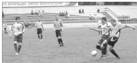
Момент матча городского чемпионата между «Динуром» и «Факелом»

Таким образом, в четвертьфиналах 22 июня и 6 июля встретятся «Динур» и «Кедр», «ЭЛЕМ» - «Синара», «Горняк» - «Регион», «Реж» - «ФОРЭС». Кто в первом раунде будет хозяином поля, а кто гостем – станет известно после жеребьевки.