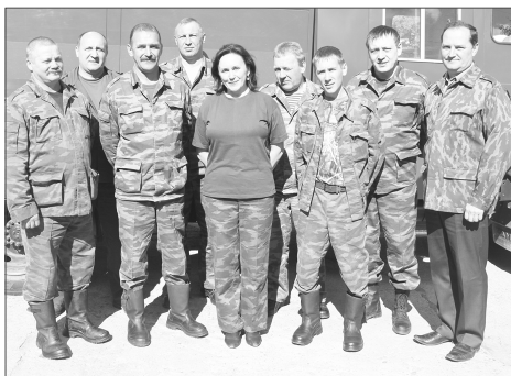
Коллектив «Пожарной безопасности»

но 2-этажное, на четыре конных везеда. Внизу располагались конюшня и дежурная комната, на втором уровне – помещения личного состава. Находилась необычная служба с запад-