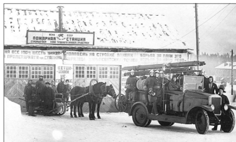
Пожарная станция ПНТЗ 1932 год

СПОРТ. Без него никак нельзя – физическая закалка пожарному необходима всегда. Порой палочкой-выручалочкой обрывается время. У каждого в юности было какое-то приращение. Ребята находят общие увлечения, устраивают физкультурные паузы – азартно играют в футбол, зимой гоняют по снегу шарик или шайбу.