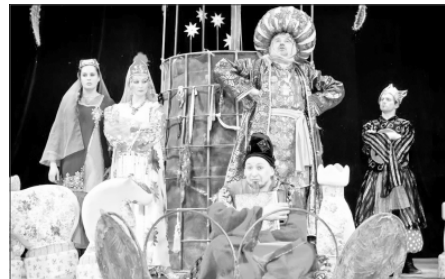
Сцена из спектакля «Волшебная лампа Алладина»

Яркие театральные постановки лучших коллективов России посмотрели порядка 3500 юных зрителей из Первоуральска, Шалинского района, поселков Прогресс, Новотуринск, Крыловское. Помимо сказочного представления, каждый ребенок получил частичку тепла, заботы и, конечно же, сладкий сюрприз.