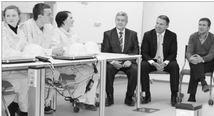
Беседа в образовательном центре ПНТЗ

На прошлой неделе инвестиционные объекты ПНТЗ и новый учебный центр предприятия посетили делегация министерства промышленности и торговли Российской Федерации.