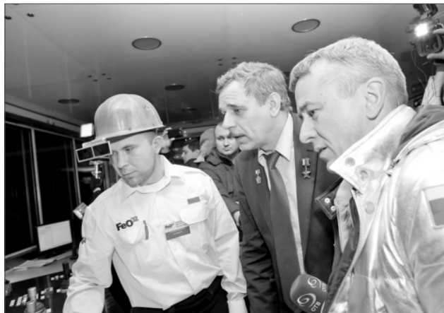
... А здесь всё на современном уровне: новая техника, люди в белой униформе. Кстати, в порядке эксперимента на орбите мы выращивали кремниевый кристалл: было что-