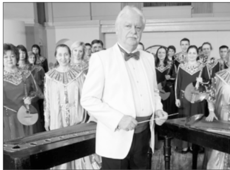
Главный дирижер, Народный артист России Владимир Андропов

В завершении выступления поинтересовалась у концертмей-