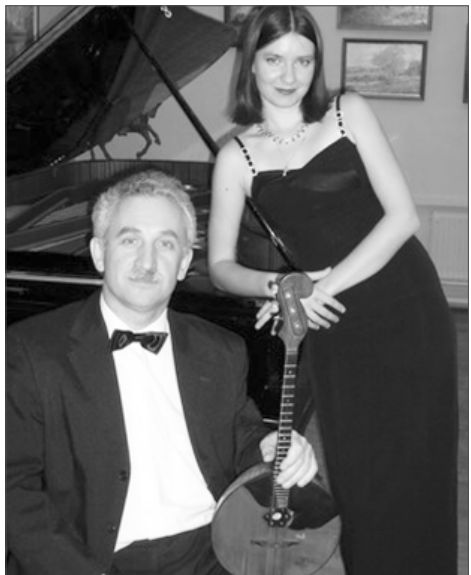
Концертмейстер, Народный артист России, профессор Сергей Лукин