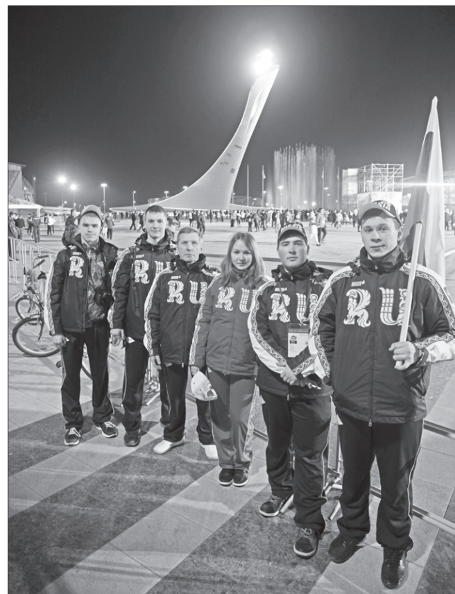
Олимпийская сборная Первоуральска. Студенты преподнесли в дар музею свою групповую фотографию из Сочи

Собственно, эта забота осуществляется не только на высоком уровне. Как извест-