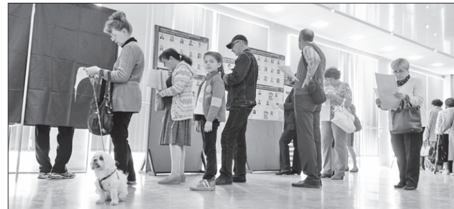
На избирательных участках было многолюдно