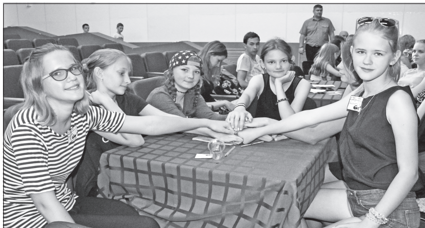
Гагаринцы участвуют в интеллектуальной игре "Что? Где? Когда?"