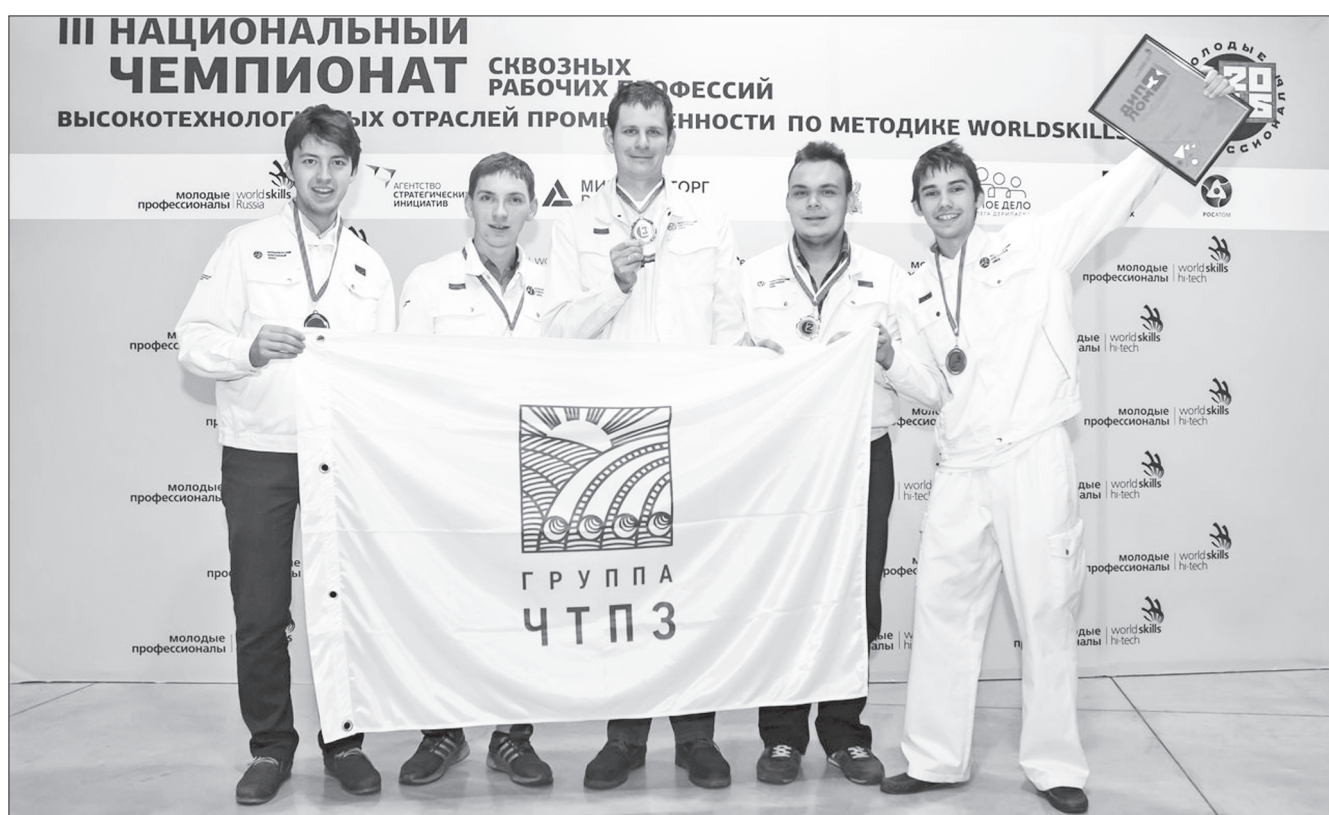
Команда Группы ЧТПЗ на чемпионате WorldSkills Hi-Tech 2016 завоевала 4 медали