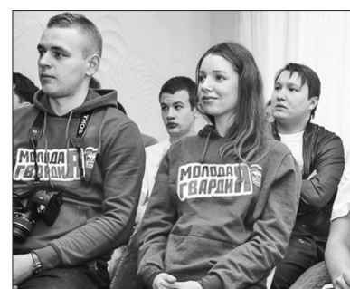
для которых общественная работа может стать трамплином в разных сферах деятельности, в том числе, в политике.

Перед дружным коллективом «Молодой Гвардии» – серьёзные задачи. План значимых для города мероприятий активисты составили на несколько месяцев. Во многом надежда на начинающих соратников,