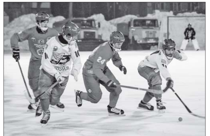
Фрагмент победного для «Трубника» первого матча с «Водником» в Первоуральске

Для «Уральского трубника» сезон завершён. Наша команда провела его выше всяких похвал, поднявшись с прошлогоднего 12-го места на пятое. В составе первоуральцев нет игроков национальной сборной, но «Трубник» был силен командной игрой, взаимовыручкой,