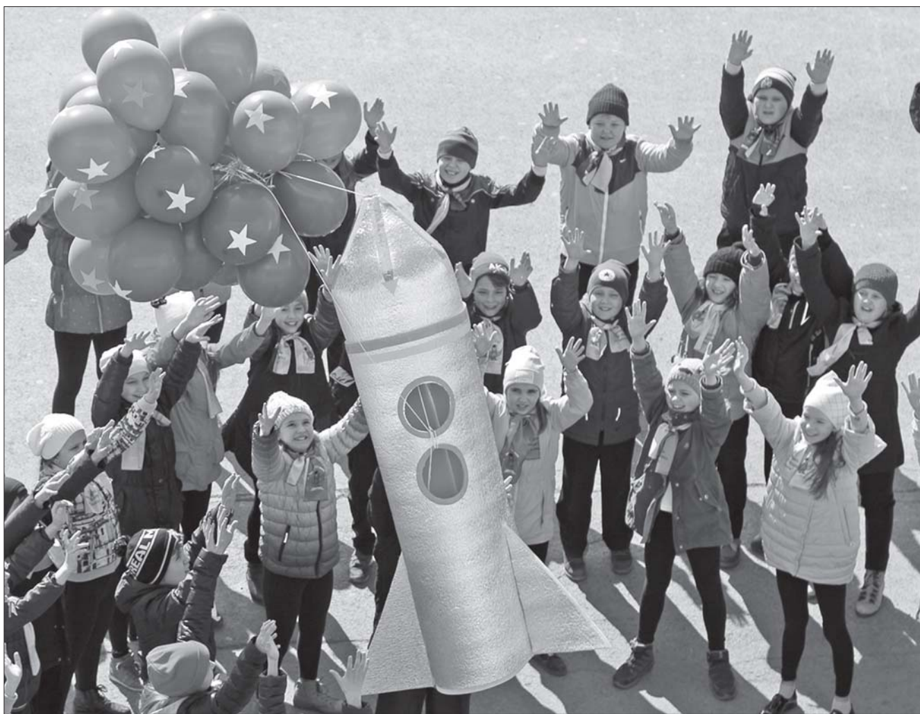
Школьники запустили в небо ракету, сделанную своими руками

Получили возможность приобрести жильё ветераны боевых действий и инвалиды. Для этого они самостоятельно заключают договор купли-продажи, либо договор долевого участия в строительстве. Оплата производится в безналичном порядке на расчётный счёт продавца (застройщика). Данная помощь со стороны государства позволит реально улучшить жилищные условия, ведь сумма выплат по каждому сертификату составляет почти 800 тысяч рублей. В числе претендентов на следующие выплаты ещё около 70 жителей городского округа.