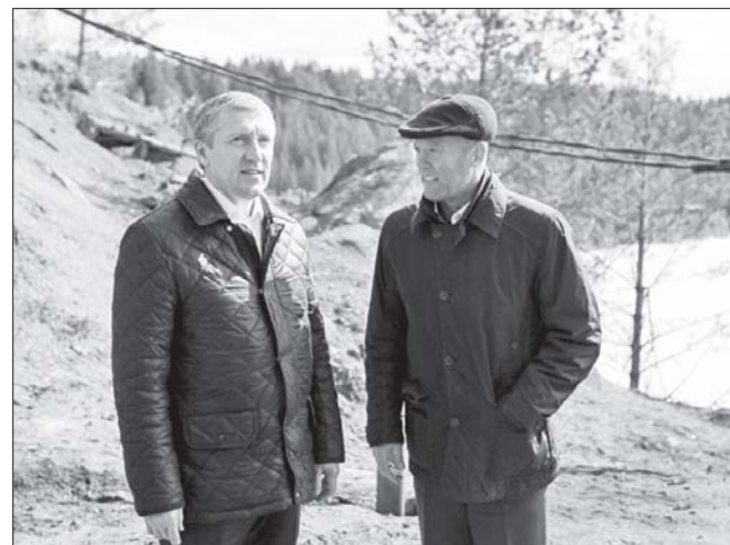
На Галкинском водохранилище

Напомним, что «зона подтопления» была более полувека назад заливными лугами. Потом выкопали Галкинский карьер глубиной 75 метров, заработал Билимбаевский рудник. Карьер топило, воду откачивали в Чусовую, но рудник обанкротился, насосы остановили, а потом демонтировали. Карьер – это своего рода колодец, площадью 35 тысяч квадратных метров. Когда он переполнялся водой, то начинались страдания жителей. Городские власти обратились за помощью в решении этой проблемы к учёным, которые разработали план