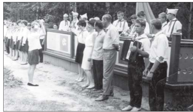
Открытие загородного пионерского лагеря «Орлёнок» в июне 1967 года

Сегодня у некоторых есть желание охаять комсомол и пионерии. Но в этих организациях, считаю, много было хоро-