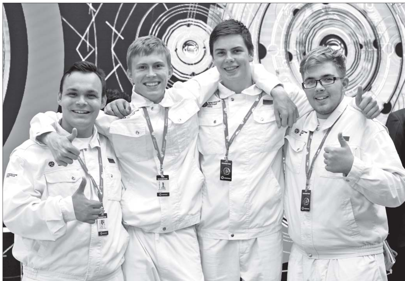
Студенты, обучающиеся по программе «Будущее белой металлургии», приняли участие в работе стенда Группы ЧТПЗ на ИННОПРОМЕ-2017