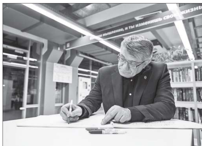
Режиссер Александр Сокуров в Образовательном центре Группы ЧТПЗ

За последние несколько лет Челябинский трубопрокатный и Первоуральский новотрубный заводы посетили публицист Анатолий Вассерман, писатель Алексей Иванов, лётчик-космонавт Михаил Корниенко, народные артисты России Константин Райкин и Сергей Гармаш, певцы Денис Майданов и Олег Газманов, архитектор Борис Бернаскони и другие.