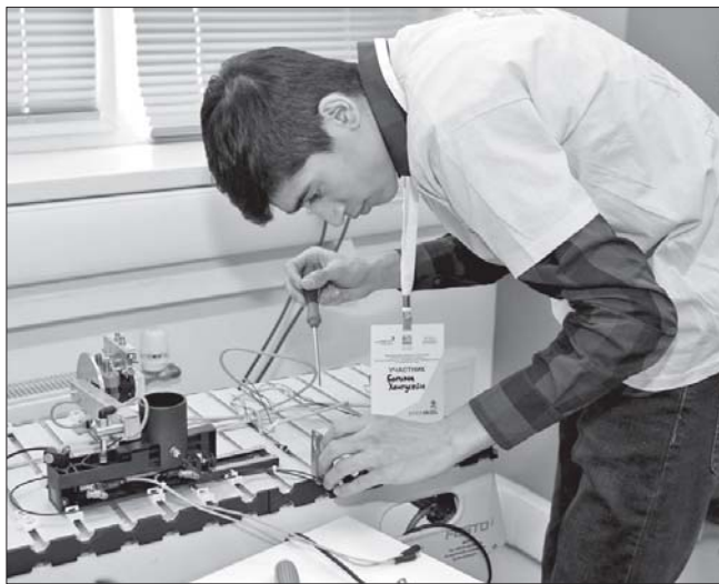
Три десятка молодых людей из шести команд уральских городов демонстрируют свои навыки в четырёх компетенциях

Победители регионального этапа получат возможность представлять Свердловскую область на национальном чемпионате «Молодые профессионалы» JuniorSkills, ко-