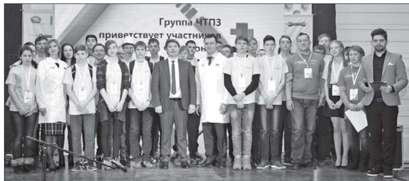
Образовательный центр Группы ЧТПЗ принимает региональный чемпионат JuniorSkills

Напомним, победителями чемпионата JuniorSkills в 2016 году в компетенциях «токарные работы на станках с ЧПУ» и «мехатроника» стали четверо школьников — воспитанников бесплатных кружков технического творчества, функционирующих в Образовательном центре ПНТЗ. Подопечные преподавателей программы «Будущее Белой металлургии» также стали призёрами национальных чемпионатов JuniorSkills.