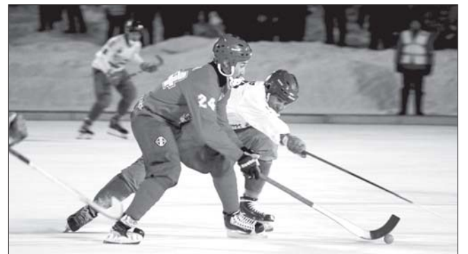
Фрагмент матча «Уральский трубник» – «Водник» в регулярном чемпионате

Если наши земляки выигрывают серию, они примут участие в финальном турнире четырёх лучших команд страны, который пройдёт 23-26 марта в Хабаровске. В полуфинале победитель нашей пары встречается с победителем противостояния «Байкал-Энергия» и «Кузбасса». Для проигравших в четвертьфинале сезон на этом будет закончен.