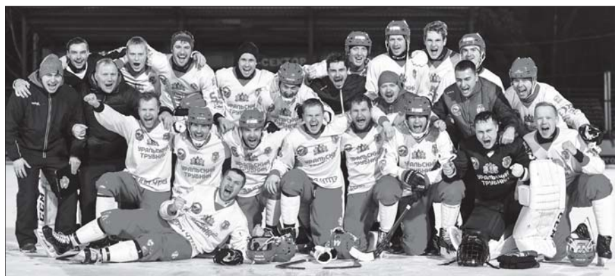
«Уральский трубник» – обладатель бронзовых наград чемпионата России 2018/2019!