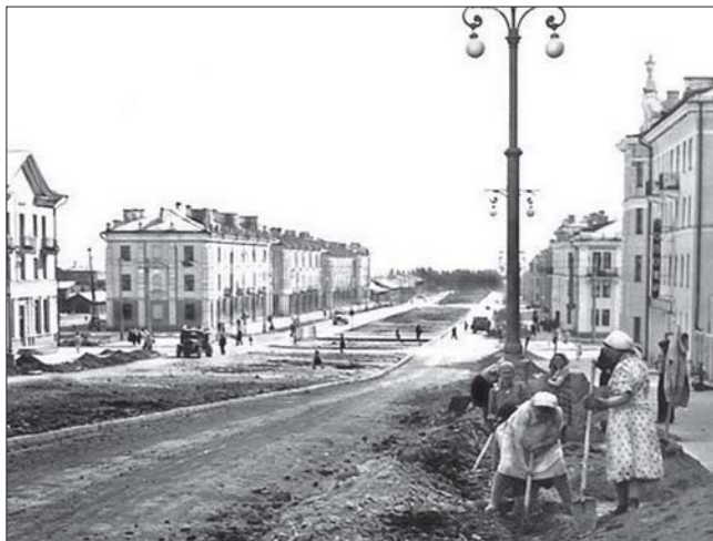
Строительство улицы Ватутина

– Несмотря на то, что стан был новый, уникальный, на нём работали опытные люди, в основном, фронтовики. Среди них, например, Виталий Степанович Тарарин – боец