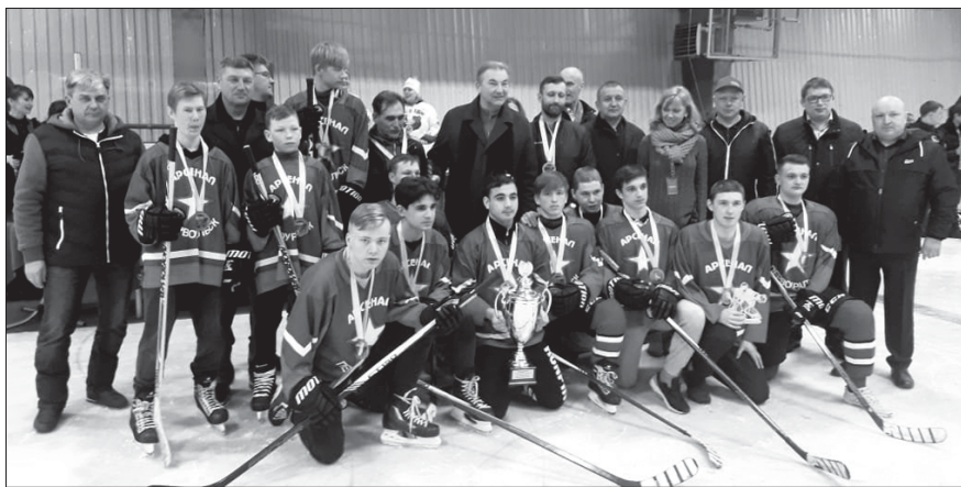
На областном турнире имени Владислава Третьяка среди команд детских домов первоуральцы стали победителями

– В Свердловской области существует очередь из желающих принять ребенка в семью – сейчас в этой очереди более 500 потенциальных родителей. Но дело в том, что люди готовы взять маленьких детей, а тех, кто старше 10 лет, устроить в семью практически невозможно. Много случаев отказа от детей, когда их возвращают обратно в детский дом. К примеру, у нас таких двое – брат с сестрой, их дважды возвращали назад. И теперь практически невозможно возродить в этих детях доверие к людям и обществу. Они больше никому не верят! Это самое страшное и велика вероятность того, что из детей, которых вернули приёмные родители, вырастут асоциальные личности – озлобленные и разочарованные.