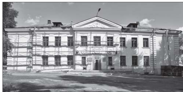
Школа № 15 в строительных лесах